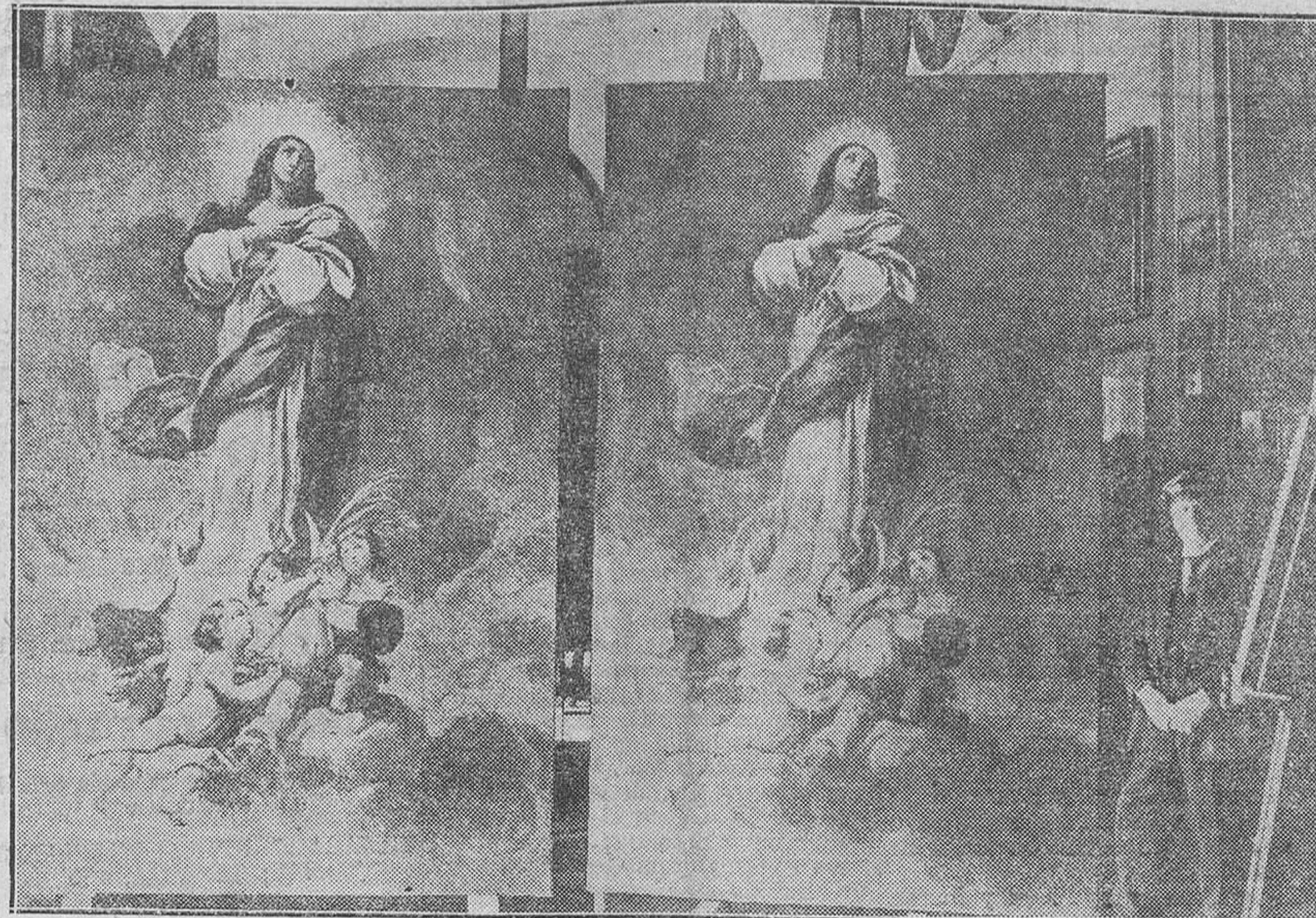
A la izquierda, el mosaico que el Papa ha ofrecido a la Universidad Católica de Washington, y que está copiado del célebre cuadro del pintor español Bartolomé Murillo, obra que se vé a la derecha. El mosaico pesa 36 toneladas y en su ejecución ha intervenido tres años de trabajo el mejor profesor de la Escuela del Mosaico del Vaticano