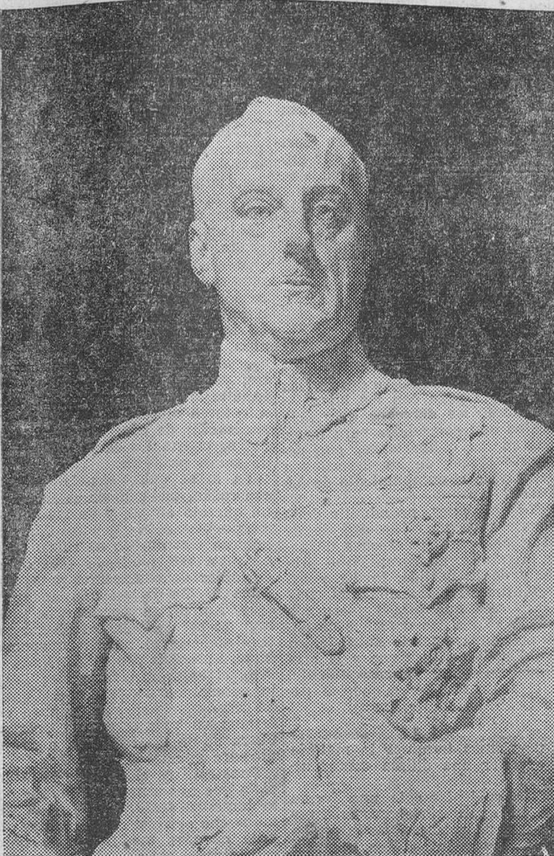
El busto en mármol del general Primo de Rivera, obra de Mariano Benlliure