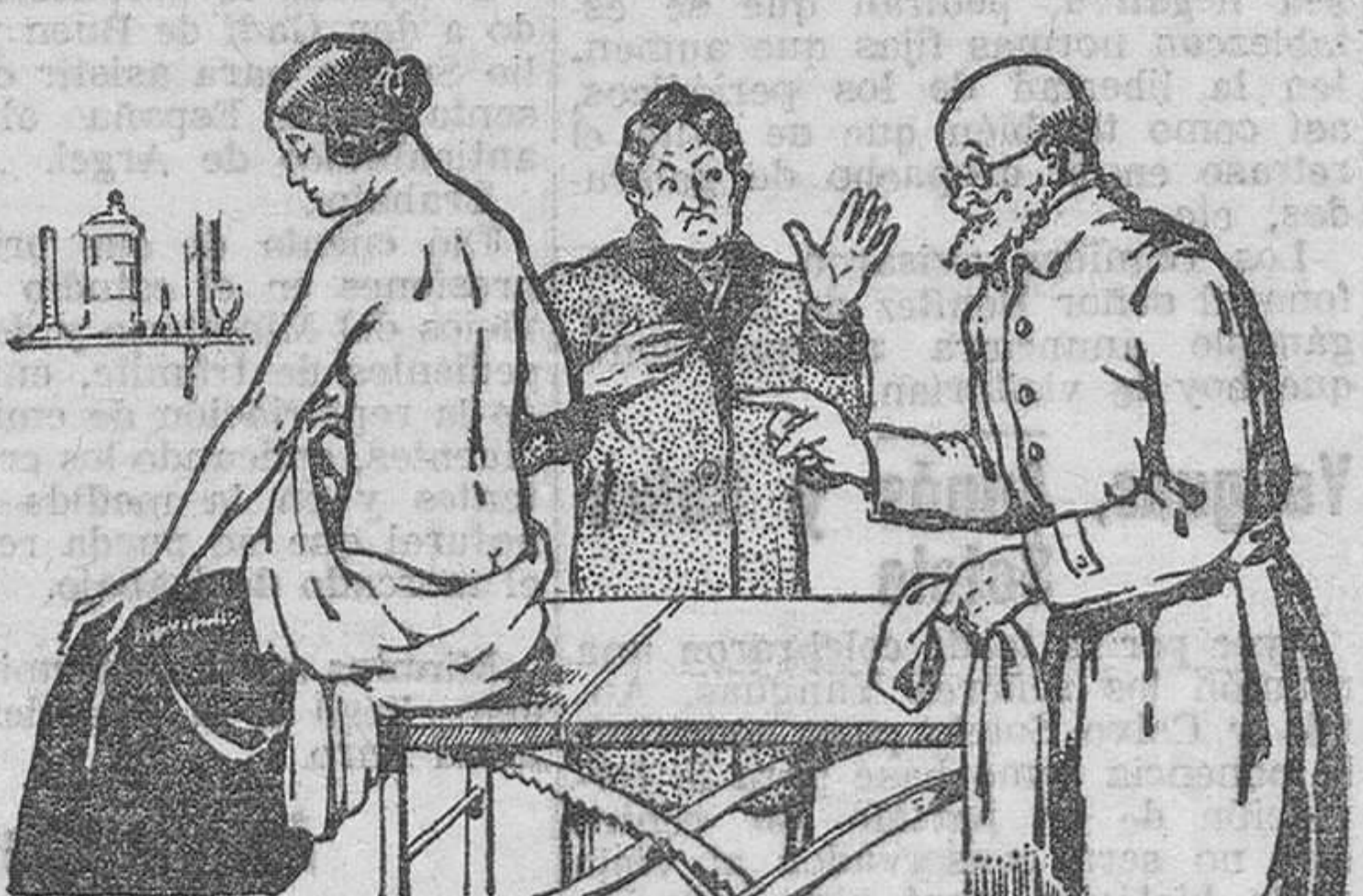
El Doctor. - En los riñones y en la espalda, debe aplicarse un EMPLASTO BERTELLI.

Los jerseys casi regalados y los demás artículos a precios ruinosos