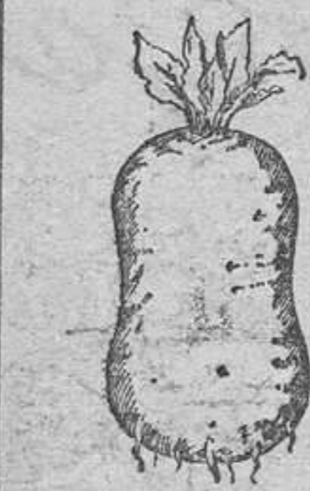
Nueva Remolacha forrajera

CASA VEYRAT Horticultura CAMINO DE ALGIRO'S, 13 — VALENCIA —