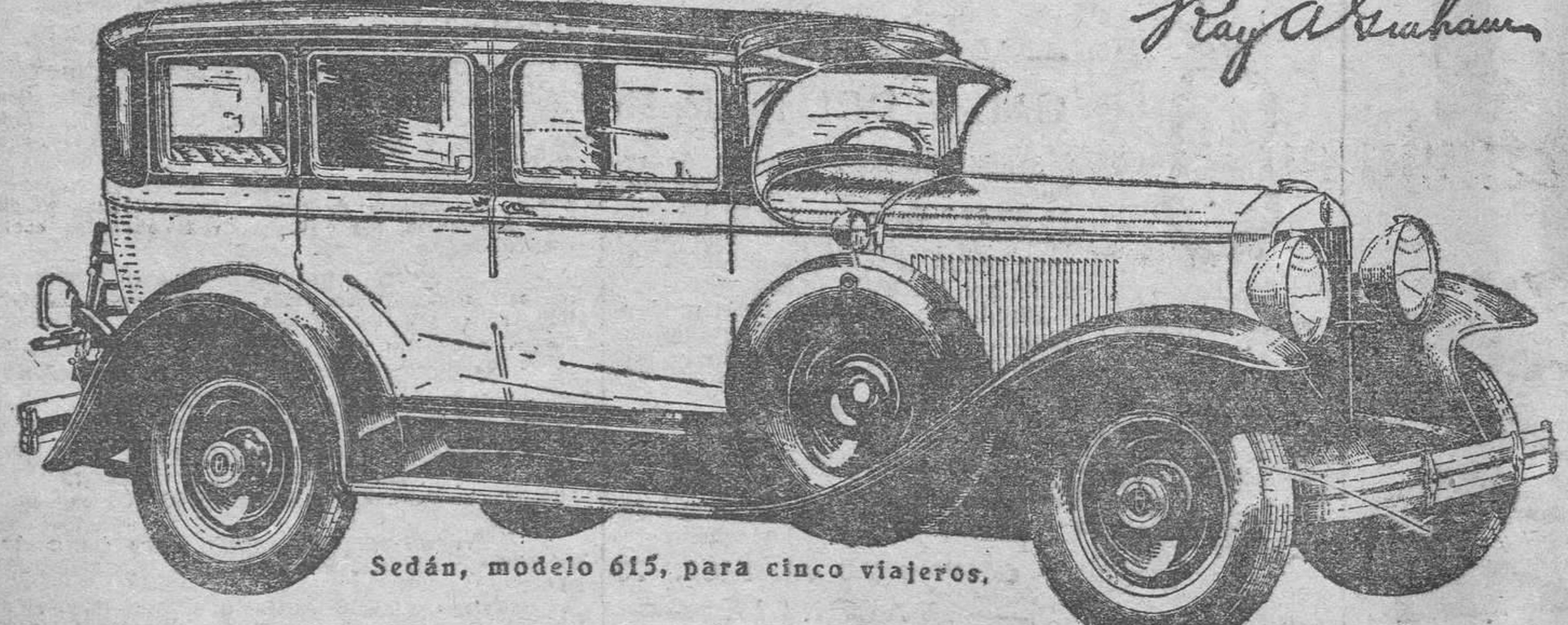
Sedán, modelo 615, para cinco viajeros.

Estos nuevos modelos Graham-Paige para 1929 ofrecen una gran variedad de carrocerías, incluyendo Roadsters, Cabriolets, Coupés y Sport Phaetons, sobre cinco chassis distintos, de seis y ocho cilindros, a precios al alcance de todos.