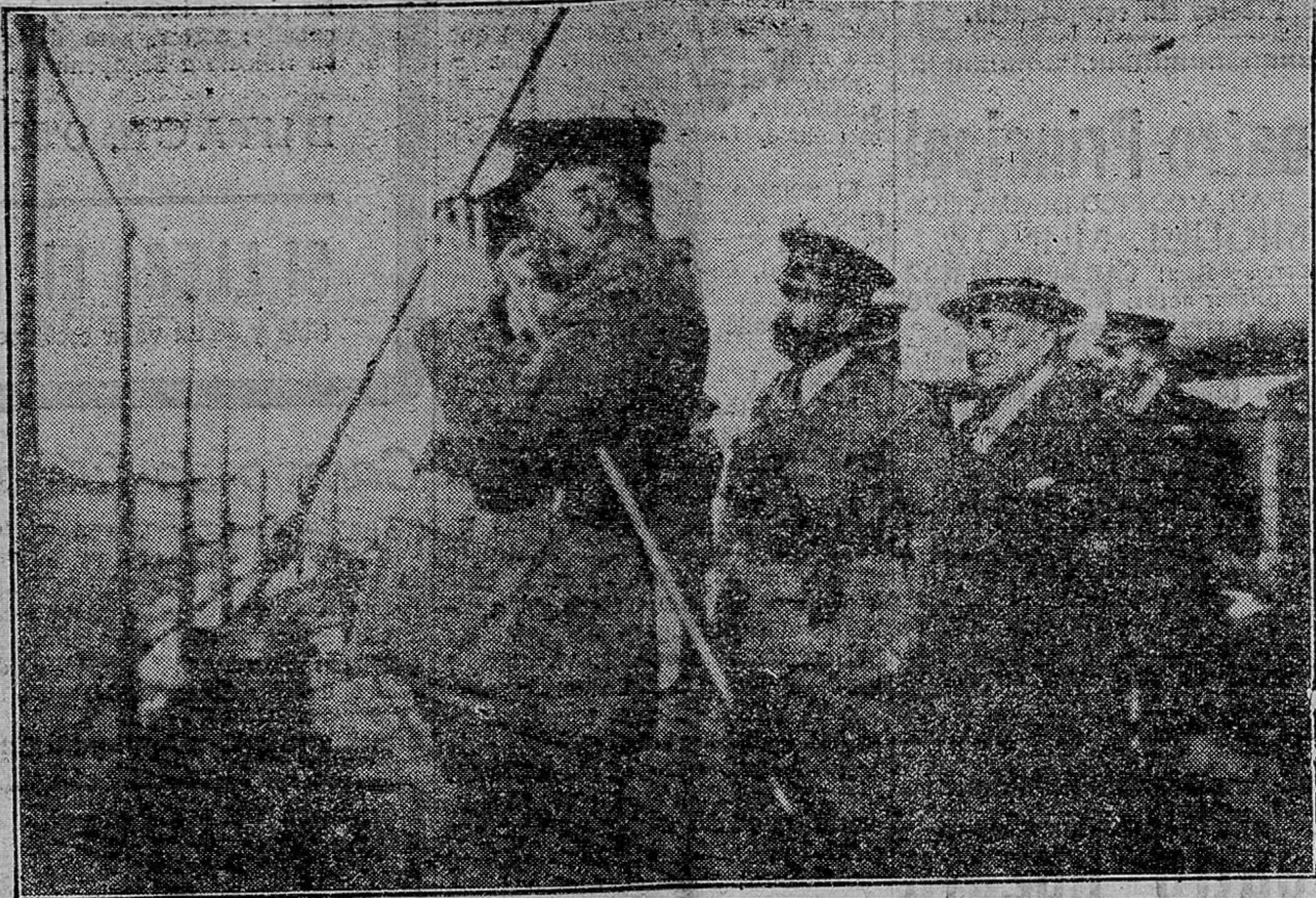
El Presidente del Directorio, general Primo de Rivera, a bordo del crucero «Cataluña», observando las operaciones que se realizan en tierra para socorrer y evacuar las posiciones del zoco Sept y posición Fracalt. En segundo término aparecen el general Navarro y el marqués de Sotelo, que recientemente fue a saludar al general Primo de Rivera