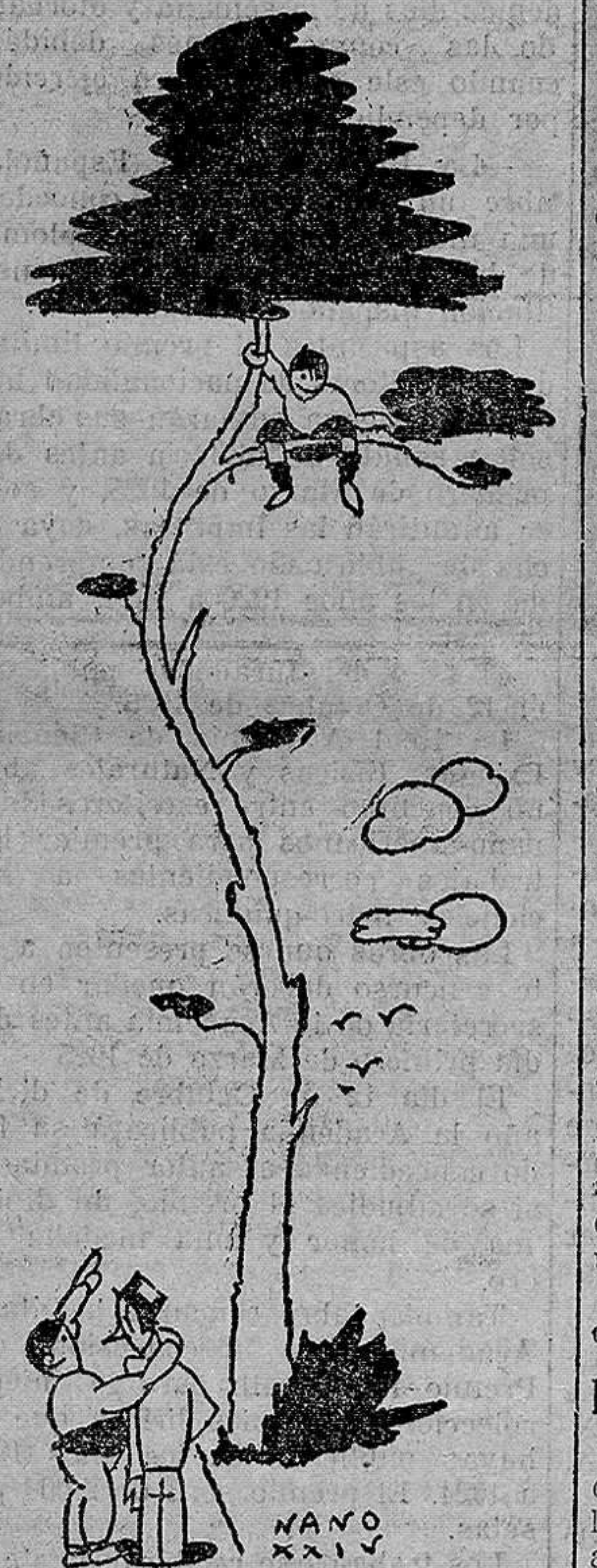
—Es un diablo este chico mio. Tiene siete años y fíjese dónde está. —¿Siete años dice usted? ¡Qué barbaridad; si que está alto!