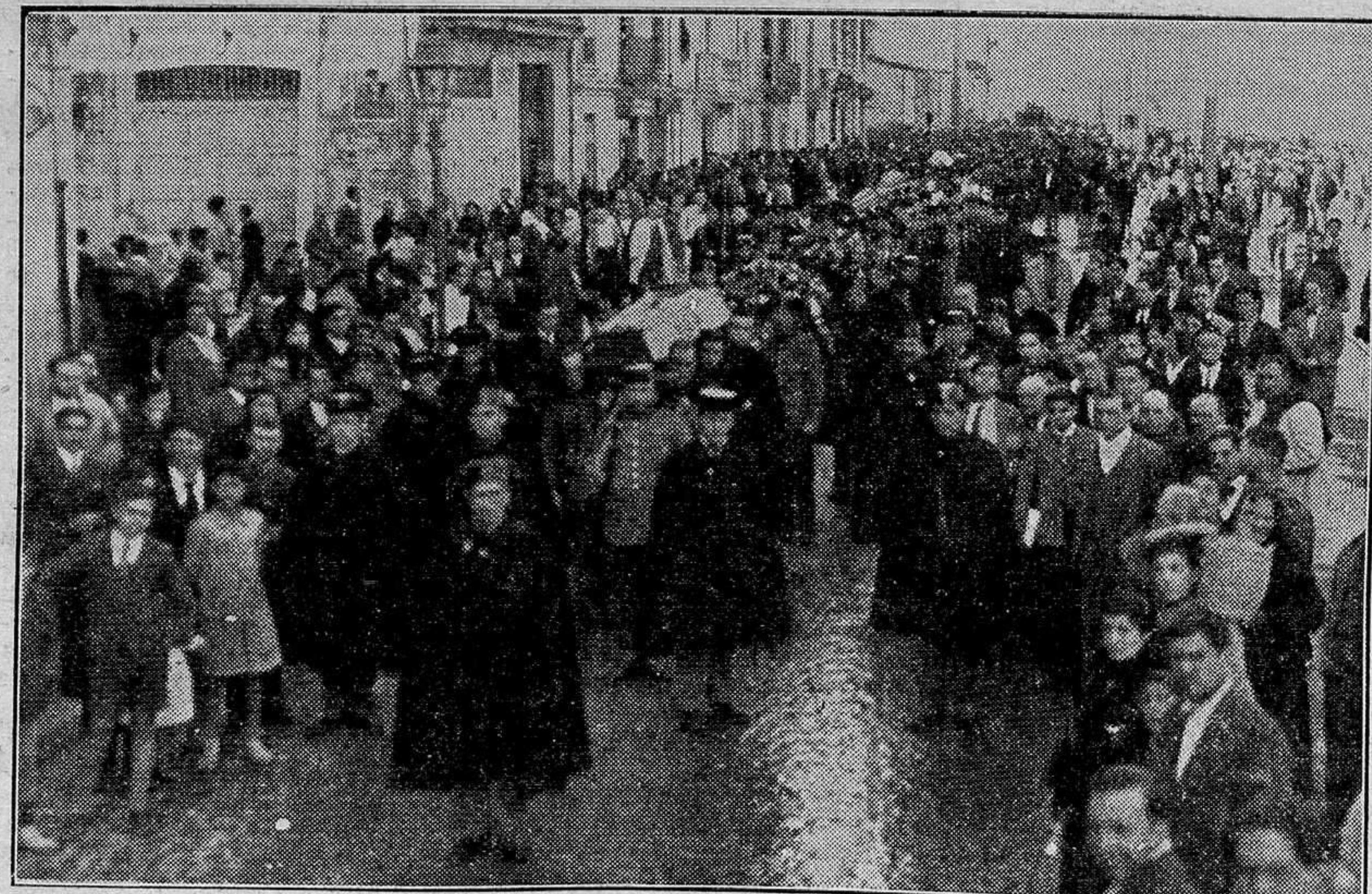
Valencia.—El entierro de las víctimas de Bugarrá, al paso por la calle de Guillén de Castro

El vecindario de Valencia, en gran parte, se conmovió al correr la fatídica noticia del fallecimiento de la distinguida señora, que tantas lágrimas enjugó con el bendito pago de su generosidad inagotable. La muchedumbre, con la terrible sorpresa de lo inesperado, sintió tan honda emoción que manifestó públicamente el sentimiento que la embargaba; prueba inequívoca de simpatía y sincero afecto hacia aquella mujer buena en todos los aspectos del vivir amable y generoso. Prueba pocas veces vista por su espontaneidad que incrementa su valor.