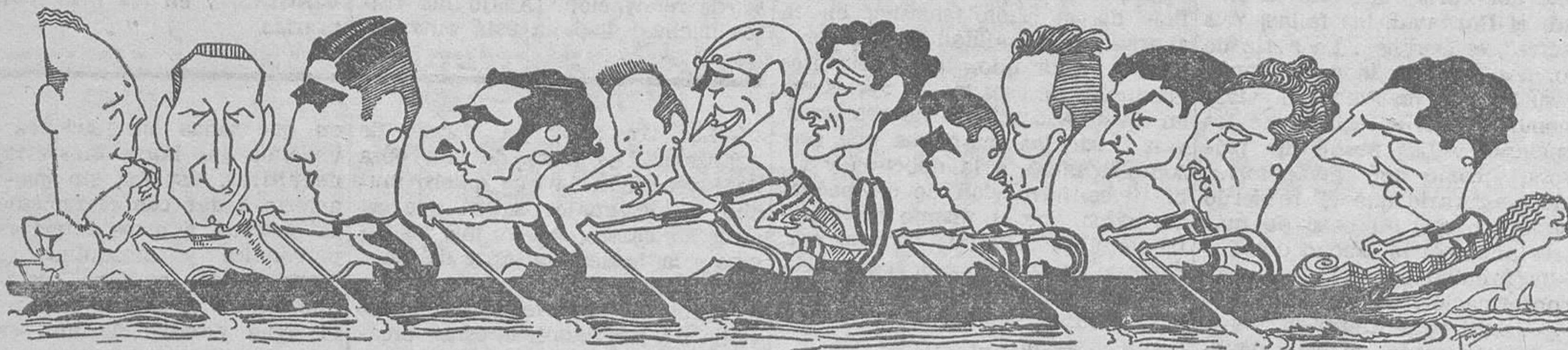
EL LEVANTE F. C., SUBCAMPEON regional 1933-34, visto por Tormo