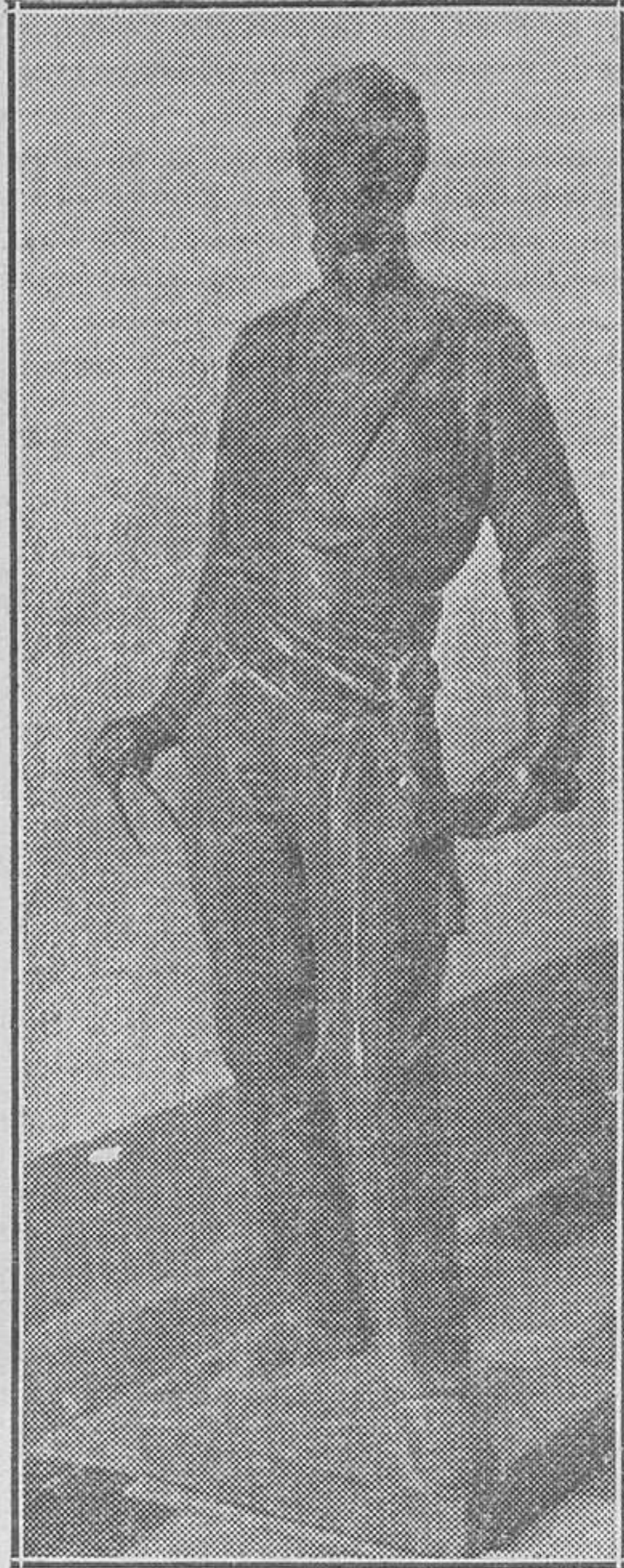
He aquí la bronceada figura del sabio que corona el monumento que la ciudad de Oliva acaba de levantar a su hijo predilecto don Gabriel Ciscar

Pero, ¿quién fué don Gabriel Ciscar?—preguntarán, acaso, ilenos de curiosidad muchos de mis lectores.—Para la mayor parte de