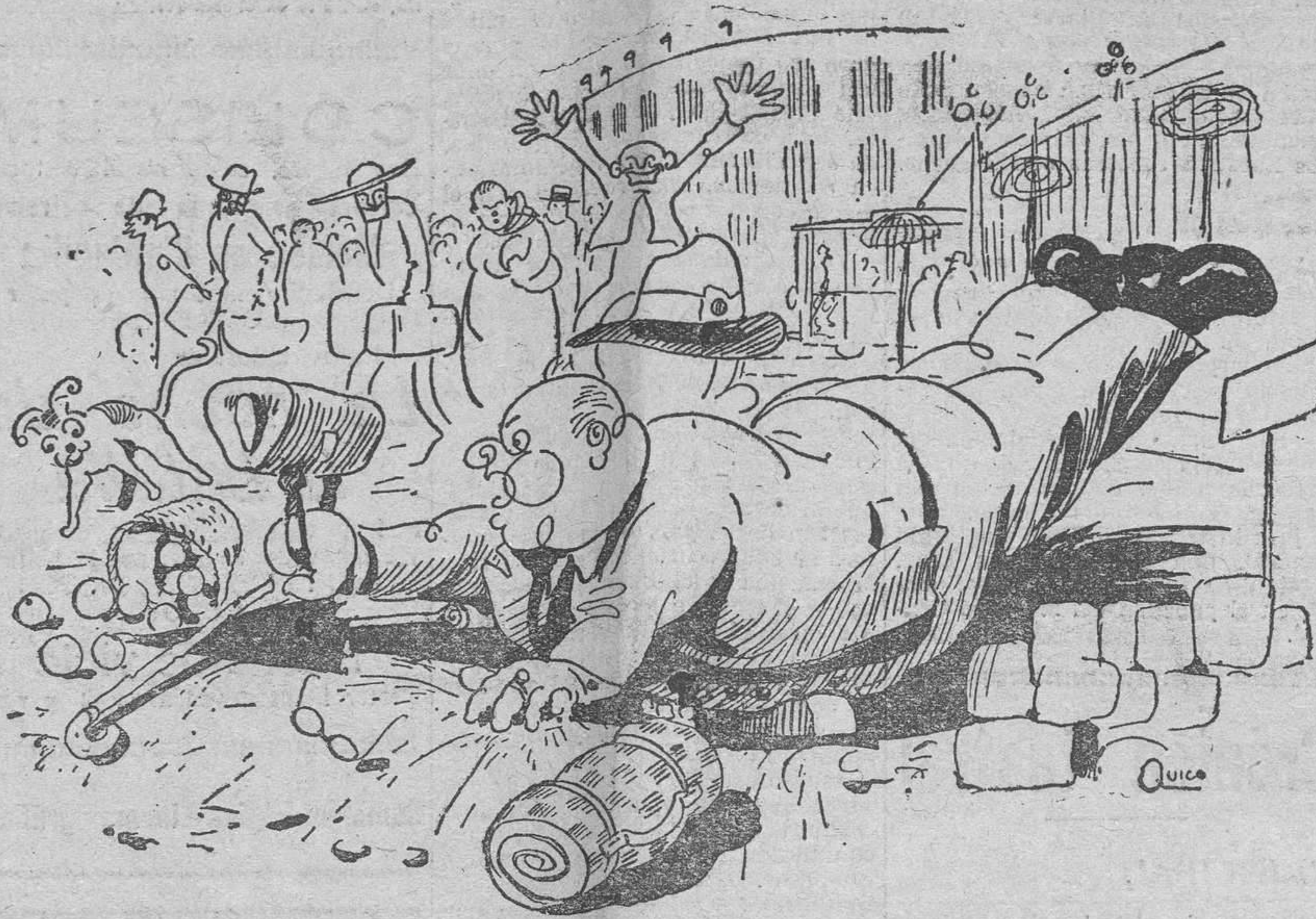
Ayer, al salir de la estación de los Ferrocarriles del Norte, resbaló y cayó este honorabilísimo pasajero, logrando con ello que pudiera exclamarse que el 'gordo' había caído en Valencia