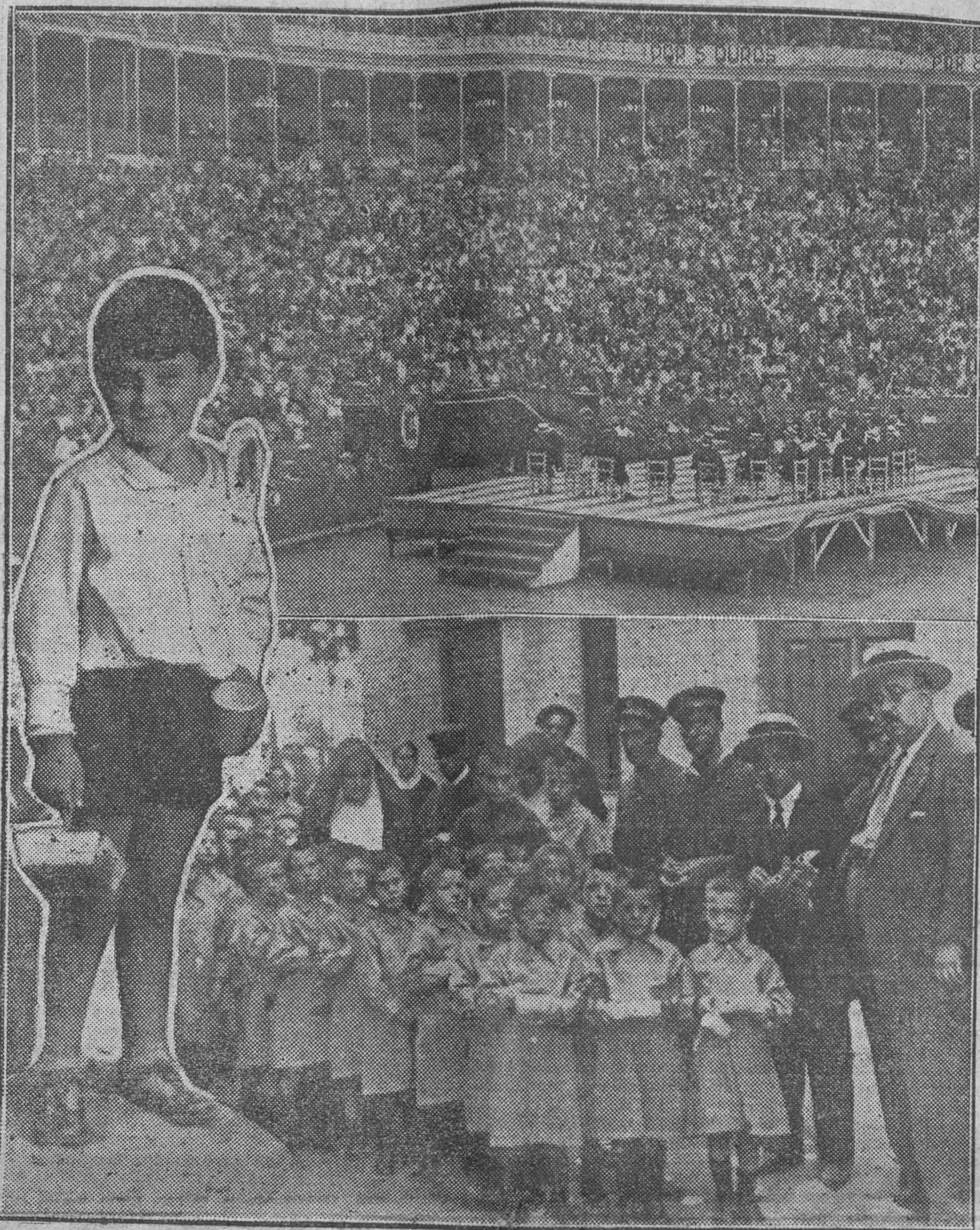
Por la delicada invitación del alcalde, los niños de los Asilos pudieron gozar la alegría de la fiesta.