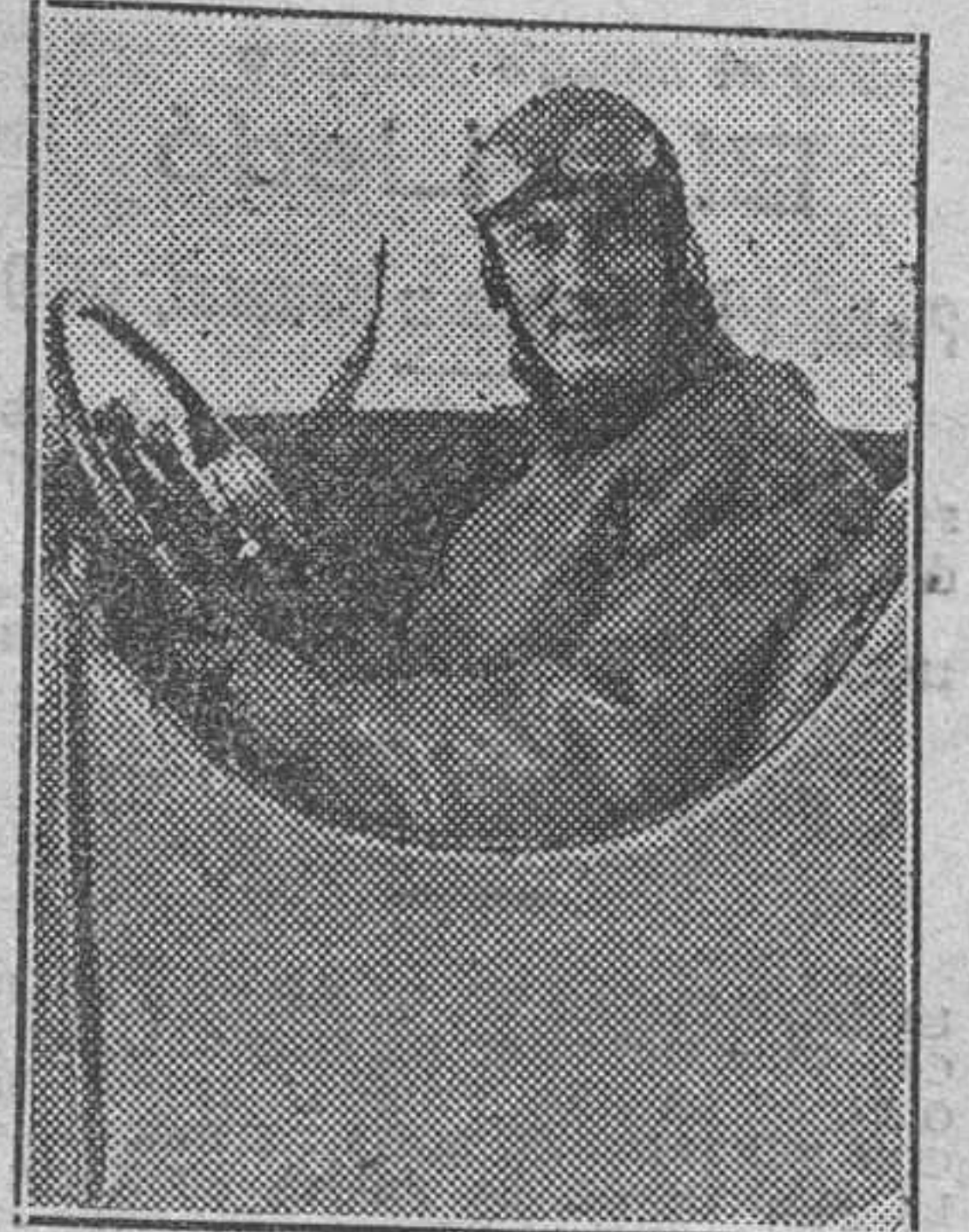
Bencist, ganador sobre Delage del Gran Premio de España