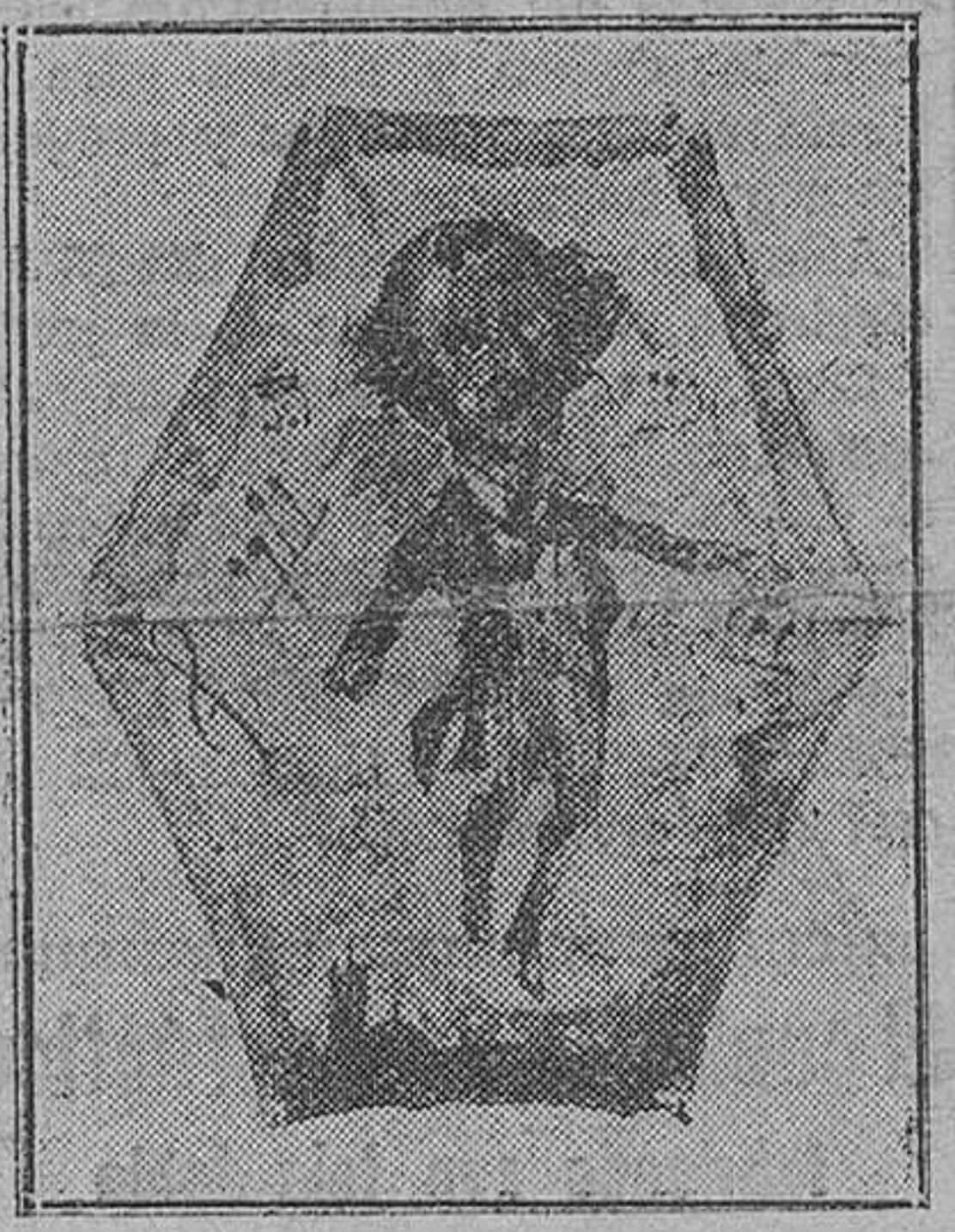
Cachirulo pintado por Sorolla

Cuanto a las "monas", eran una realización del sueño de Jauja. ¡Una "monada" grandiosa!