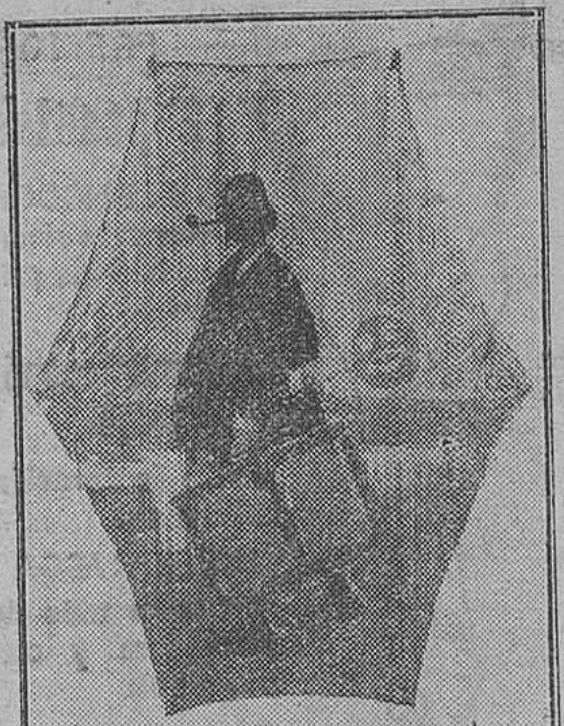
Cachirulo pintado por J. Benlliure

como, como decían los periódicos de antaño.