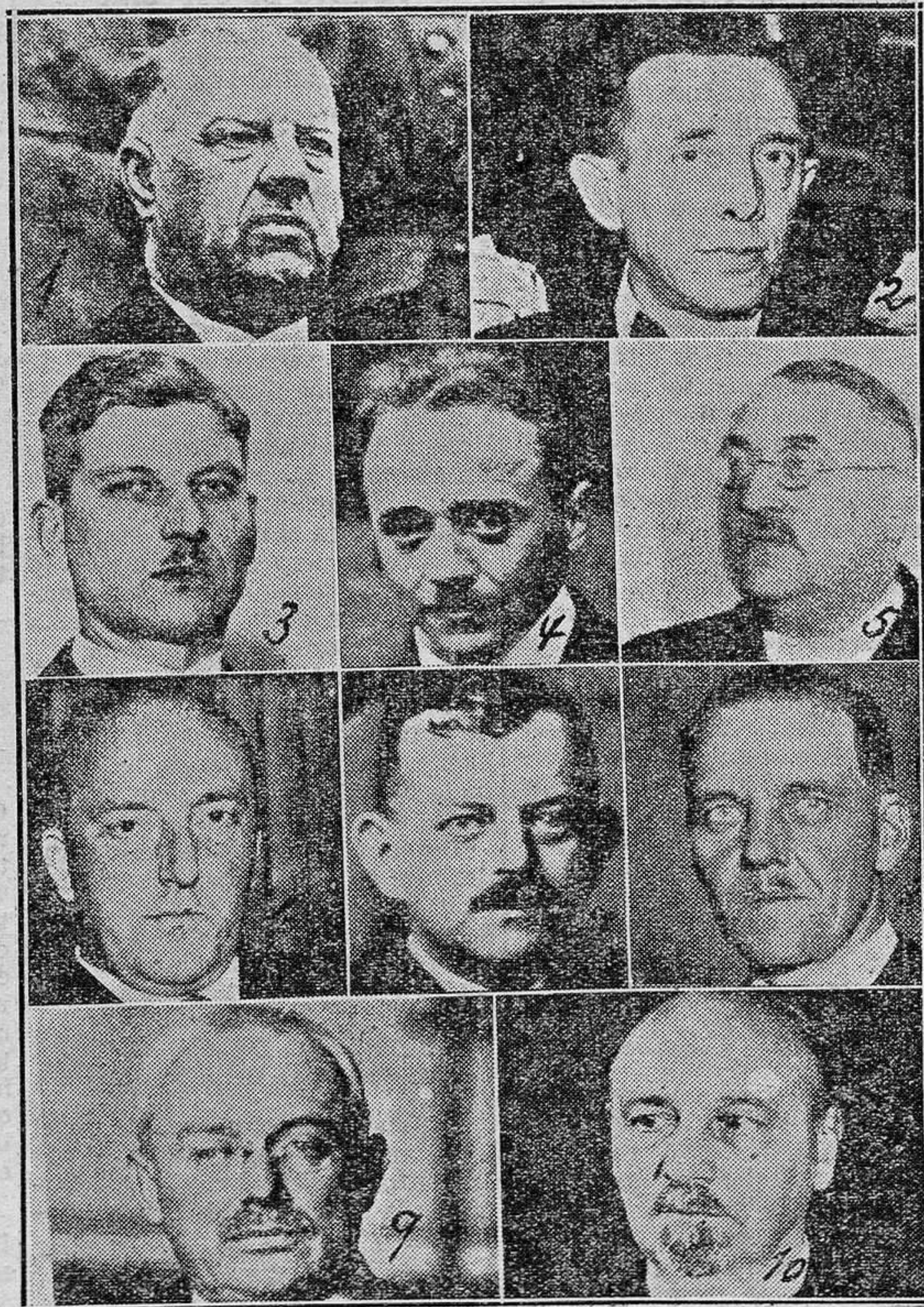
Después de unos días de activas conferencias, el nuevo Gabinete de Gobierno austriaco sucedió al del doctor Karl Buresch, y ha sido formado por una coalición entre los cristiano-social "Heimablock" y "Landbund", quedando formado el Gabinete por los señores siguientes: 1. Vaugoin, ministro de la Guerra; 2. Dr. Hermann Ach, Seguridad pública; 3. Dr. Karl Schuschnigg, ministro de Justicia; 4. Dr. Engelbert Dollfuss, canceller; 5. Dr. Josef Resch, ministro de Administración pública; 6. Dr. Guido Jakoncig, ministro de Comercio y Tráfico; 7. Franz Winkler, vicecanciller; 8. Franz Bachinger, ministro del Interior; 9. Dr. Anton Rintelen, ministro de Instrucción pública; 10. Weidenhoffer, ministro de Hacienda