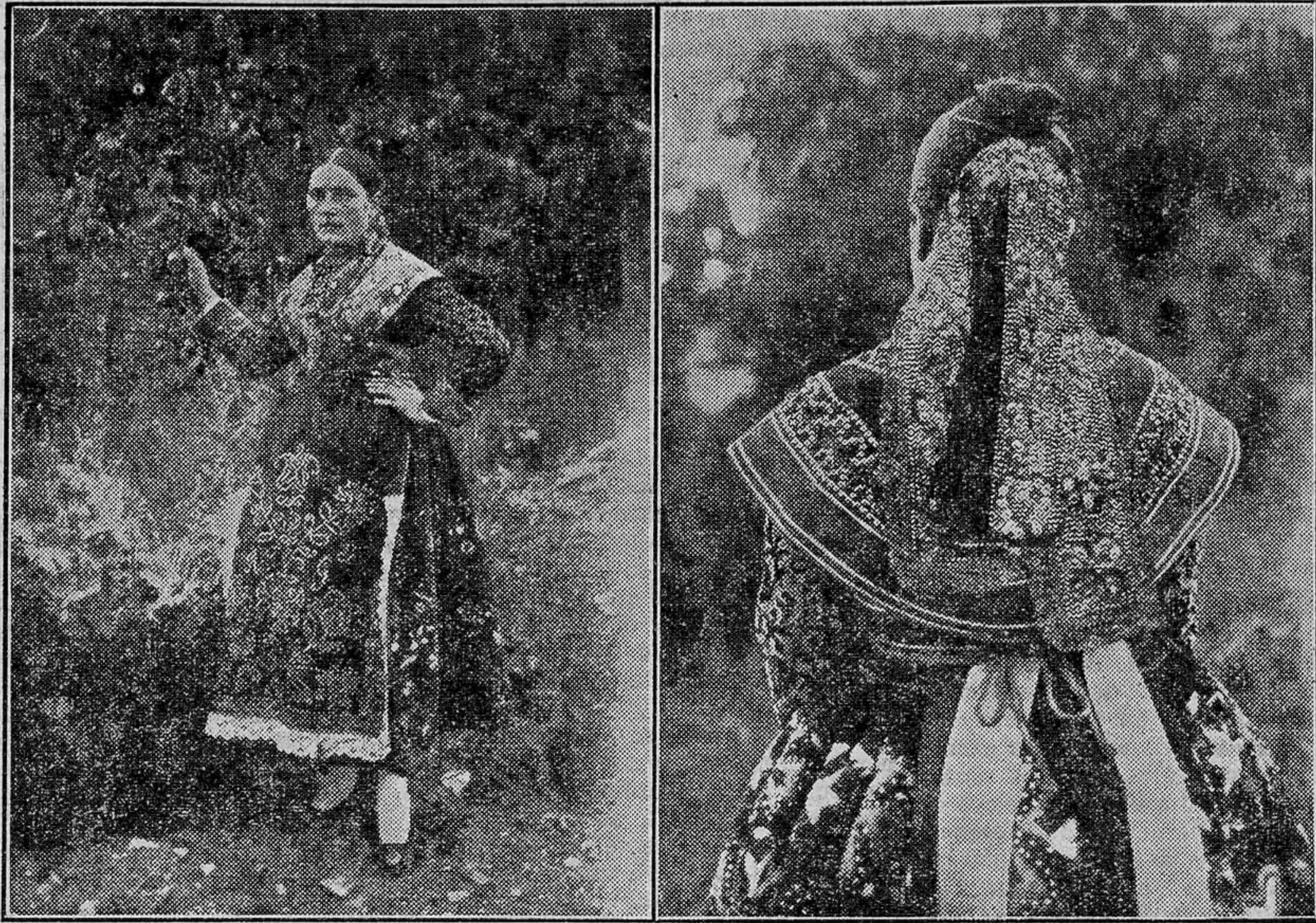
Trajes típicos y peinados de la provincia de Zamora

Desgraciadamente es poco probable que la Conferencia de Lausana, convocada para dar solución al problema de las reparaciones tenga resultado práctico y que la Conferencia del Desarme logre aminorar las cargas improductivas de los países y la tensión política que existe entre ellos. La cuestión de los Estados danubianos no ha progresado y Austria sólo dispone ya de reservas oro