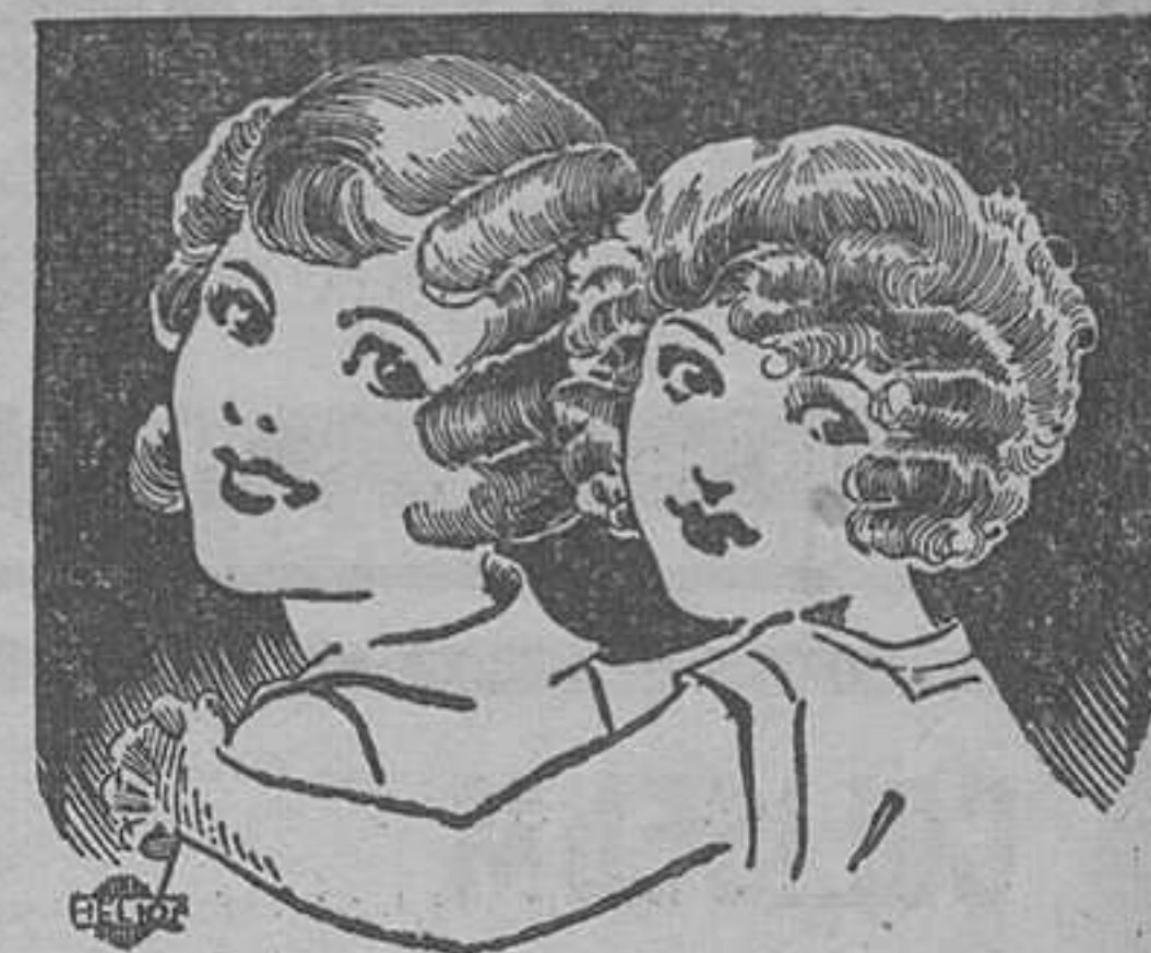
Peinados para niños

Muchas mamás quieren peinar primorosamente a sus niños y se quejan de la vulgaridad de los peinados conocidos. Para ellas dedicamos estos dos modelos preciosos de moda actual en Niza entre los pequeños elegantes de "la Rivière".