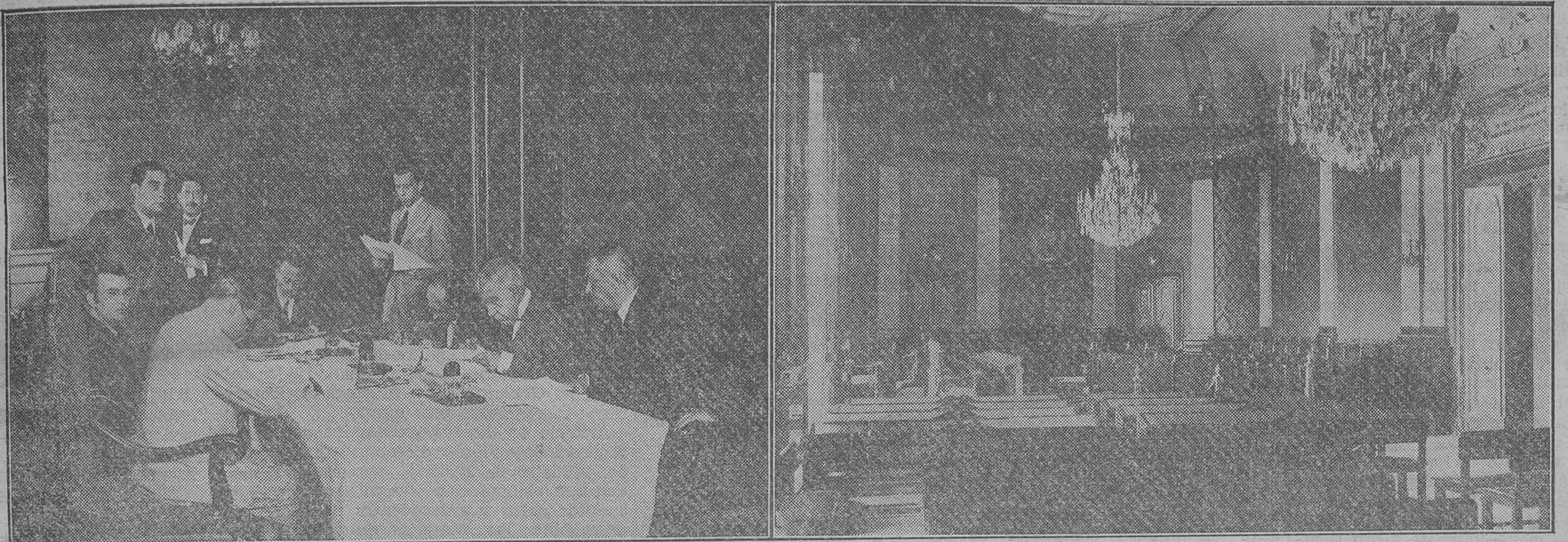
Los defensores de los procesados, reunidos en el salón de Penillo, estudiando el sumario.—La Sala del Tribunal Supremo, en la que se celebró la vista de la causa, en proceso sumarísimo, contra el general Sanjurjo y demás militares complicados en la reciente rebelión de Sevilla.

A las dos y media de la tarde terminó la vista, después de brillantes informes de los defensores