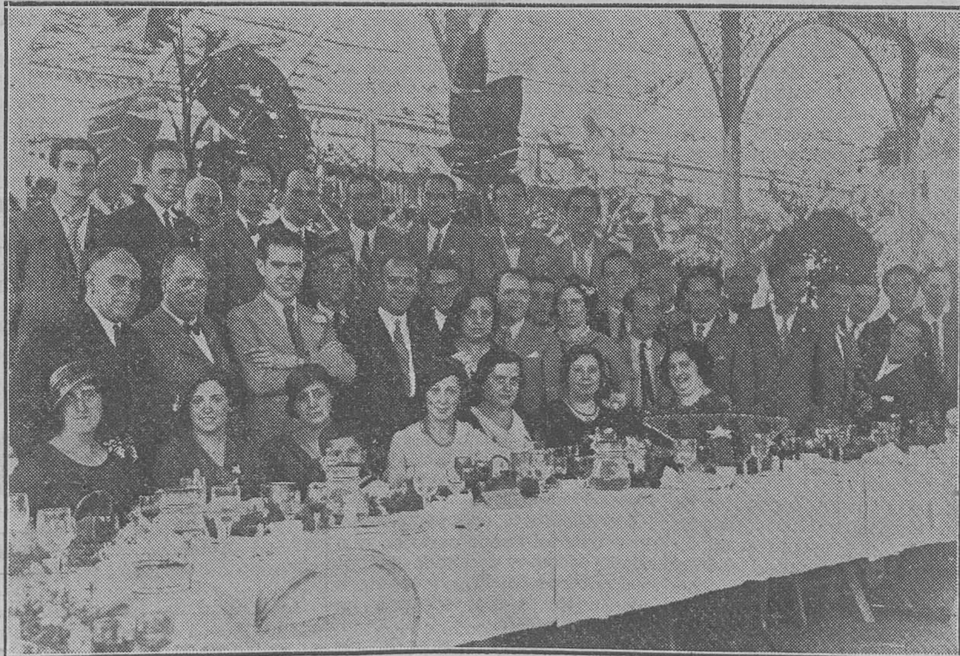
Comida organizada por el Centro de "Actuació Valencianista", con motivo del éxito alcanzado por dicha entidad en la Semana Cultural celebrada durante la pasada Feria

Esto, que es una realidad que ven los ciegos es lo que no ve la luz republicana de "Luz" y de quienes con ella creen en inminentes cambios de política por las buenas vías de la armonía entre todos los partidos del régimen. No ven que a situación y gentes como las actuales no pueden aplicarse las pautas normales que en todo sistema parlamentario y democrático han servido siempre de criterio sector. No ven que la oligarquía socialista se ven que la oligarquía socialista se ha enseñoreado de la situación y no se muestra propicia a compar-