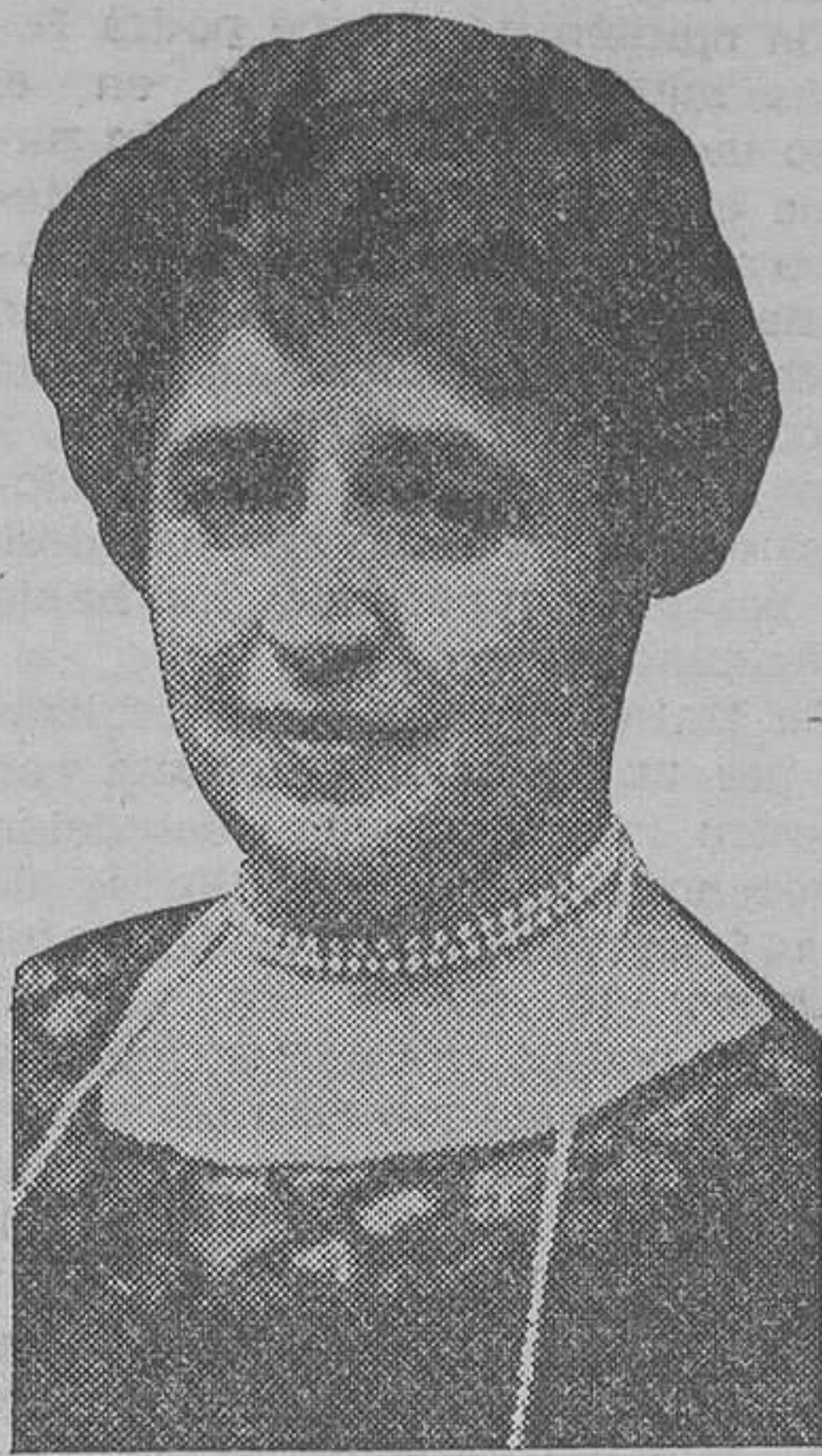
La señora duquesa de Fernán Núñez, que ha fallecido estos días

ción si las presentes negociaciones encaminadas a la regeneración de Liberia fueran suspendidas." Y para calmar esta misericordiosa inquietud, se ha señalado como plazo máximo el mes actual para poner a Liberia en régimen de protectorado yanqui.