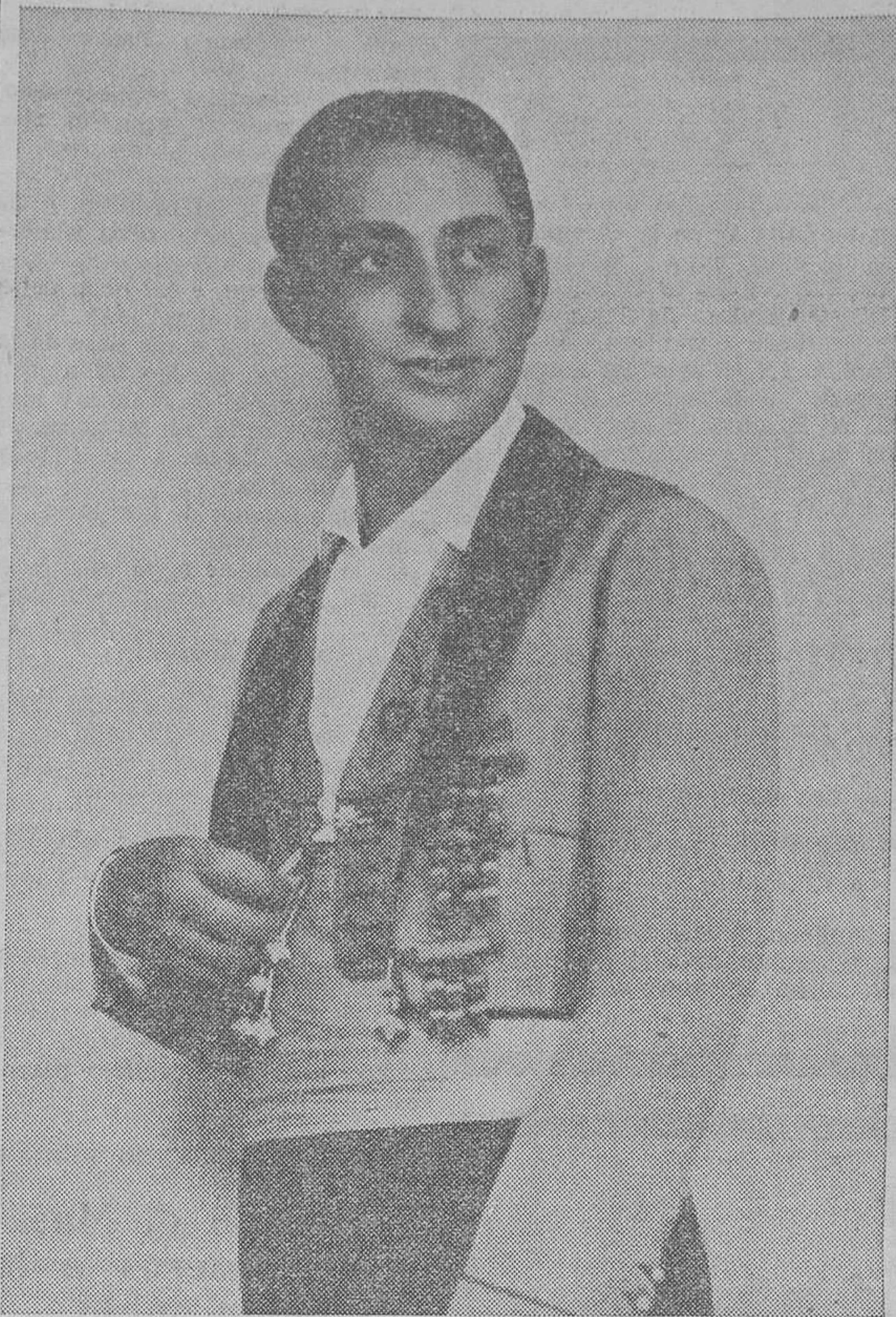
El eminente divo Marcos Redondo, que actúa esta noche en nuestra plaza de Toros