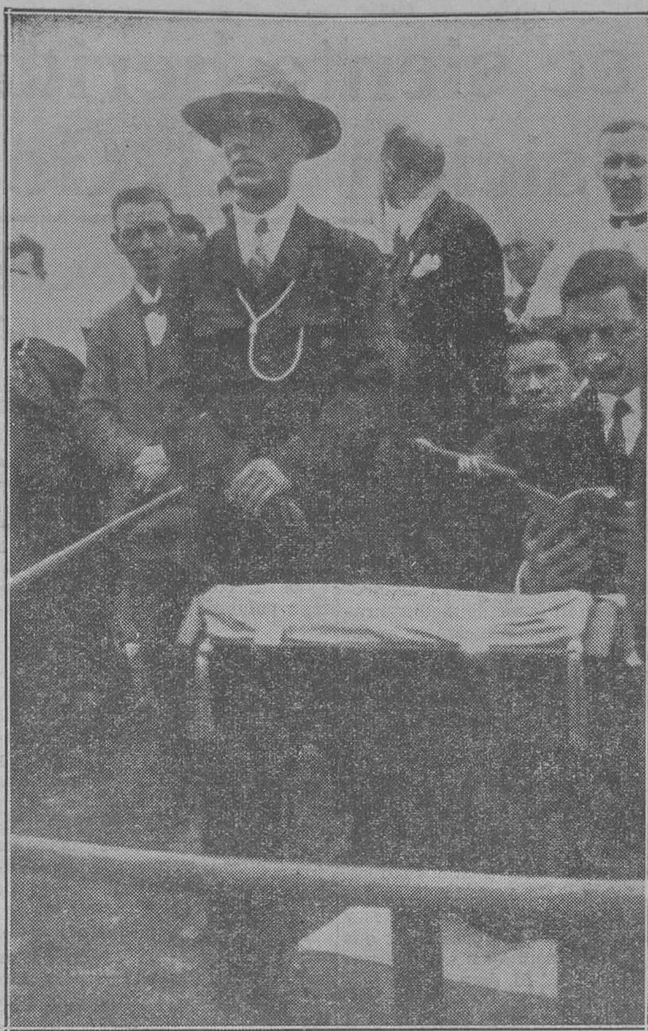
El presidente De Valera (extremo derecha) orando ante el altar durante la misa Pontifical en Phoenix Park