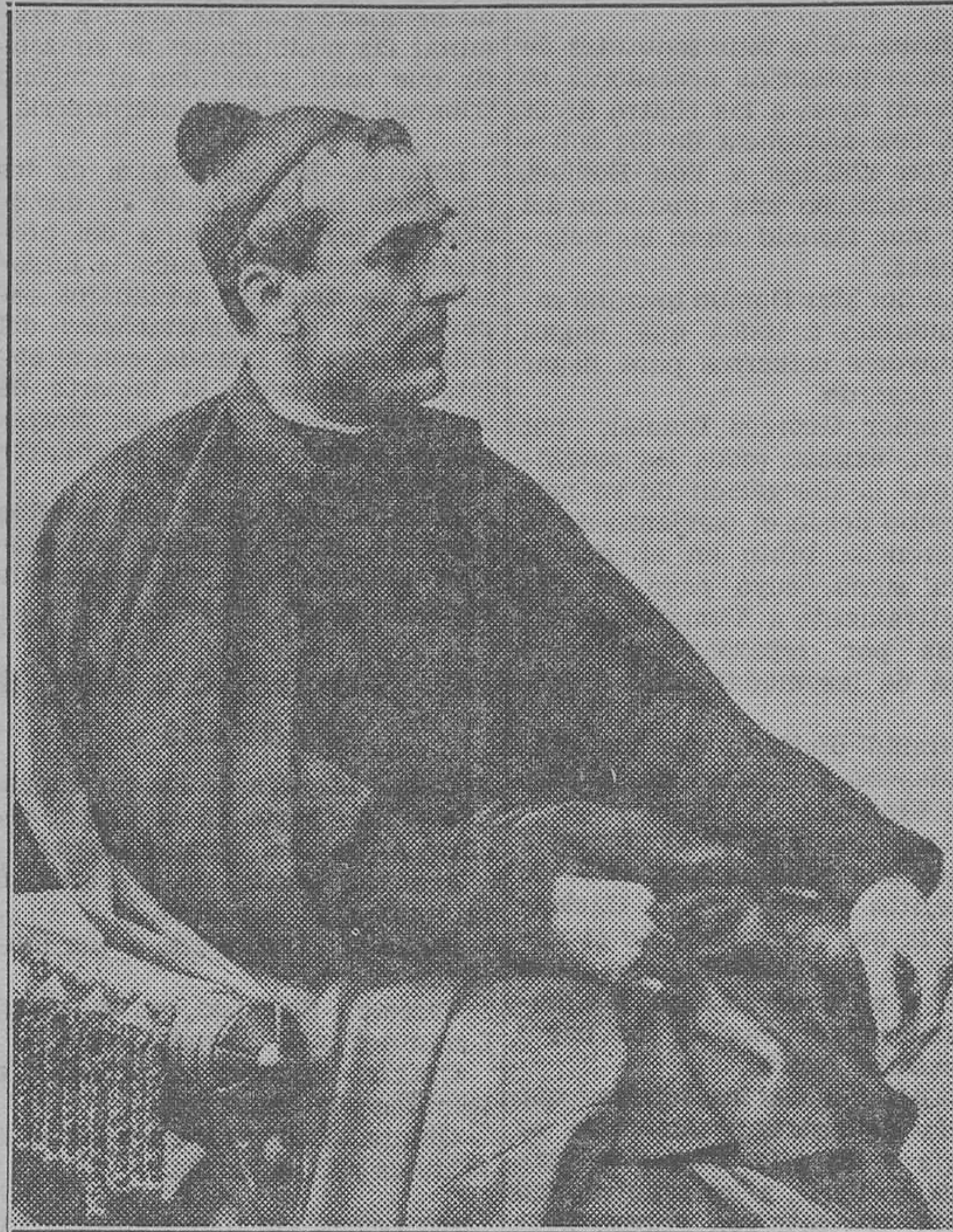
Mosén Jacinto Verdaguer

magnitud, vigor y ciencia tanta. Vense aquí esparcidas, organizadas y redivivas, con extraordinaria similitud, las tradiciones más antiguas y venerandas de la tierra catalana, y la imaginación, aunada con la ciencia, embellecen prodigiosamente vuestras soberbias descripciones. ¡Oh, insigne cantor! habéis cumplido con