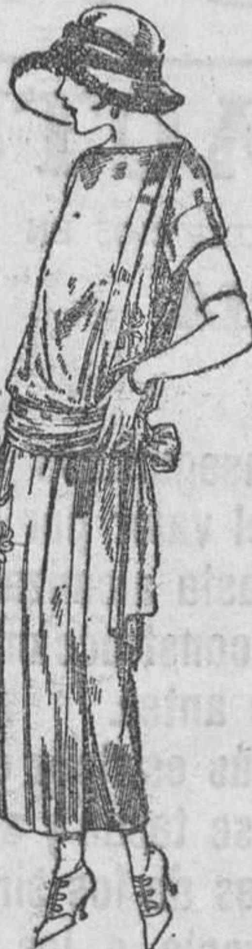
Vestidos de tricót de seda, negro, azul y colores moda, adornos bordados a mano. A ptas. 125