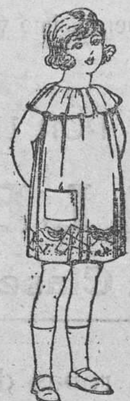
Delantales de etamín, colores moda, adornos bordados, para niñas de 4 a 6 años. De ptas. 850 a 950

Ropas confeccionadas para caballero, señora, niño y niña