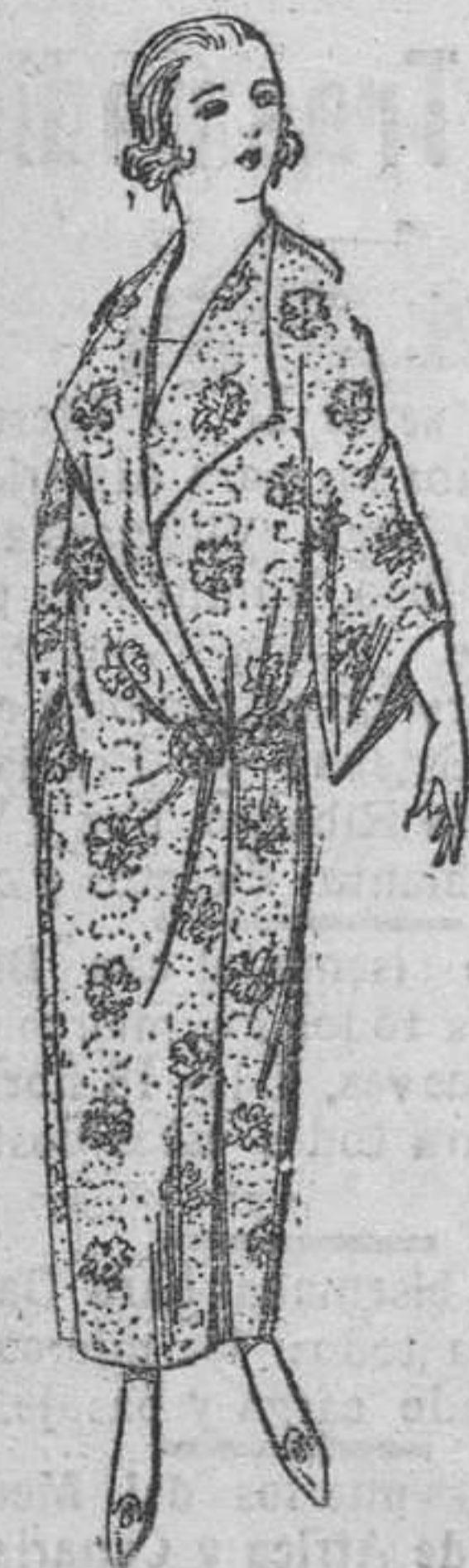
Batas de crepón estampado, broche de adorno. A ptas. 25