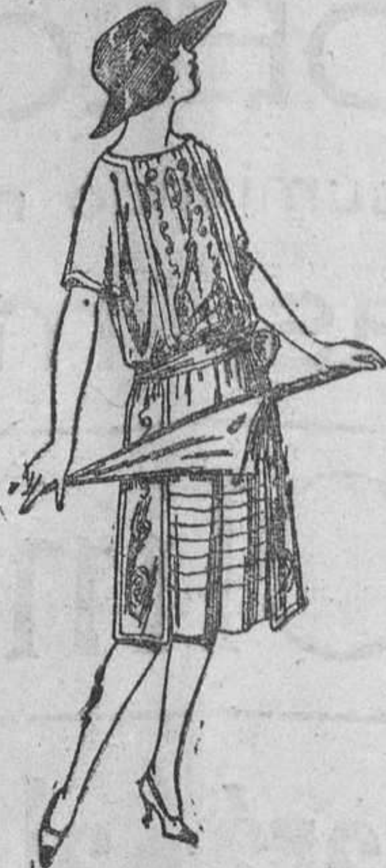
Vestidos de voile, adornos bordados, para jovencitas de 13 a 15 años. A ptas. 40.