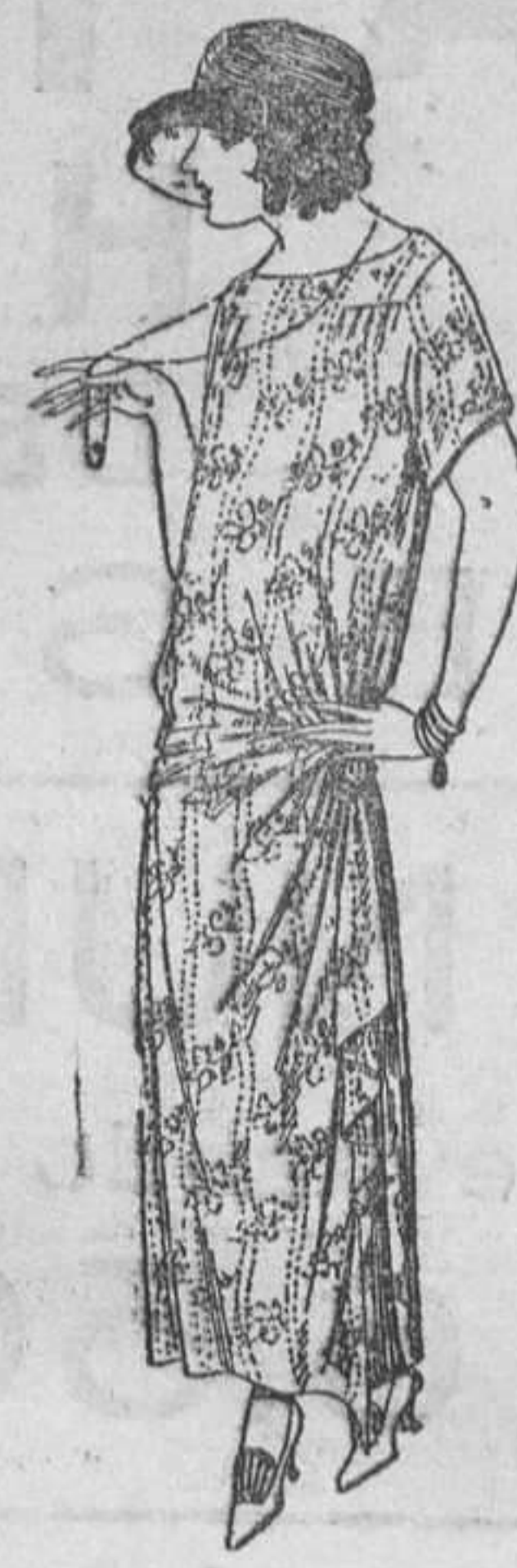
Vestidos de voile, dibujos moda, adornos plizados, broche fantasía. A ptas. 62