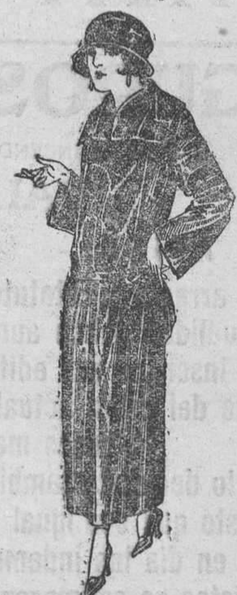
Abrigos de gabardina inglesa impermeabilizada, en negro, azul y color. A ptas. 130