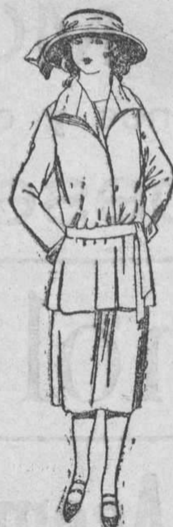
Trajes sastré, de gabardina, sarga inglesa, etc., en azul y color, para jovencitas de 13 a 15 años. A ptas. 75