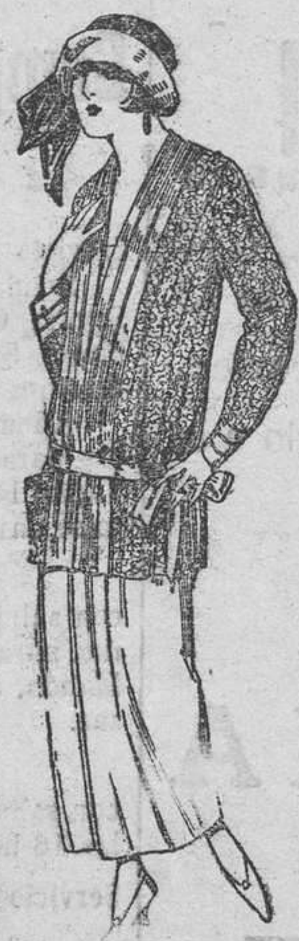
Paletots de punto de seda, dibujos novedad. A ptas. 90