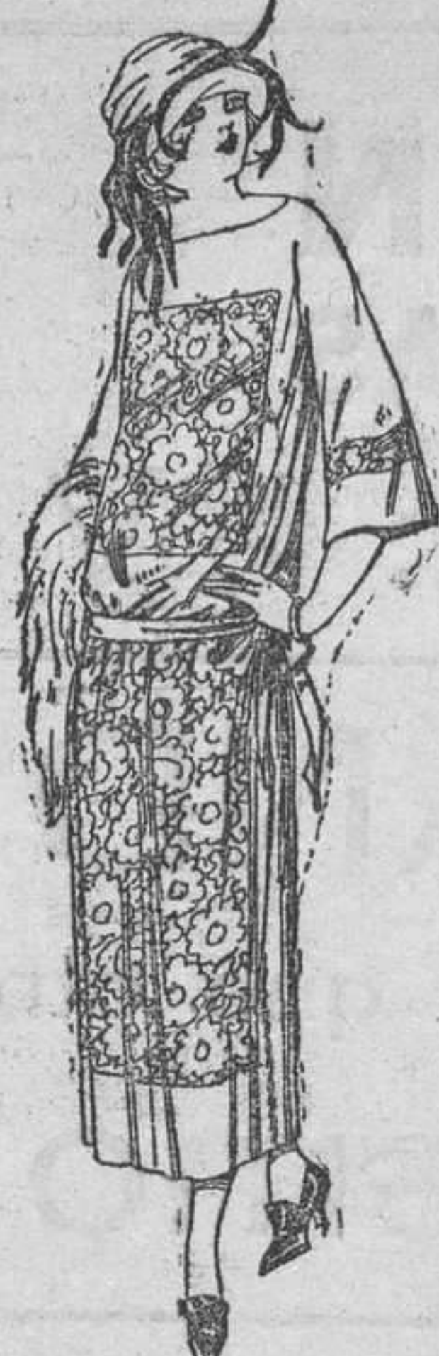
Vestidos de popeline, crepón, etc., en negro, azul y color, adornos bordados. A ptas. 130