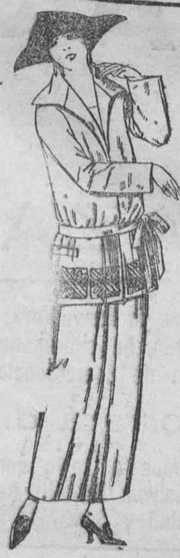
Trajes sastré, de gabardina, sarga inglesa, etc., adornos bordados, en negro, azul y colores moda. A ptas. 115