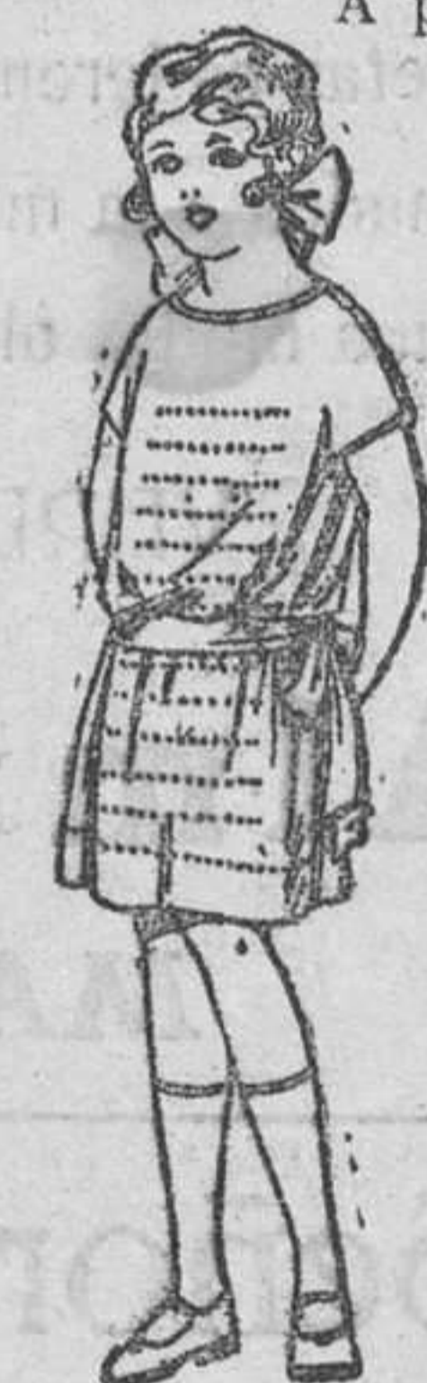
Vestidos voile, adornos bordados, para niñas de 4 a 9 años. De ptas. 15 a 18

Boás, camisería, géneros de punto, corbatería, guantería, sombrerería, zapatería, paraguas, bastones, sombrillas y artículos de viaje