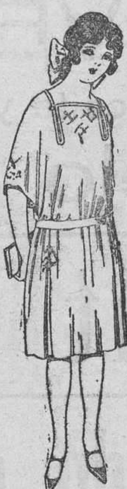
Vestidos de popeline, estambre, etc., en azul y colores moda, adornos bordados, para jovencitas de 13 a 15 años. A ptas. 60