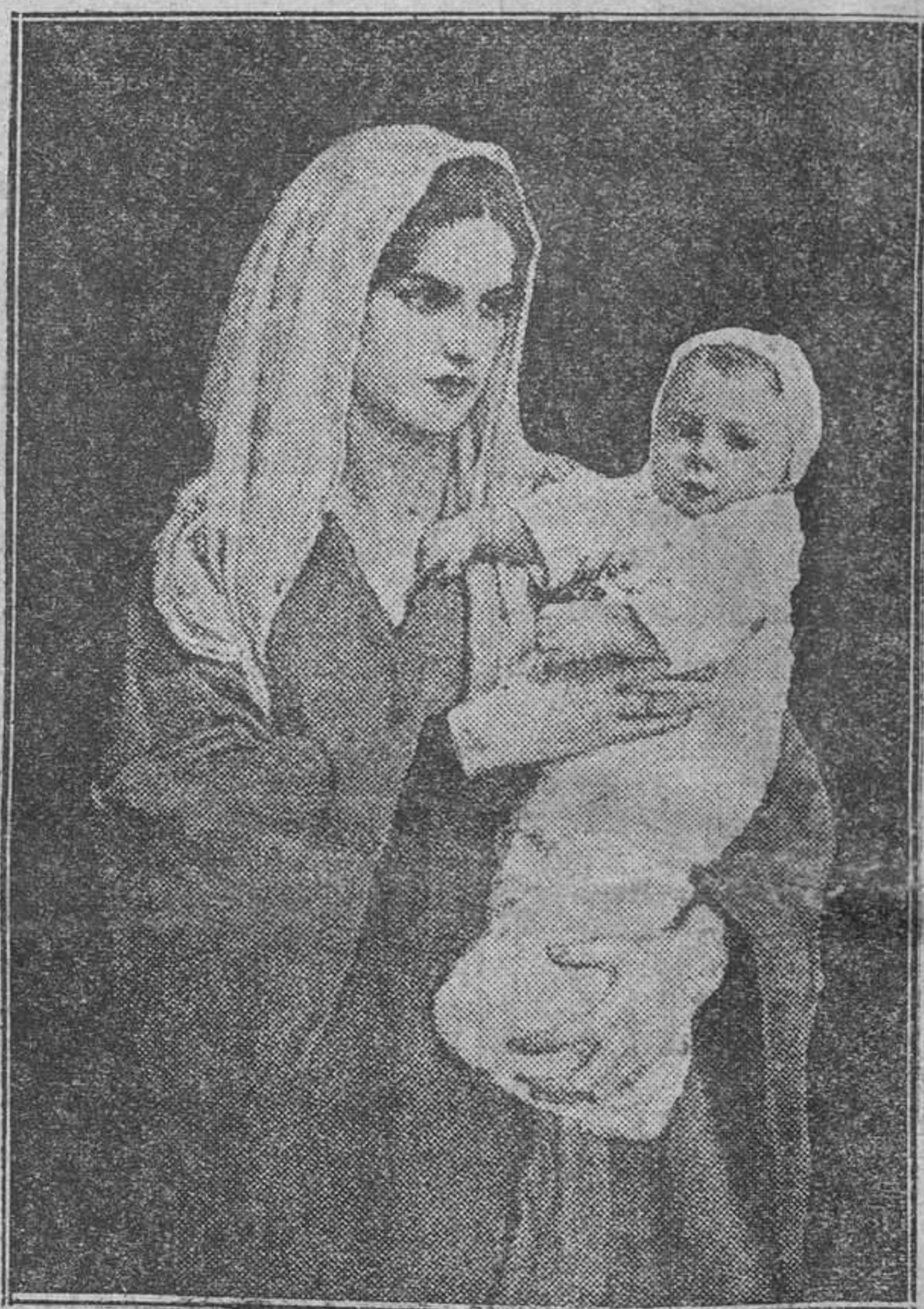
¡MADRE!— lienzo de G. Szoldatics.—(Museo de Roma)

en España, debido a la escasa asistencia de que se les rodea en los primeros días de su existencia, lo que hace una cifra global de 190.000 niños por año, ¡la mayor mortalidad infantil de Europa! Se habla mucho en los tiempos que corremos de fraternidad y de