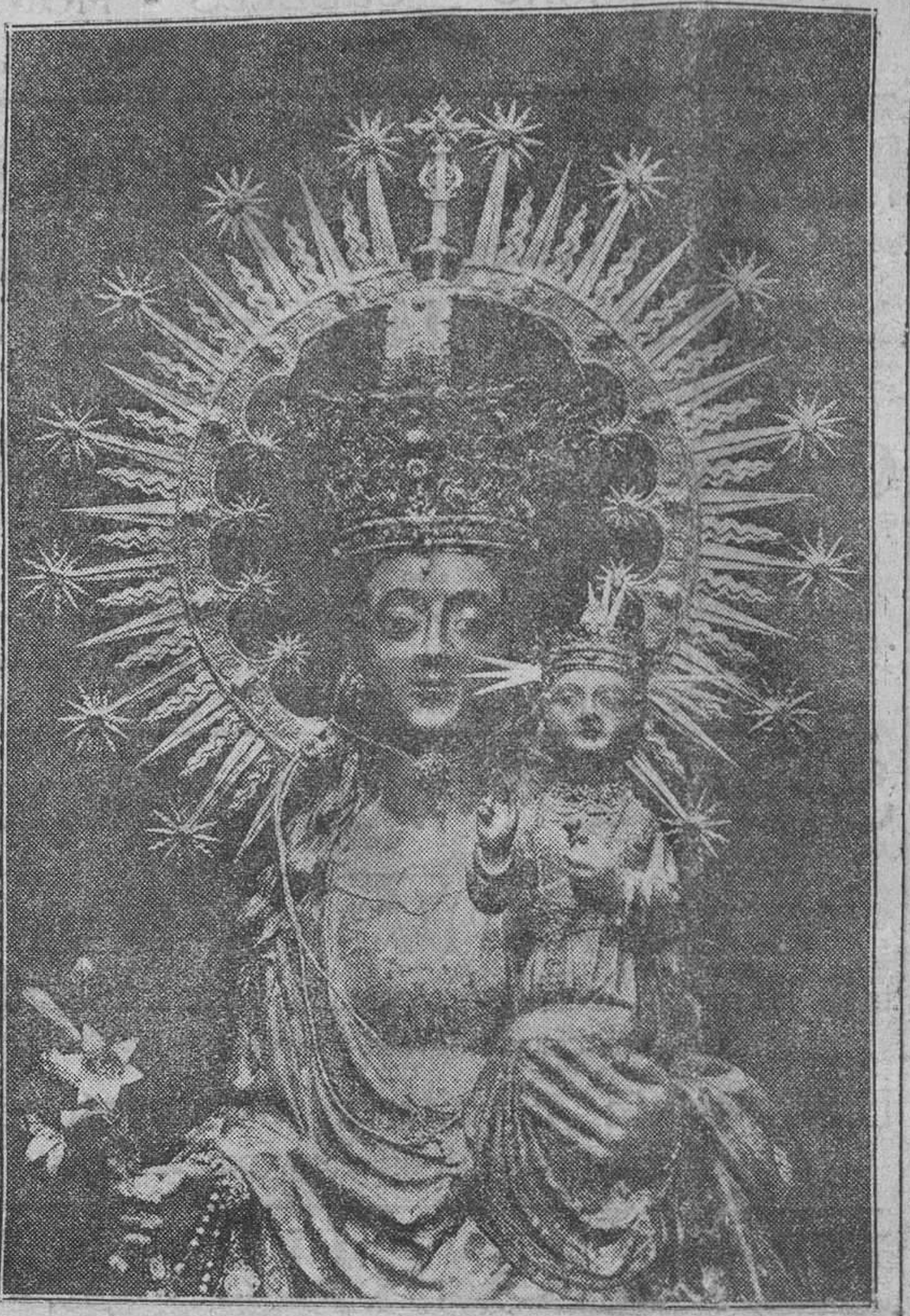
Busto de la Patrona de Játiva, adornada con valiosa corona, fabricada en el siglo XVI con metales preciosos y rica pedrería; mide un metro de diámetro. Este año, con motivo de su declaración canónica del Patronato, será paseada procesionalmente por la ciudad el día 5 de Agosto en su fiesta principal.