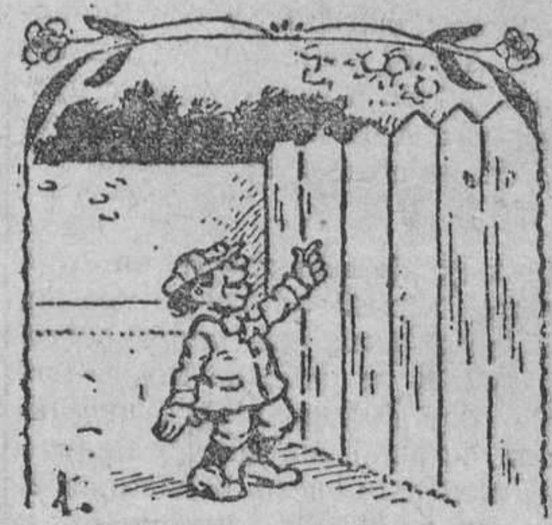
1. Nemesio, pasando un día por junto a las tapias de un huerto, descubrió un peral, cargado de hermosas peras, que le tentó.