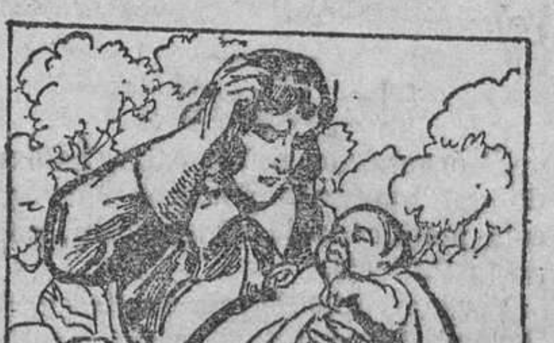
18. a los dos bribones. Pero enseguida una inquietud le vino a torturar. Ciertamente había castigado a los dos ladrones, pero, ¿a quién devolver el niño, si no sabía de quién era?