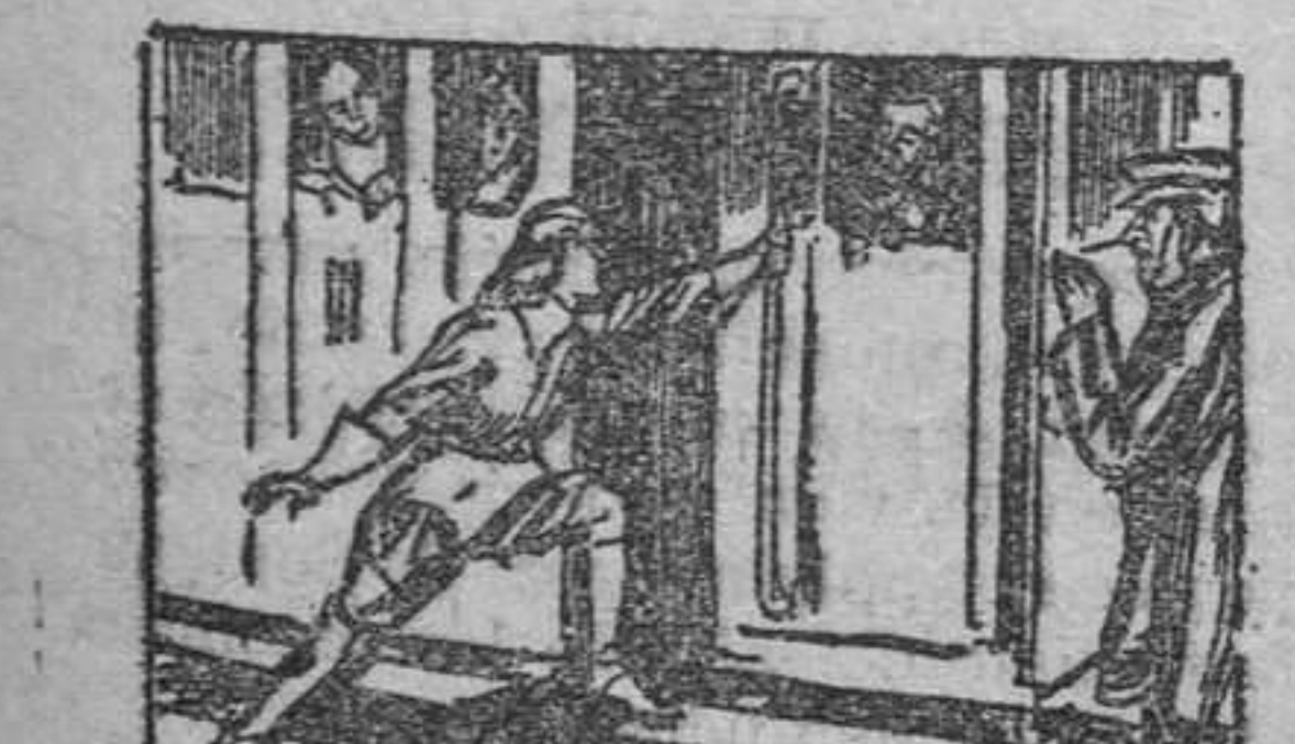
20. la clave de todo... Oswaldo se despertó; había estado soñando, pero recordando a su sueño y la figura venerable de su protector, tuvo un rápido de inspiración, y abandonando a los comedantes, tomó el tren.