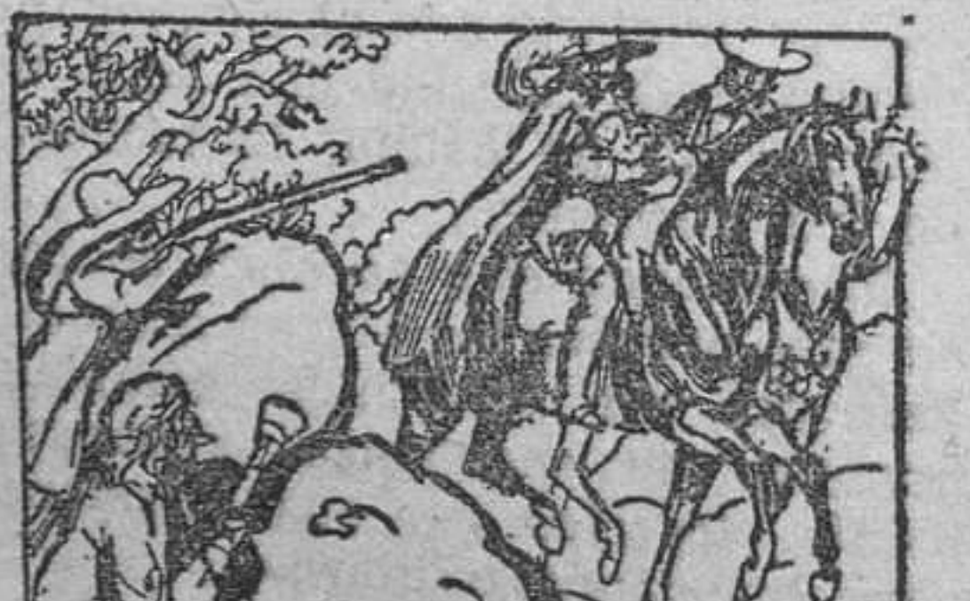
16. niño que, así como las vestiduras que ostentaban, habíalos roado a dos verdaderos caballeros, que marchaban confiados a llevar a su madre a aquel angelito. Como la presa era buena.