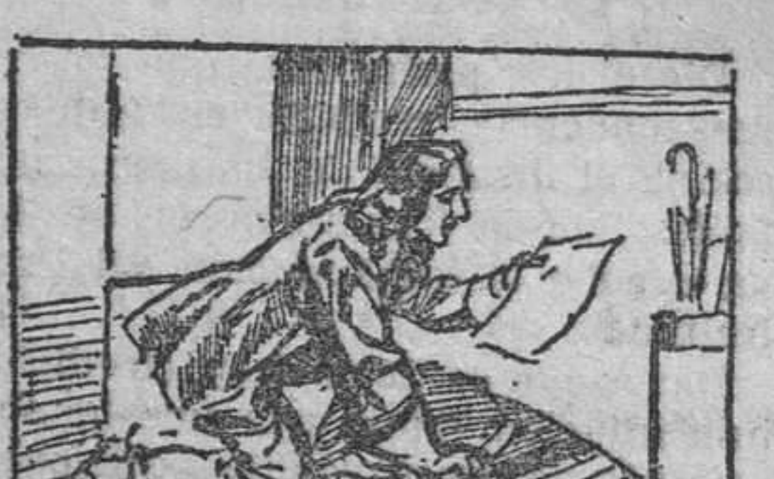
21. volviendo a casa de aquel; y siguiendo las instrucciones, unas instrucciones que nunca hasta entonces viera claras, halló escondido entre las tablas del parquet del despacho el testamento del doctor.