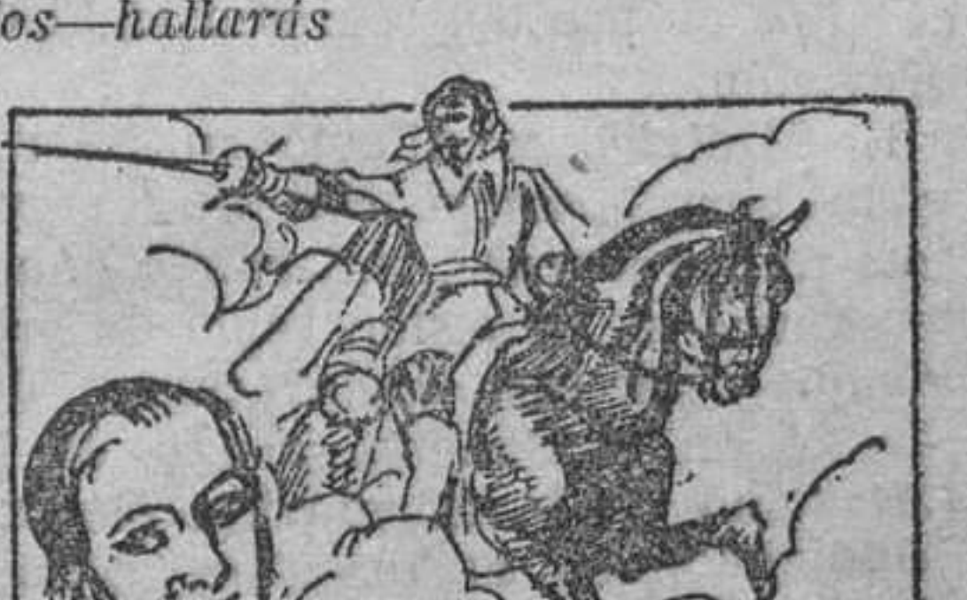
24. por aquella honrada familia de labradores. Y así es como Oswaldo, gracias a su afán de estudio, a su amorosa obediencia y a su sueño feliz, llegó a ser el héroe de sí mismo, el último mosquetero del Rey.