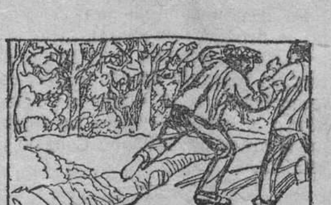
23. había sido robado por unos bohemios, los que un día, porque el pequeño no les reportaba el beneficio que ellos pensaban obtener de su robo, le abandonaron en el camino, siendo recogido