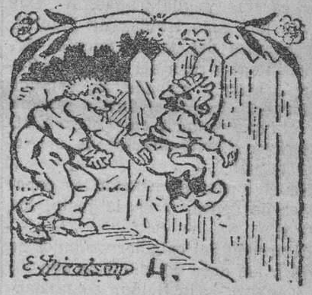
4. A que aquel le viera un mercedo vapuleo, que por las trazas le quitó para siempre el deseo de comer fruta del cercano ajeno.