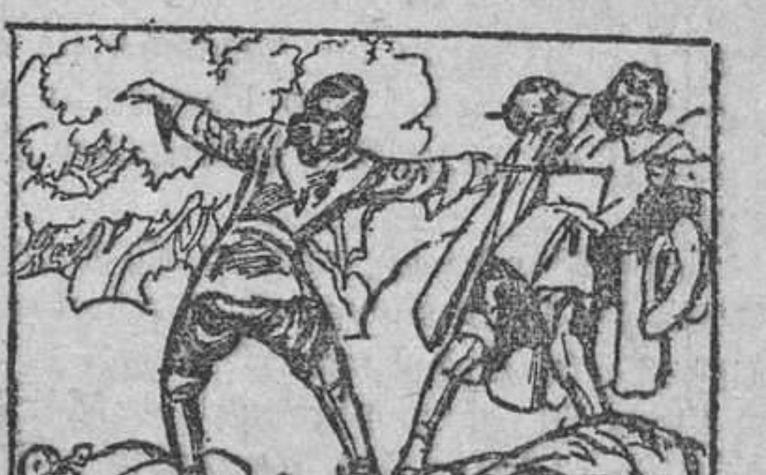
17. nos hemos apoderado de ella, y... tú puedes servirnos de intermediario en el rescate. Oswaldo no les dejó seguir; rápido como el pensamiento, desenvainó la espada y tumbó