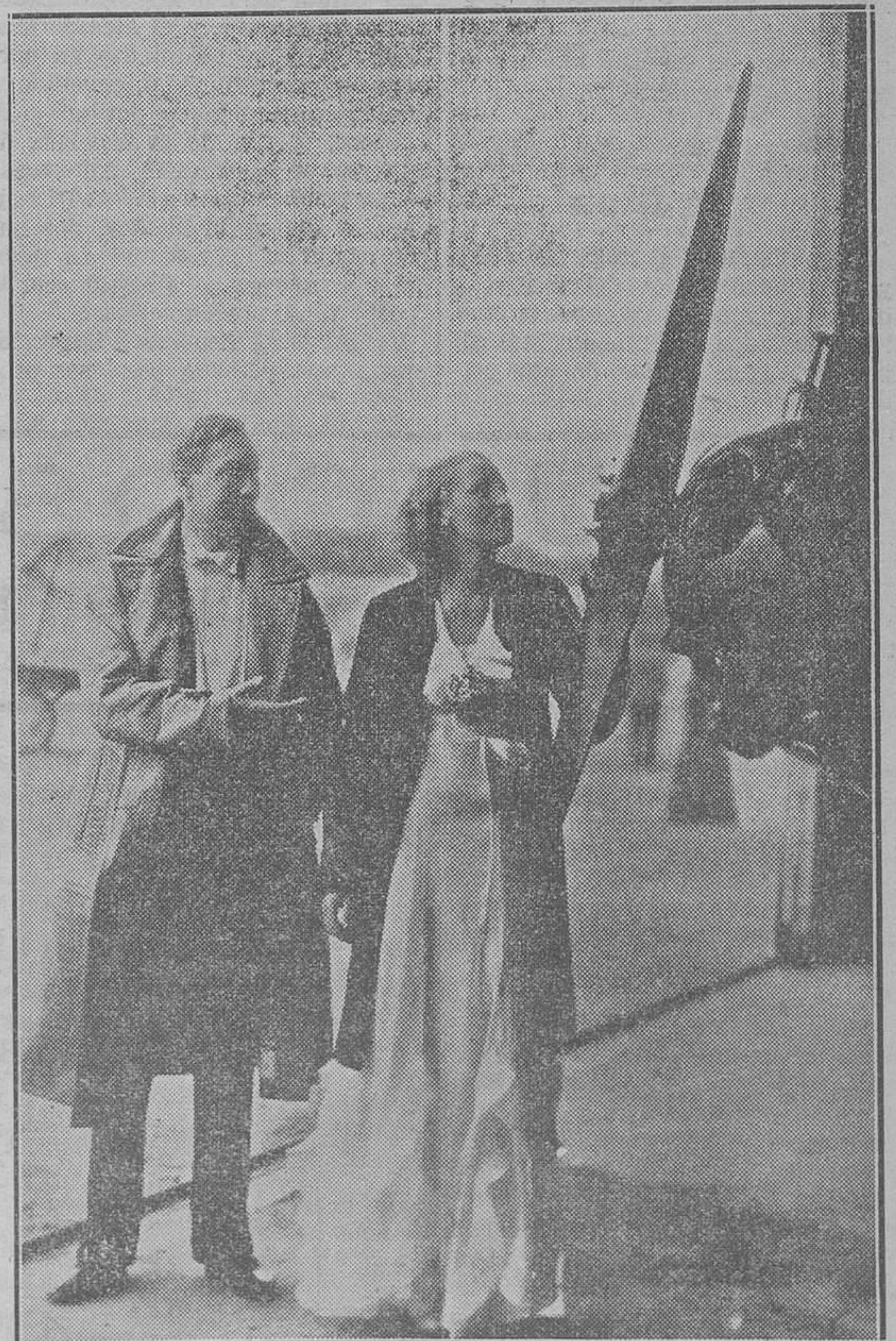
Brigitte Helm, hermosísima estrella del cine europeo que tiene en este film tan interesante, una de sus más triunfales actuaciones