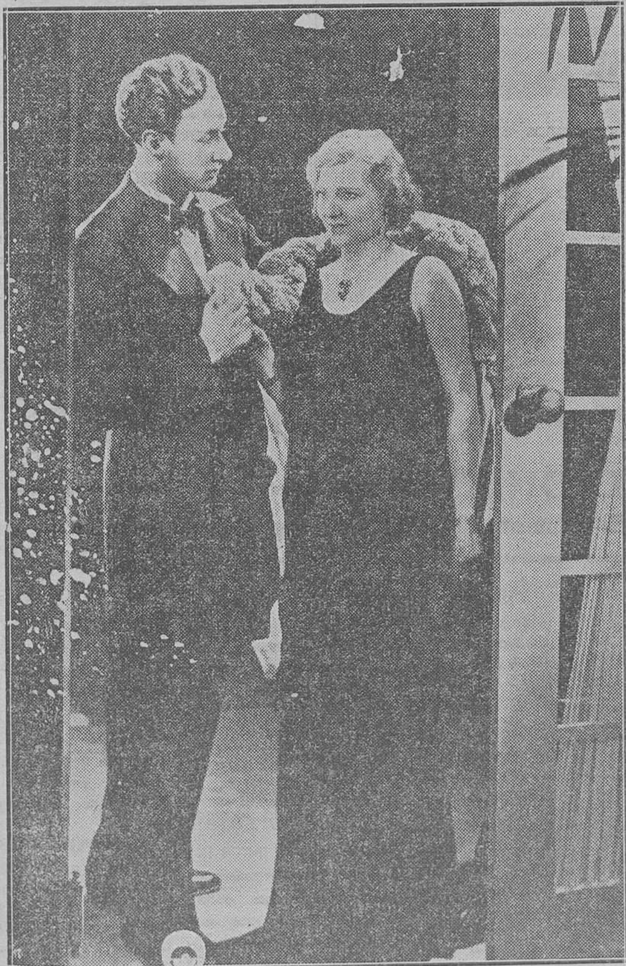
La próxima semana va a estrenarse en el Lírico un drama del más alto interés social, realizado bajo los auspicios de la Sociedad de Naciones y declarado de utilidad pública. Como expresan muy bien los anuncios, se trata de un film de tesis que hace reflexionar honda y honradamente

El trabajo del estudio no me permite estar al lado de mi hijo a todas horas, pero no por eso dejaré de ser para él tan buena madre como pudiera serlo cualquier otra que “dedicara” todo su tiempo al hogar.