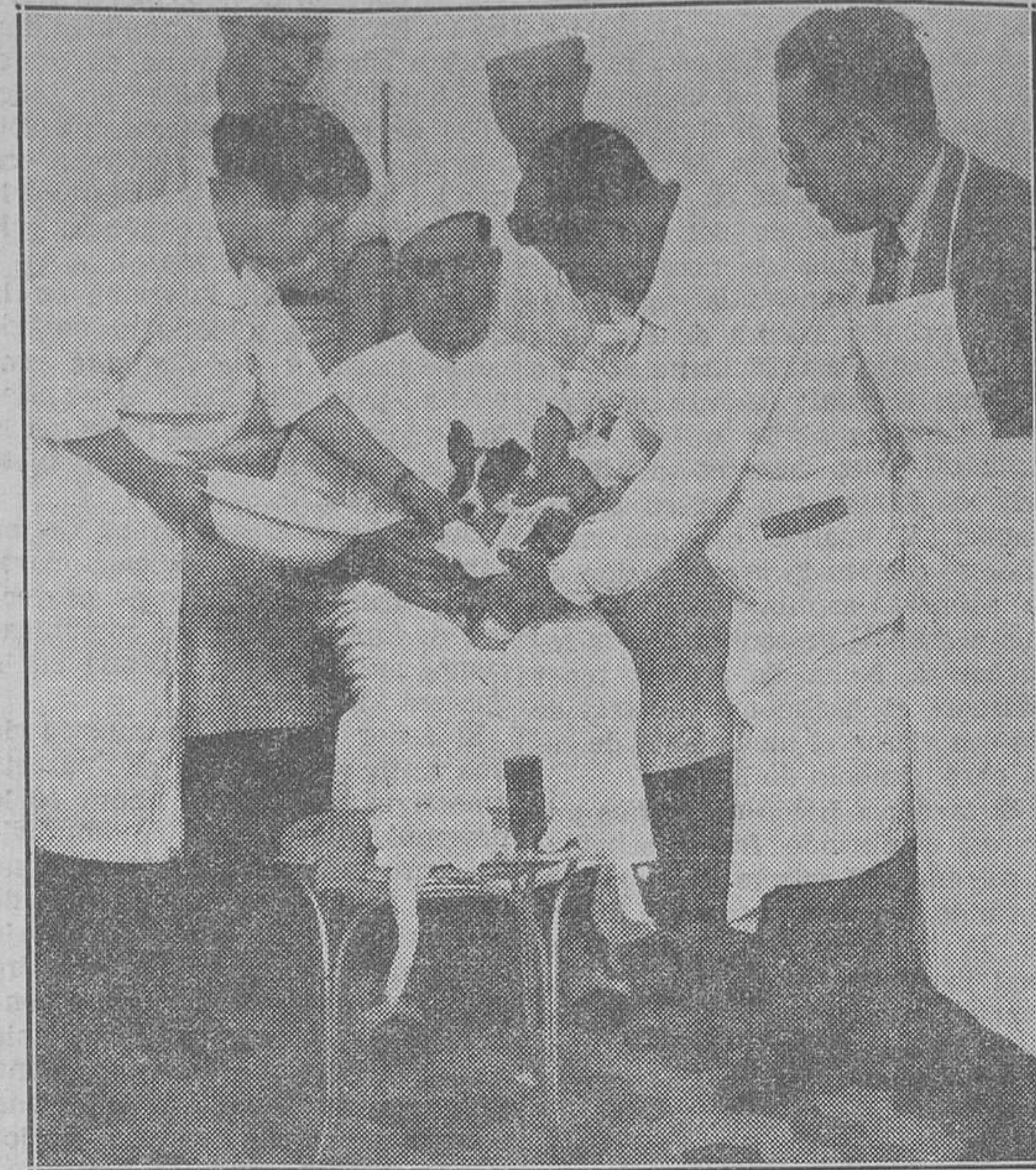
El personal del benéfico establecimiento, atiende al lisiado animalo ejemplar notable de excepcional instinto, hecho del que ayer dimos cuenta

Para un espectador imparcial, el hecho no puede tener una interpretación concreta auténtica. Se han significado el señor Lerroux y su partido como la representación de la más dura oposición al Gobierno y como la encarnación de la teoría de la necesidad de que los socialistas abandonen rápidamente el Poder. Cuando haya unas nuevas elecciones, los términos del problema estarán situados así: los que patrocinan la continuación de los socialistas y simpatizan con la política izquierdista del Gobierno, votarán contra Lerroux; los que son partidarios de la salida de los socialistas y de un cambio de orientación en la política que hasta ahora se ha seguido, votarán