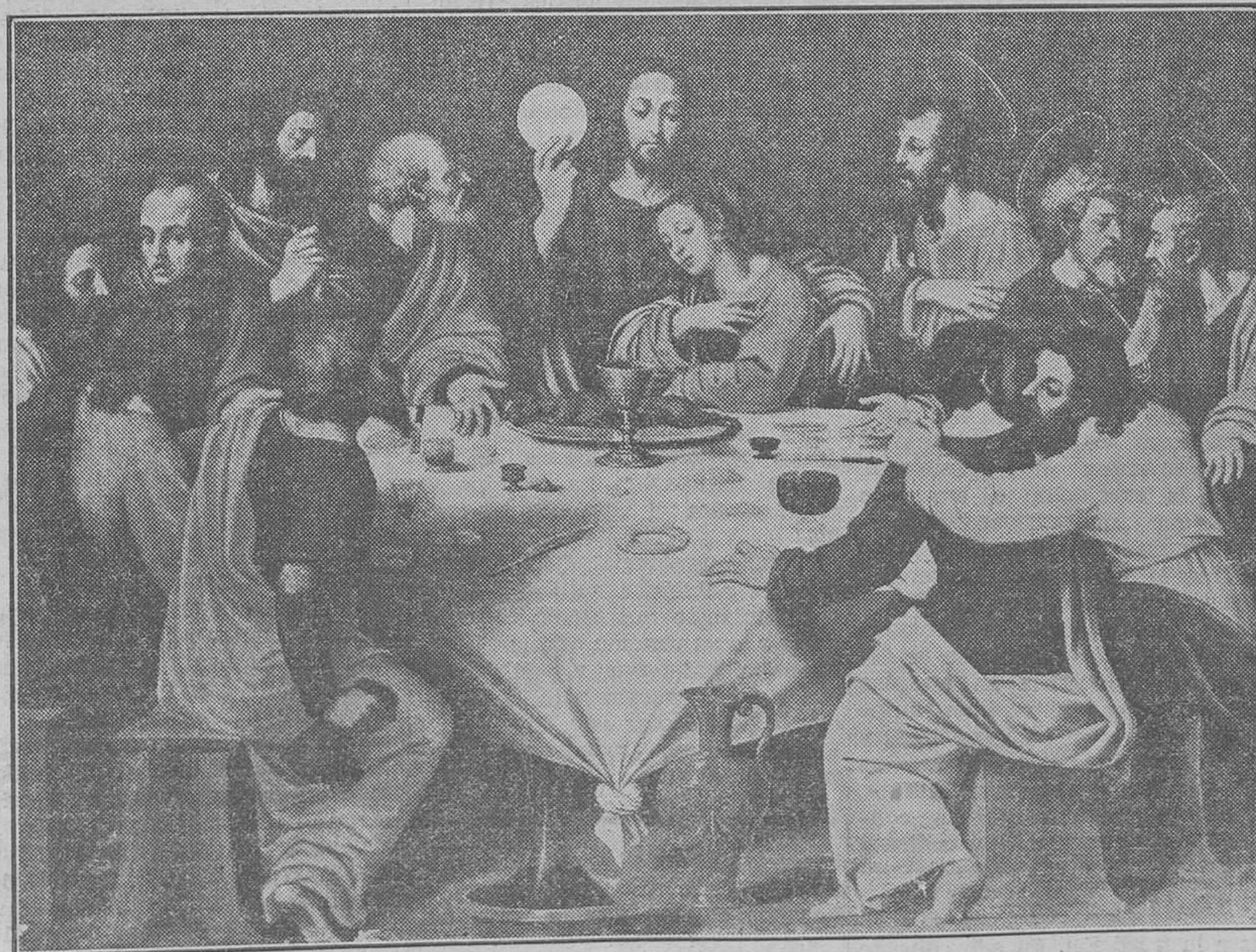
Cuadro de Joanes, venerado en la iglesia parroquial de San Nicolás, de Valencia.

No somos pesimistas, no podemos serlo. Sabemos que la voluntad del hombre no es omnipotente; tenemos absoluta fe en la inconsistencia de lo absurdo, así como en la victoria de la razón sobre los prejuicios, y creemos firmemente que la secular fiesta del Corpus volverá a ser lo que fué. No puede haber máximo progreso sin una máxima tolerancia; cuanto más vasta sea la cultura, cuanto mayores vuelos adquiera la inteligencia y menos límites se pongan al pensamiento, menor será la preocupación de las gentes por las ideas ajenas. Entonces será una insensatez, una pue-