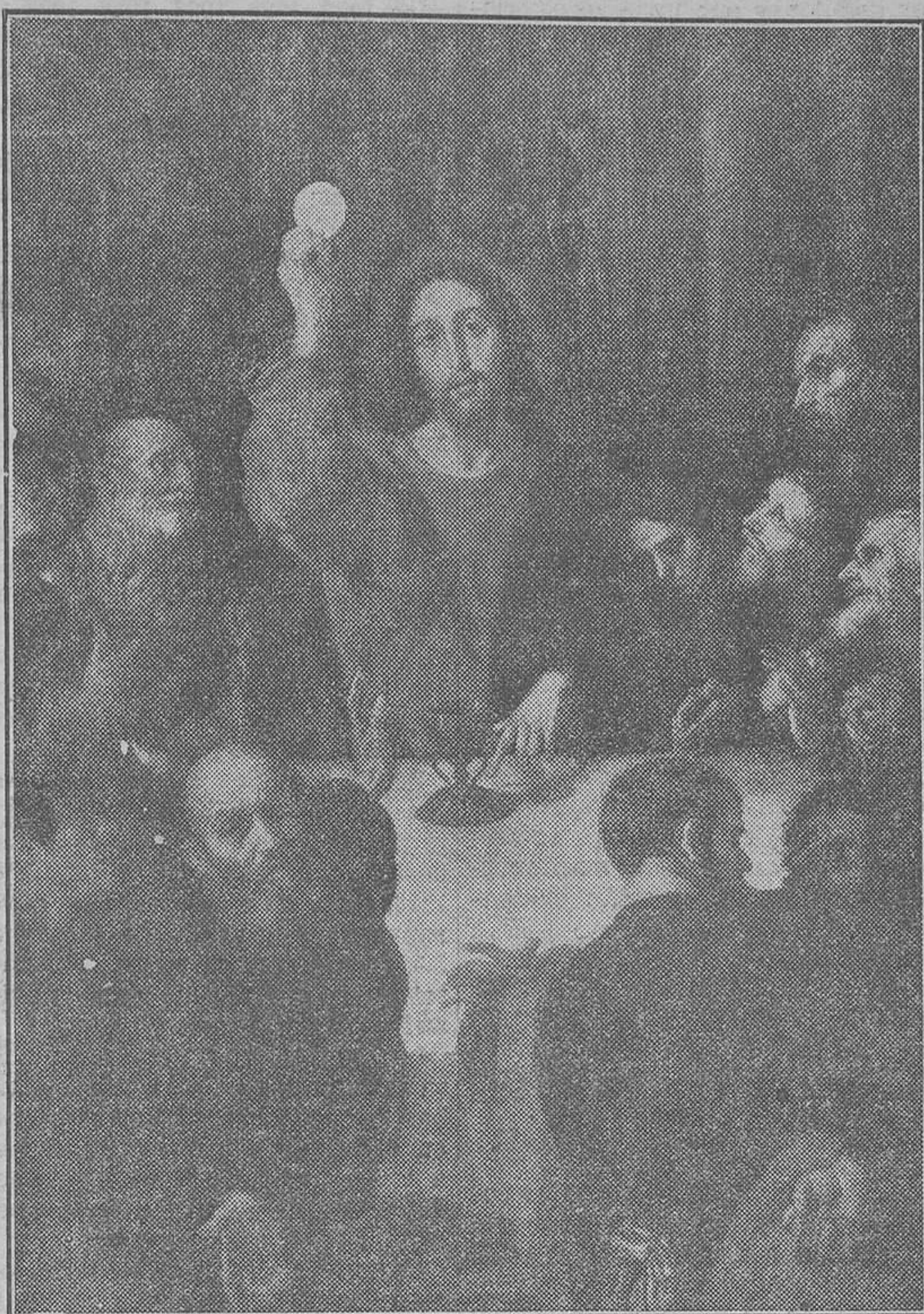
Cuadro de Ribalta, de nuestro Museo de Bellas Artes.

Esto es una verdad para todos, especialmente para los valencianos que por tradición, por contar con instituciones que con tanto celo han sabido extenderla y perpetuarla, por temperamento y por su innato sentido artístico, hicieron de la fiesta del Corpus una de las más espléndidas y sugerentes del mundo católico. No sería difícil reconstituir la historia política, docente y social de nuestra ciudad, a través de su fiesta del Corpus; tal fué siempre la identificación de todos los sectores sociales con la pública adoración de la divina presencia, que desde el siglo XIV has-