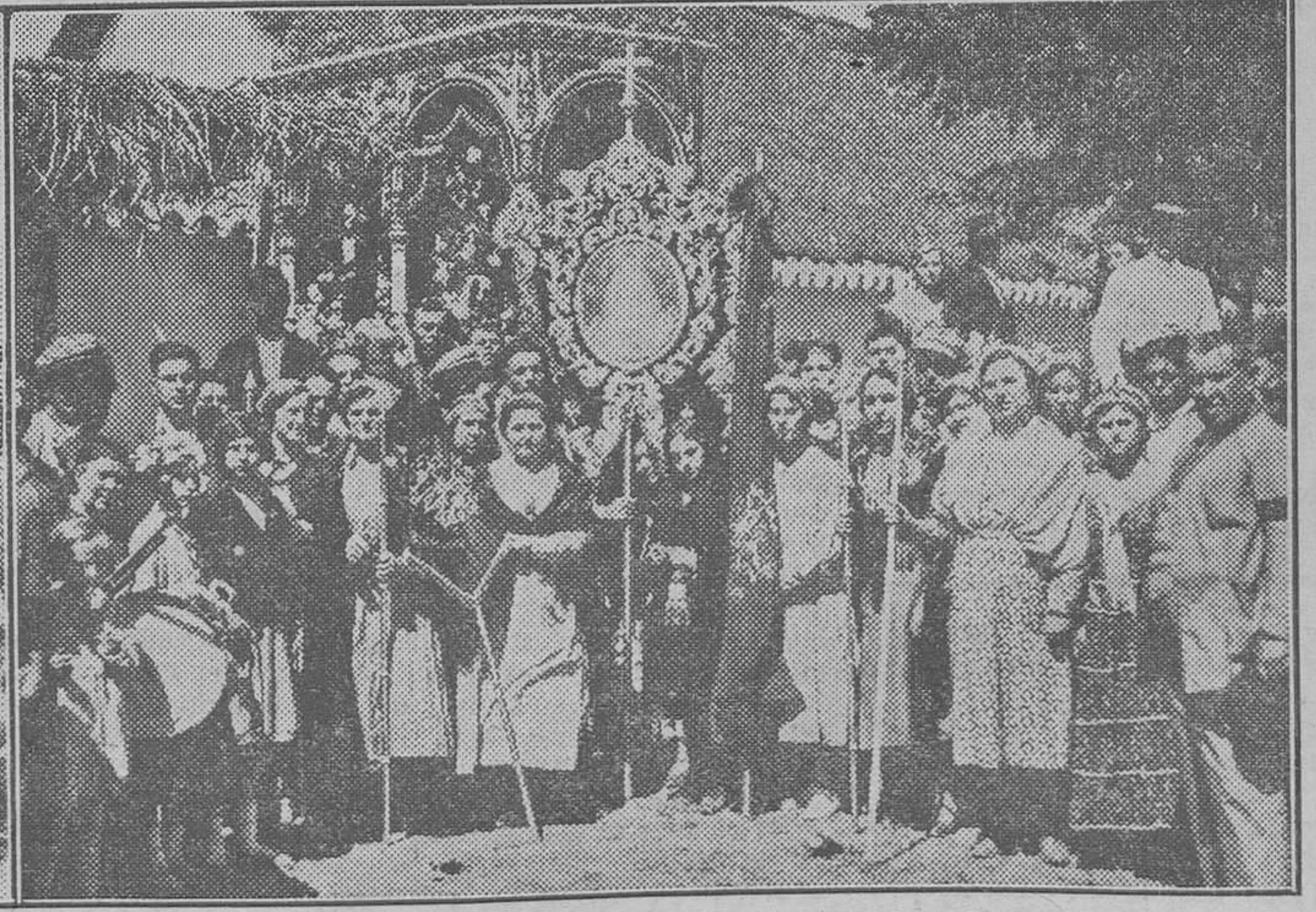
LA ROMERIA DEL ROCIO.—Detalle de la procecion. El cura de la Hermandad de Huelva, rezando una Salve, entre el entusiasmo de los romeros.—La Hermandad de Villamanrique, saliendo de la ermita, después de la misa.