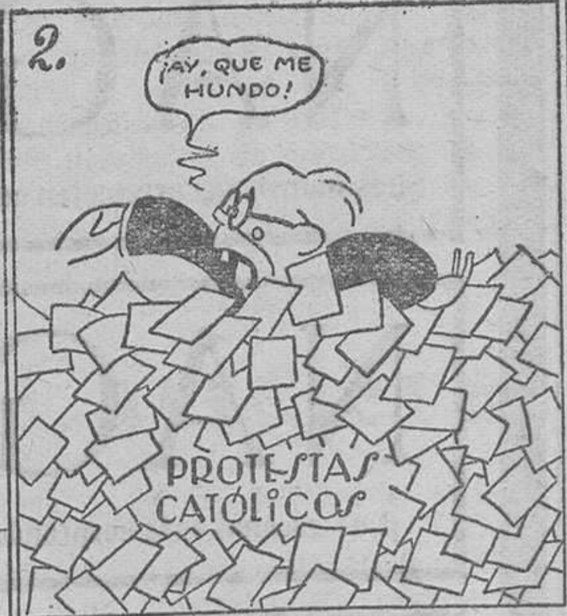
Va a terminar muy re-mal, este feroz temporal.