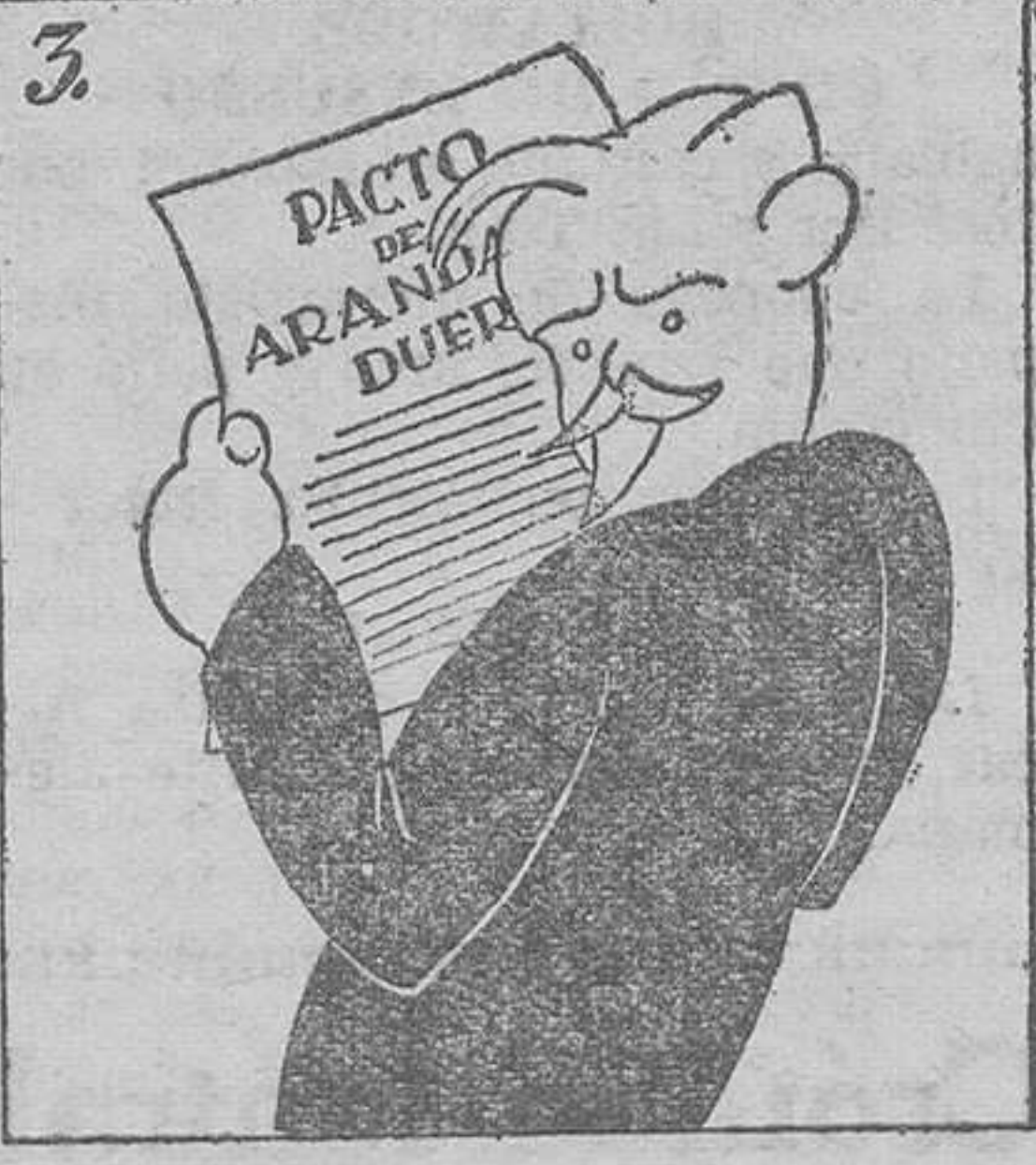
Unión derechista, en el acto, antes y después del pacto.