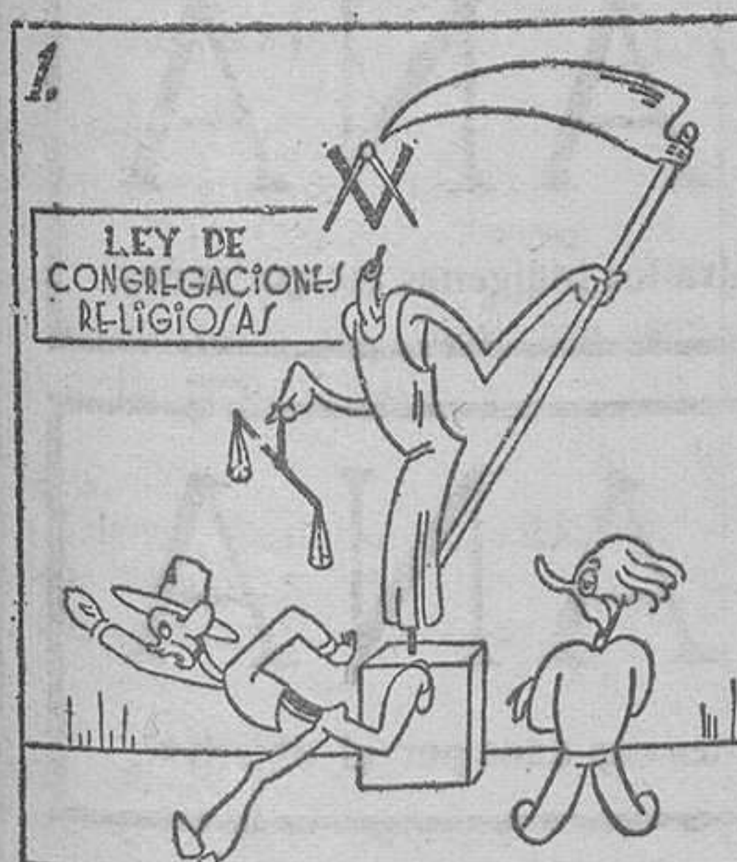
Escultura de una pieza. (No tiene pies ni cabeza.)