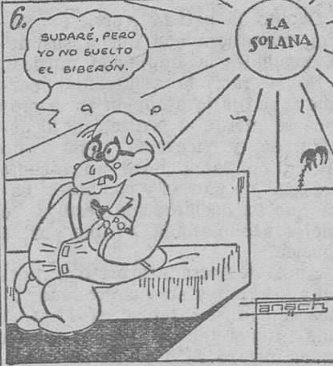
Ahora a esperar sentado con el chupón preparado. (Texto y monos de Panach.)