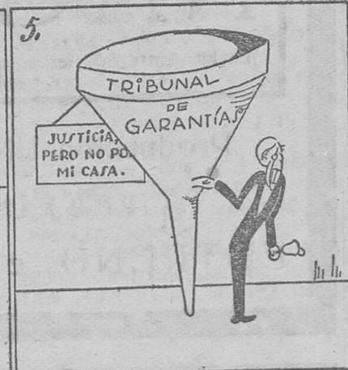
Votó el Congreso, sesudo, otra ley, que es otro embudo.