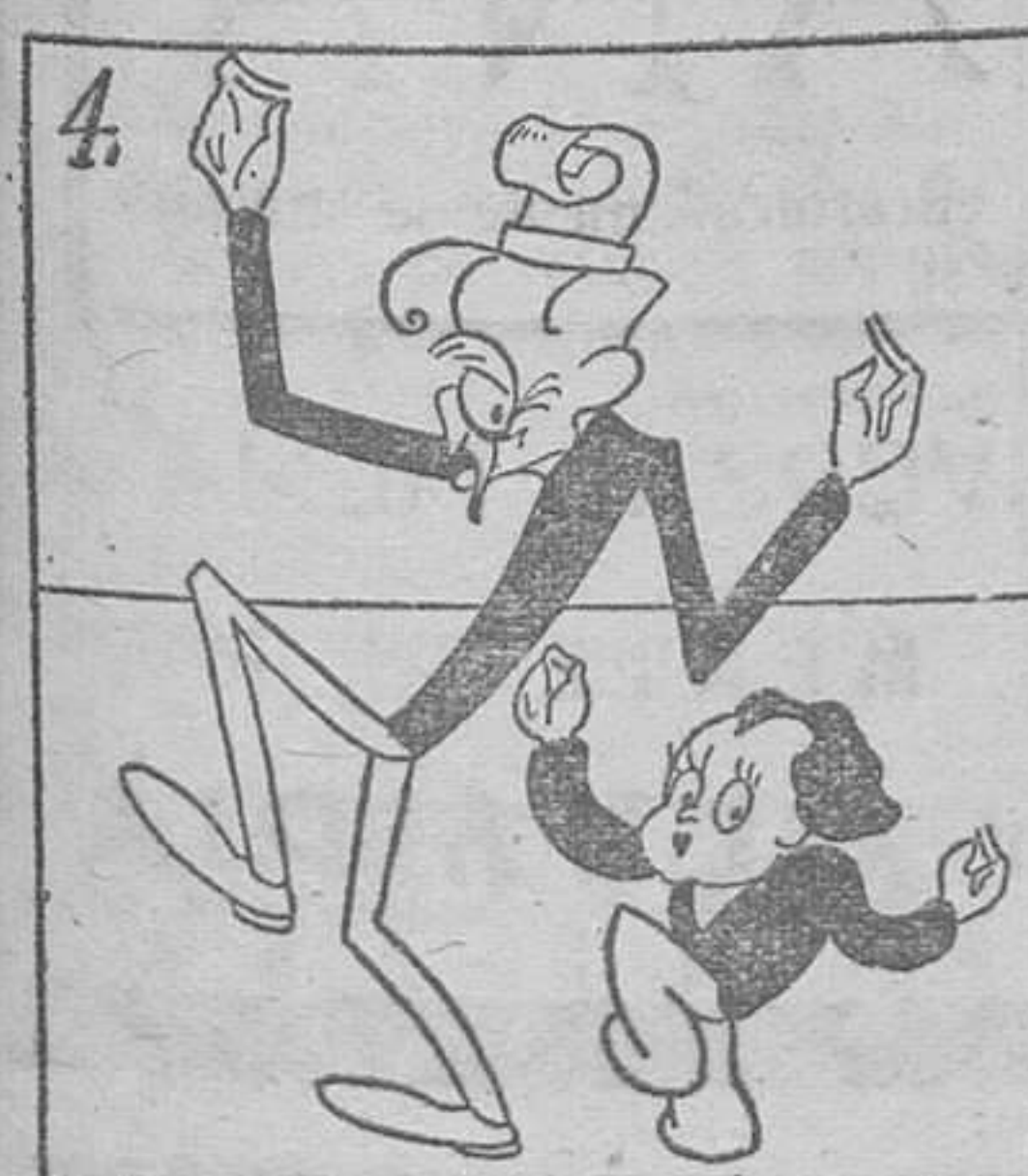
La vida semriu i es bona, pa l'avi i pa Barcelona.