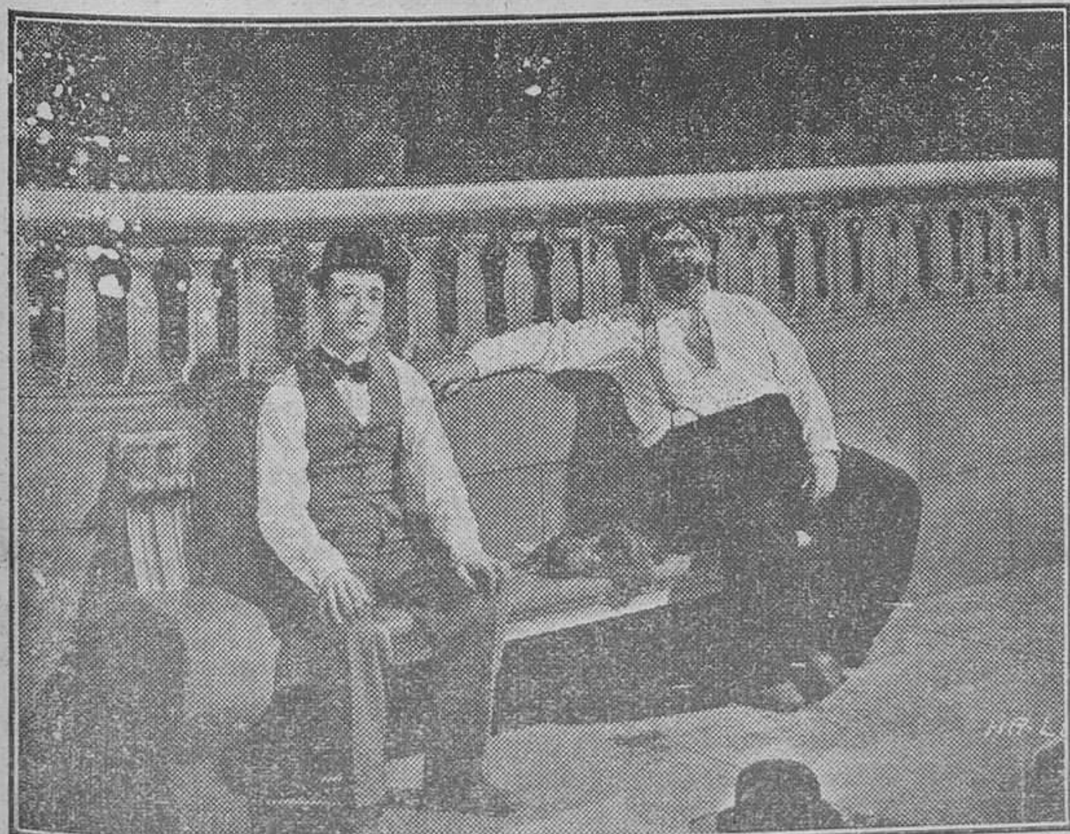
La inimitable pareja Laurel-Hardy, que consigue en “Salvada a las mujeres” la más jocosas de sus creaciones. Esta novísima producción de la Metro G. M. que por primera vez se proyecta en España, acaba de llegar de América para que los valencianos admiren a los grandes colosales de la risa