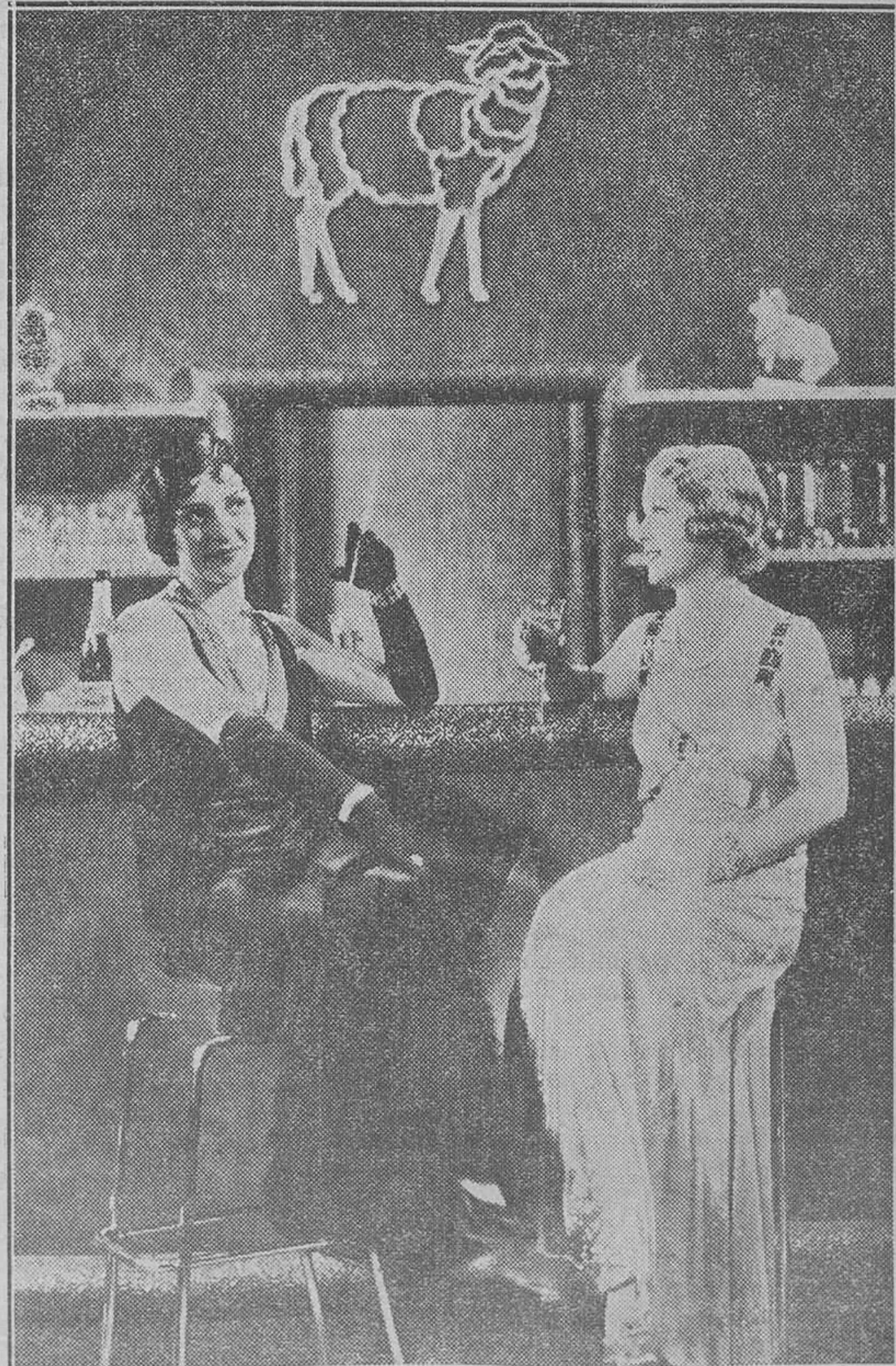
Otro film alegre, divertido, pura astrakanada que equivale a una hora de risa incontinente. “Anda que te ondu en” es un triunfo personal más para el protagonista de “El marido de mi novia”, Fernand Gravey, actor favorito del público francés por su juventud, optimismo y su labor como galán