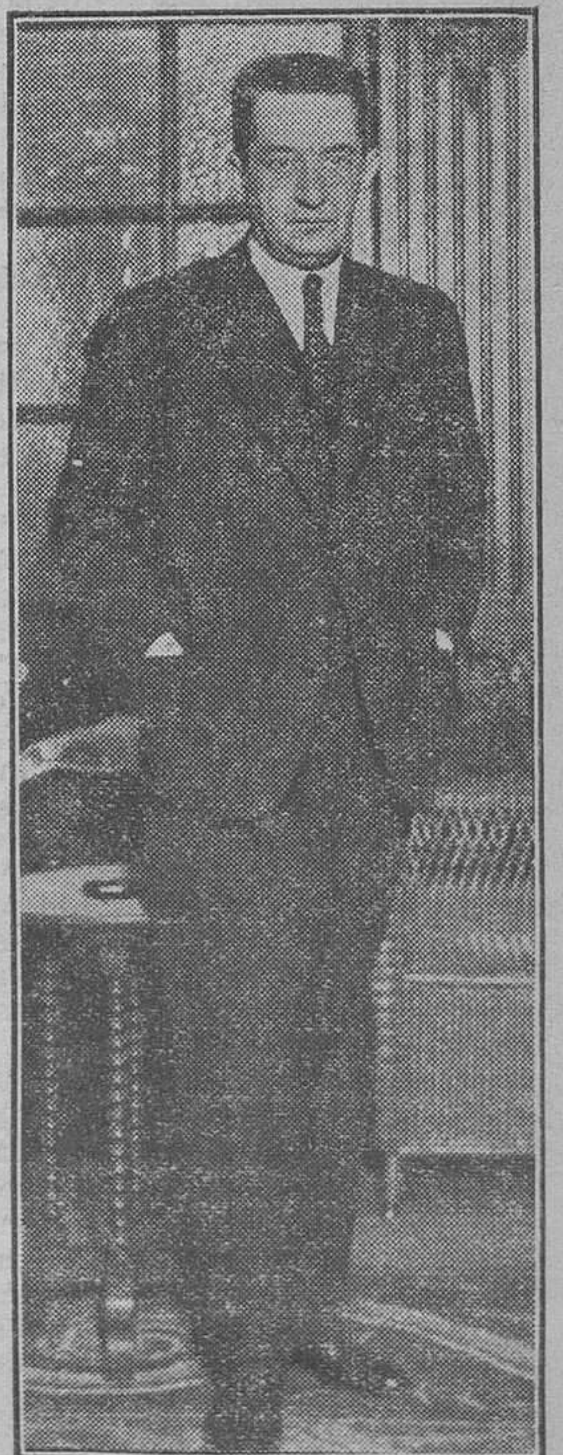
Alejandro Kerenski, cuyas conferencias sobre la revolución rusa en Madrid están llamando poderosamente la atención

¿Por qué no se incluyeron en el artículo 12 estos países, que son también productores de importancia? ¿Por qué se escogieron los países más caros de Europa?