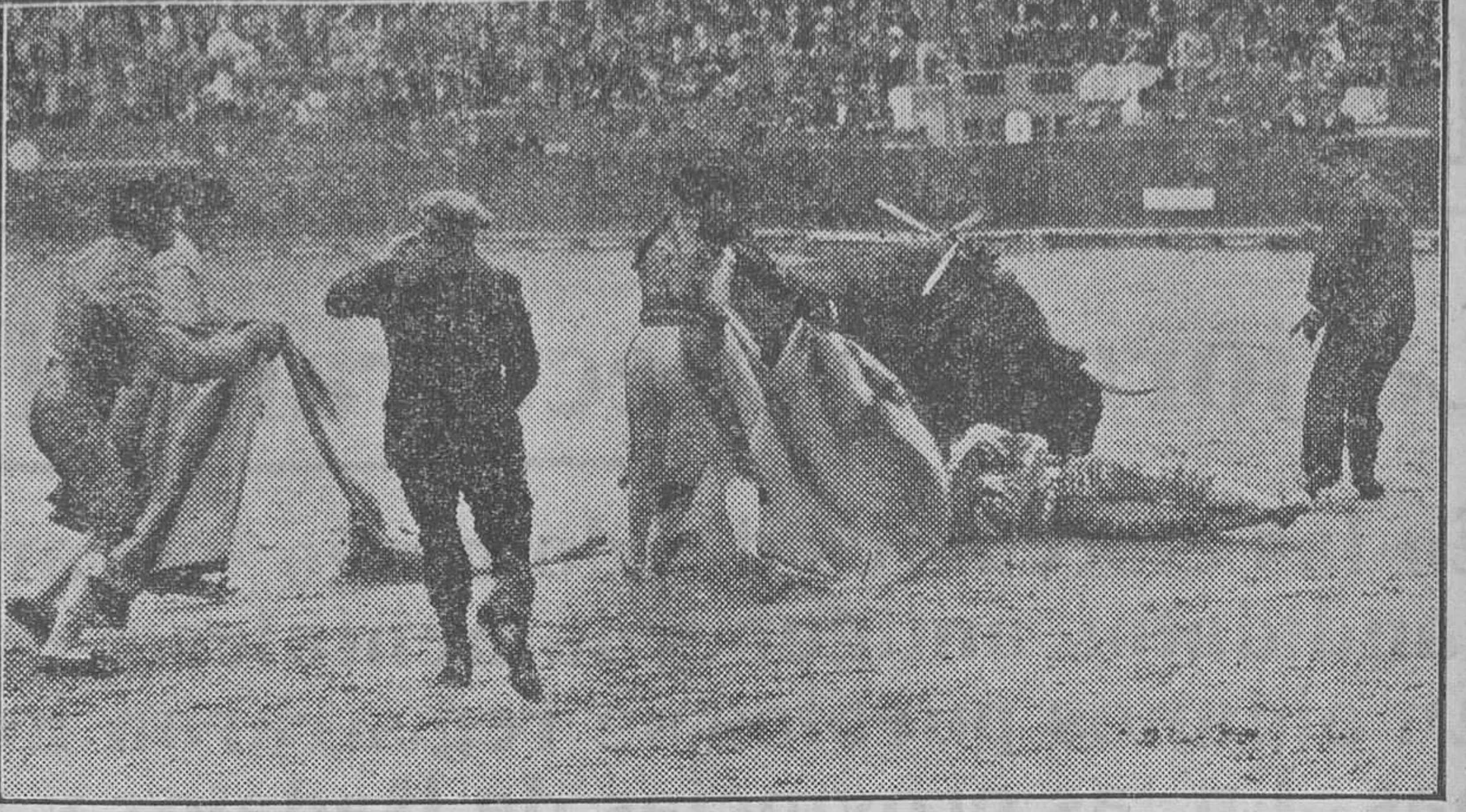
Un momento de la cogida de Barrera.—El toro, después de lesionar al diestro valenciano, se lanzó contra un arenero, al que también volteó aparatosamente.