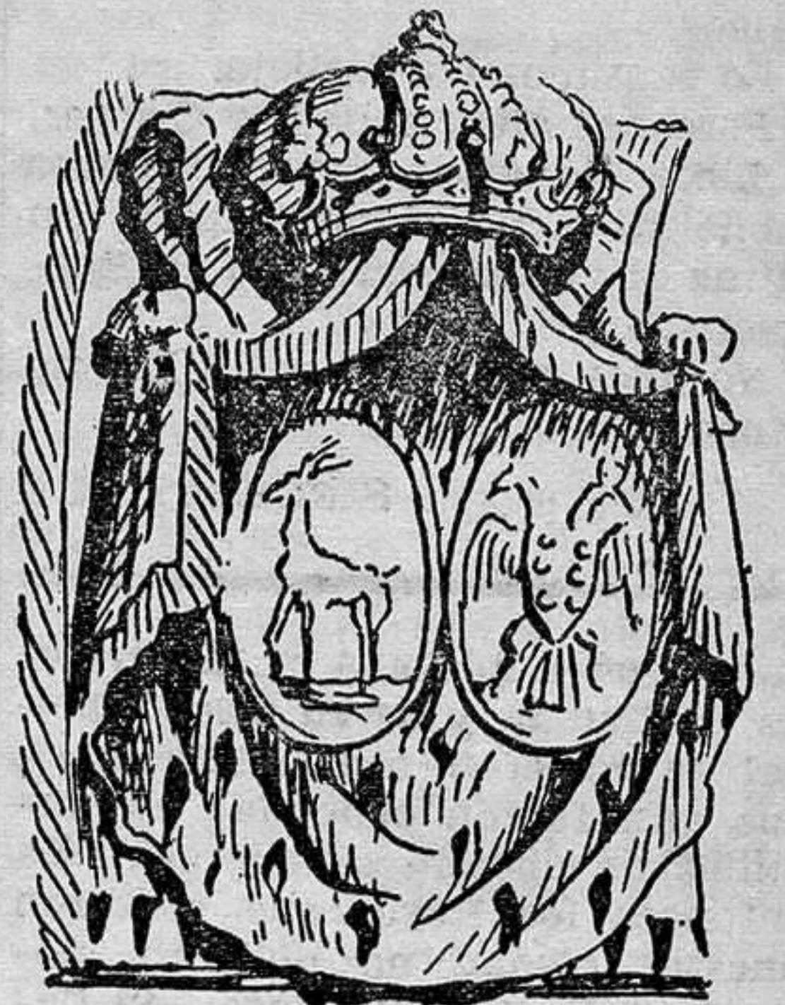
El escudo de los Cervellón

Aún volvió a alojar personas Reales este palacio. Ello fué el año 1871. El día 3 de Marzo visitó nuestra ciudad el Rey Amadeo de Saboya. Este Monarca entró en Valencia a caballo, y después de visitar la capilla de la Virgen de los Desamparados y de regalar a la Patrona de los valencianos el reloj y la cadena de oro que llevaba, se dirigió al mencionado pa-