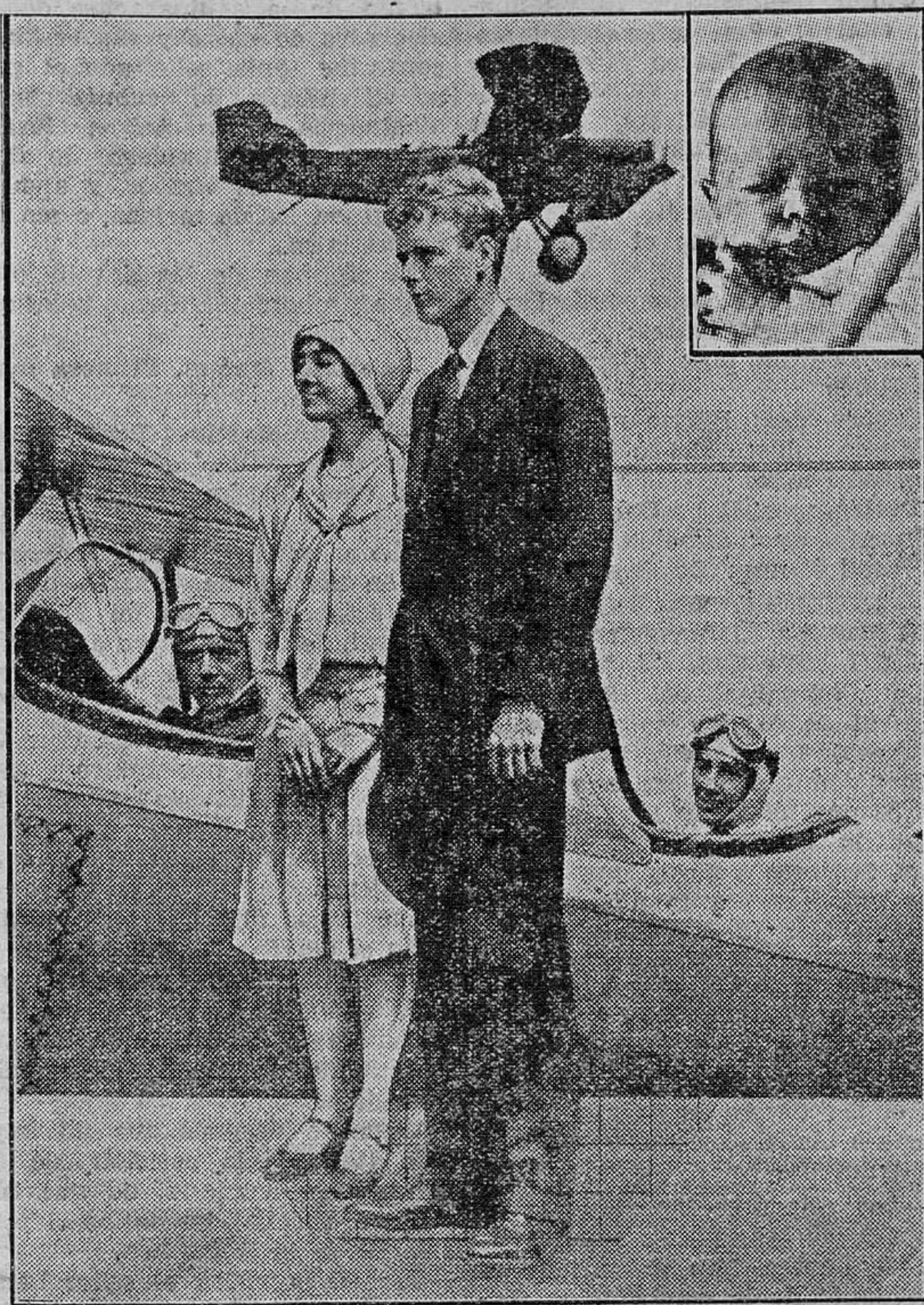
El matrimonio Lindbergh, a quien le fué raptado, por unos malhechores, su hijo, por cuyo rescate piden al famoso aviador norteamericano la suma de 50 000 dólares

Bien se ve que, a pesar de las iniciativas particulares que señalo, los extranjeros se llevan la sal de la bahía de Cádiz, y luego nos la revenden, llevándose también el dinero español, poniéndolo con esta y otras sangrías tan desmedrado, que de día en día disminuye su capacidad de adquisición. El año pasado, el Gobierno portugués fletó el vapor "Gil Eanes", para acompañar en su expedición al mar libre de Terranova a varios buques que se aprestaron para la pesca del bacalao. Iban en este buque naturalistas, médicos, autoridades de Marina, representantes del Gobierno, aduaneros que fiscalizaron la pesca y garantizaron a los armadores portugueses en la hora del retorno una ganancia segura. Fueron en este buque también unos escritores, encargados de convencer al pueblo portugués de que nacionalizar las 35.000 toneladas de bacalao que consume, era una empresa de honor nacional, recordando que en Francia, en momentos de pérdidas, naufragios y desfallecimientos, fué Pierre Loti, con su admirable novela "Han de Islandia", quien glorificando como héroes de "La Eneida" a los pescadores normandos, hizo de estas pesquerías una epopeya nacional y preparó el ánimo de estos parlamentarios