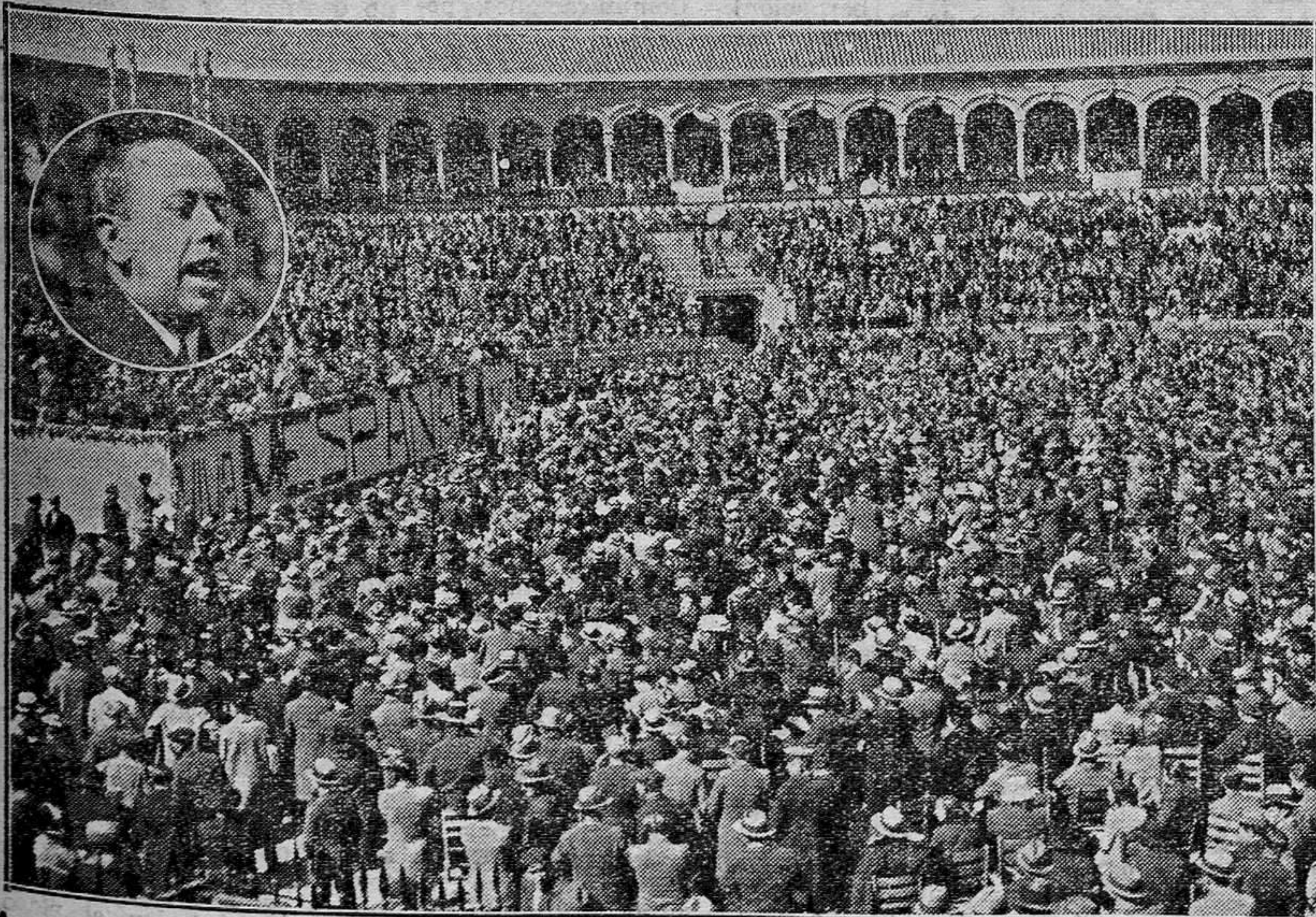
Aspecto de la plaza de Toros durante el mitin. En la parte superior, uno de los oradores, el señor Gil Robles, pronunciando un elocuentísimo discurso