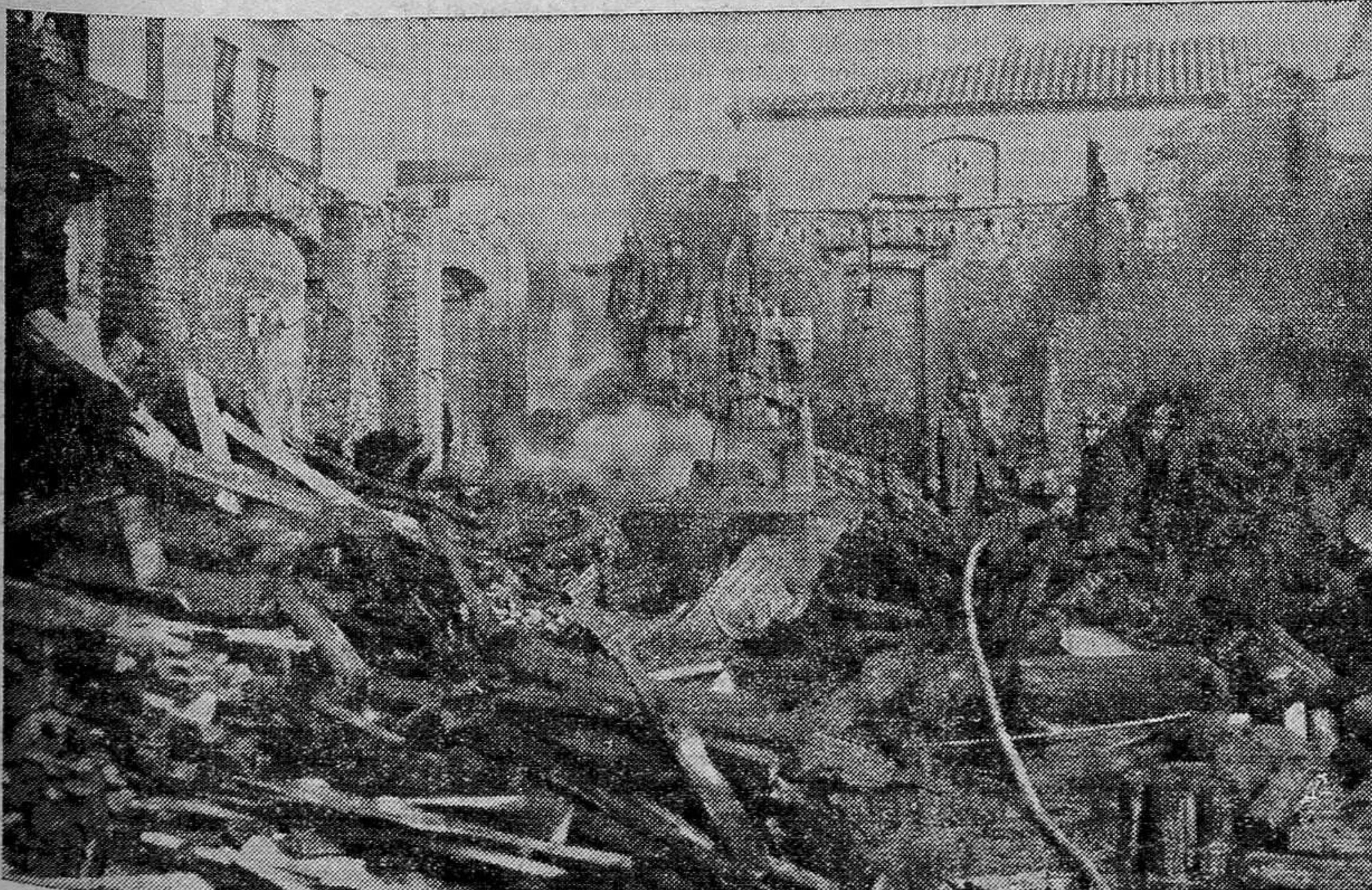
La brigada de bomberos extinguiendo el incendio en la mañana de ayer