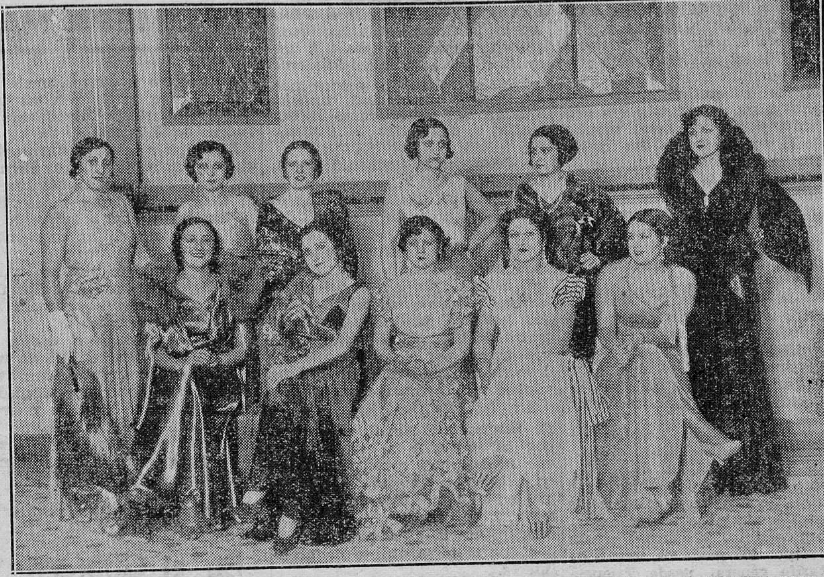
Grupo de bellezas de las diferentes regiones españolas que han tomado parte en el concurso para la Miss España 1932