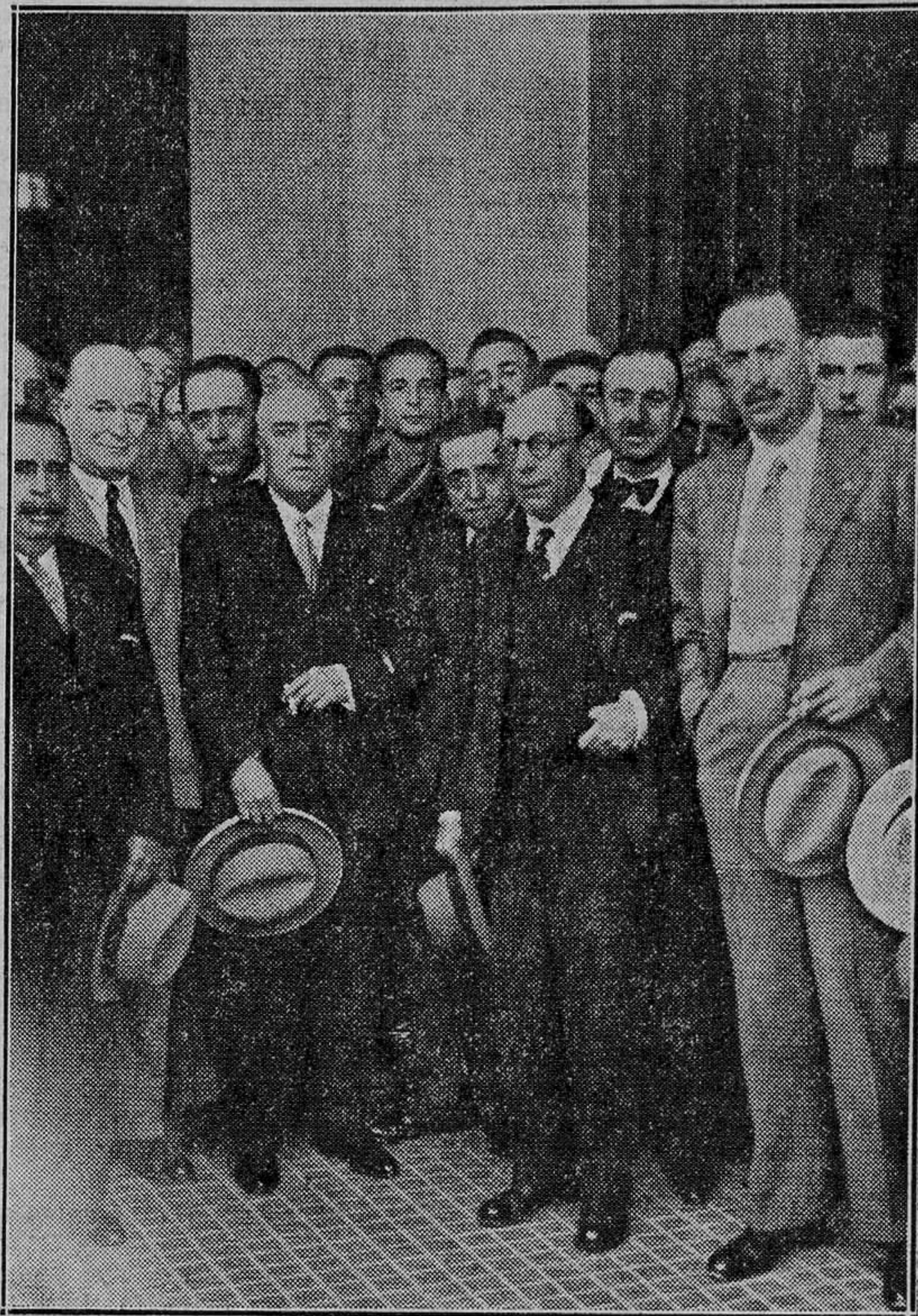
Recibimiento en la estación del Norte, al ministro de Trabajo don Ricardo Samper.

Teléf. de LAS PROVINCIAS 12-5-20 y 13-8-97