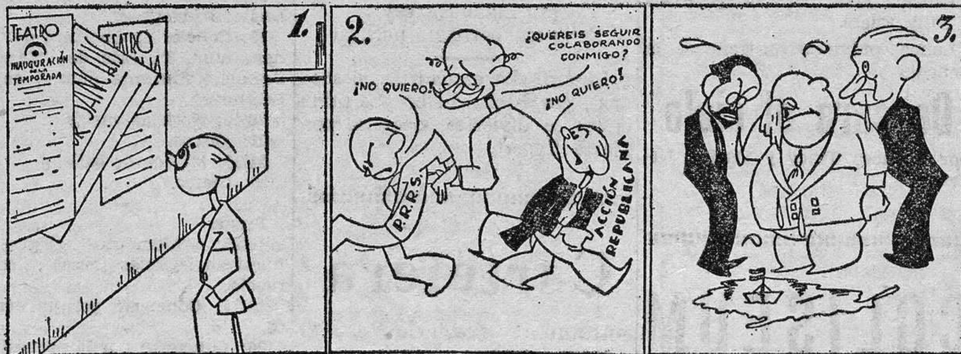
Esta semana pasada, comenzó la temporada.