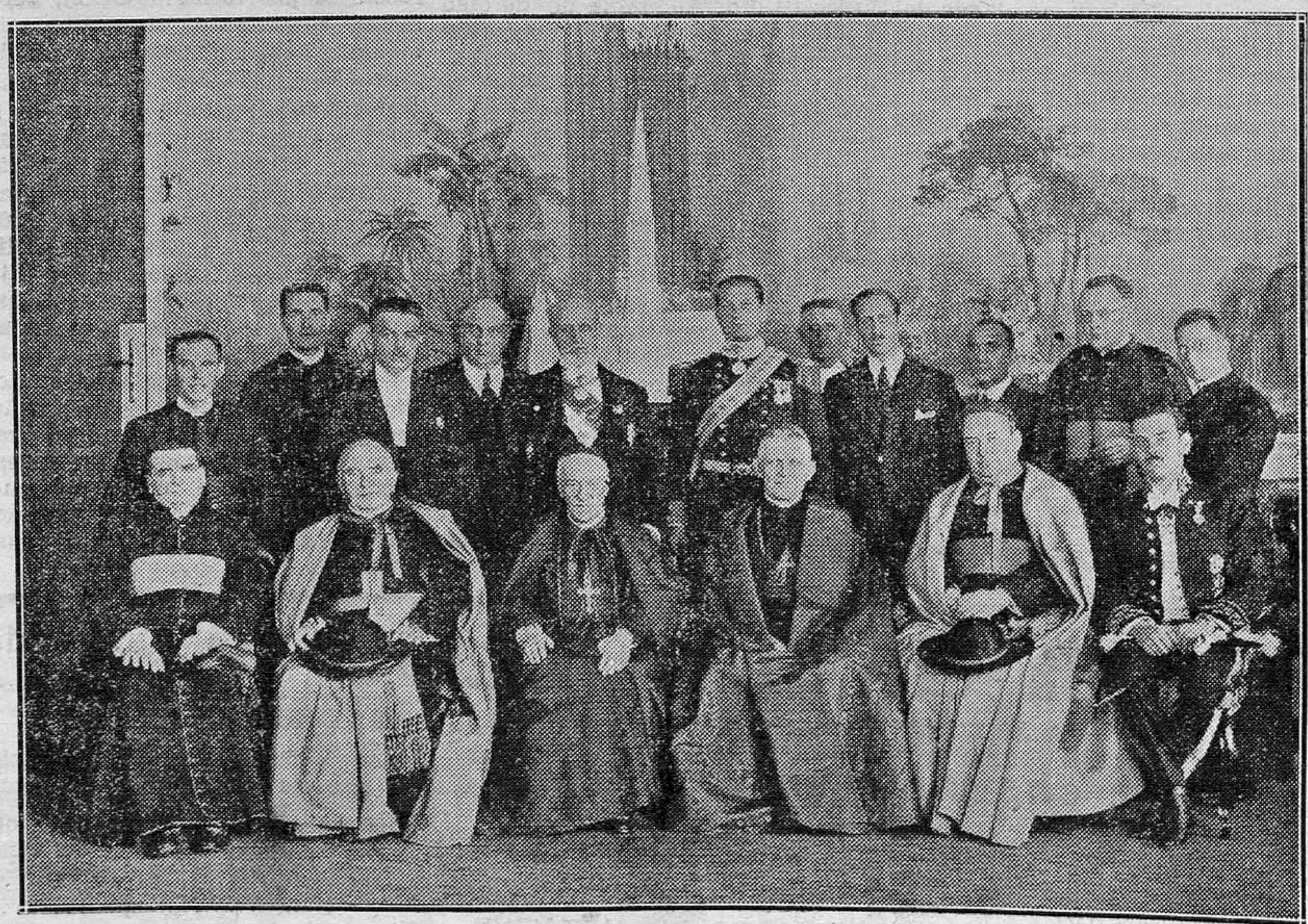
Los Prelados que han concurrido, presididos por el delegado del Papa, Cardenal Lafontaine, al Congreso Católico de Vicca, que tanta resonancia mundial ha tenido.

16 Septiembre 1933. El núcleo principal del anticiclón aparece hoy sobre la Europa Central y produce en general buen tiempo por el Occidente de la misma. Sobre Islandia y alrededor de las Islas Madera aparecen presiones bajas, siendo mucho más intensas las de aquella isla. Es probable persista en Levante el buen tiempo.