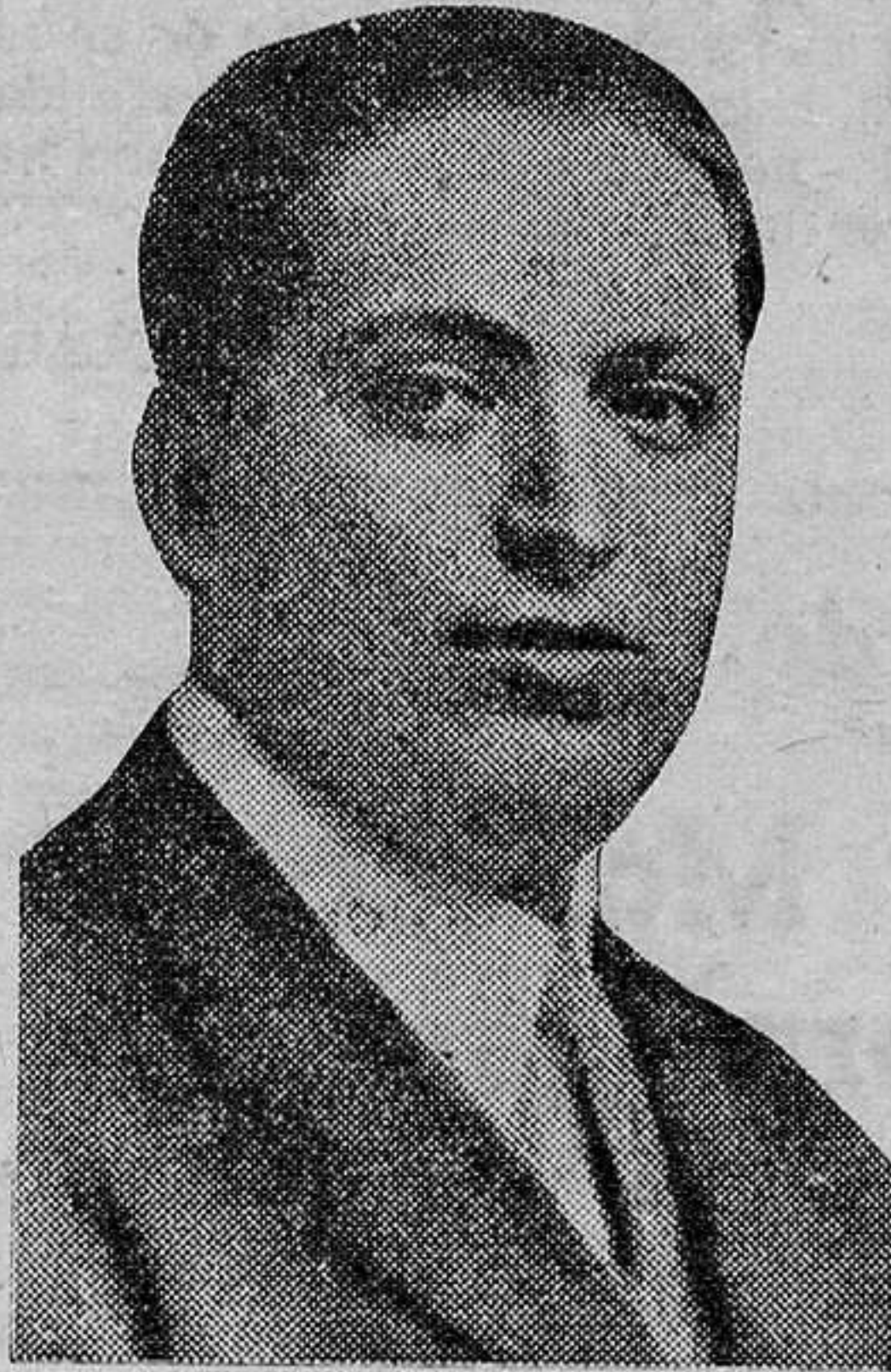
Don José Calvo Sotelo