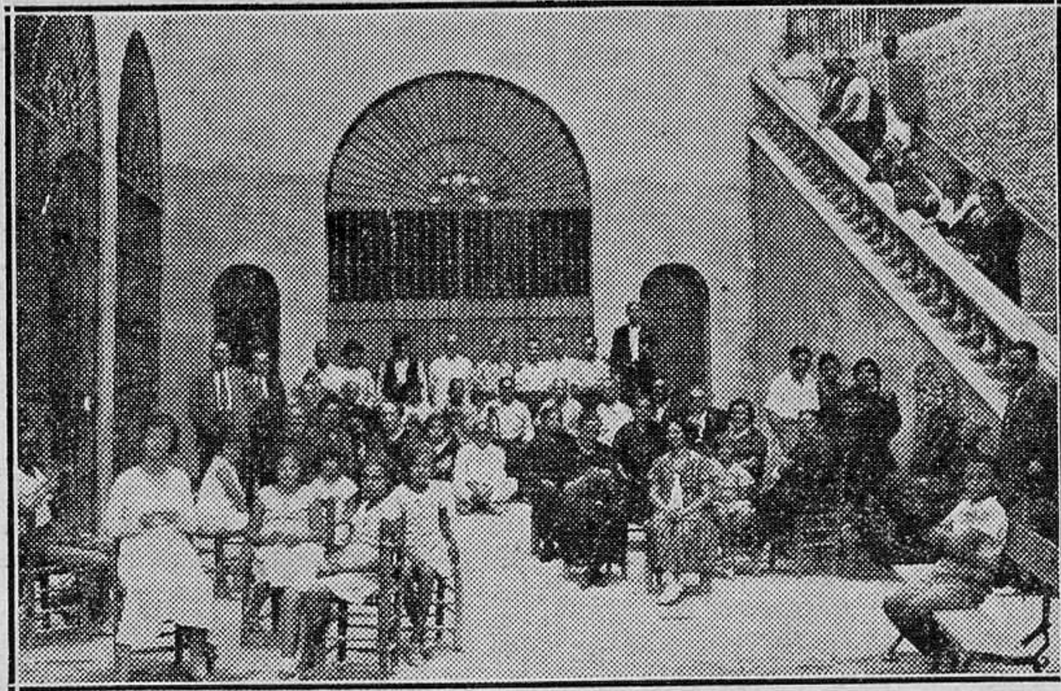
En la Capilla de la Virgen asisten los niños a la clase de Doctrina Cristiana

Caballeros respetables, enfermos de abatimiento y misantropía, que, por un inaudito trastueque de todas las previsiones, habían desechado su grave continente de gentes formales y habianse lanzado, en pijama o en mangas de camisa, a recorrer el bosque en alboroto de risotadas y canciones desentonadas, ante las que los árboles, cabeceantes por el viento, parecían unos fantasmales espectadores que iban a "troncharse" de risa.