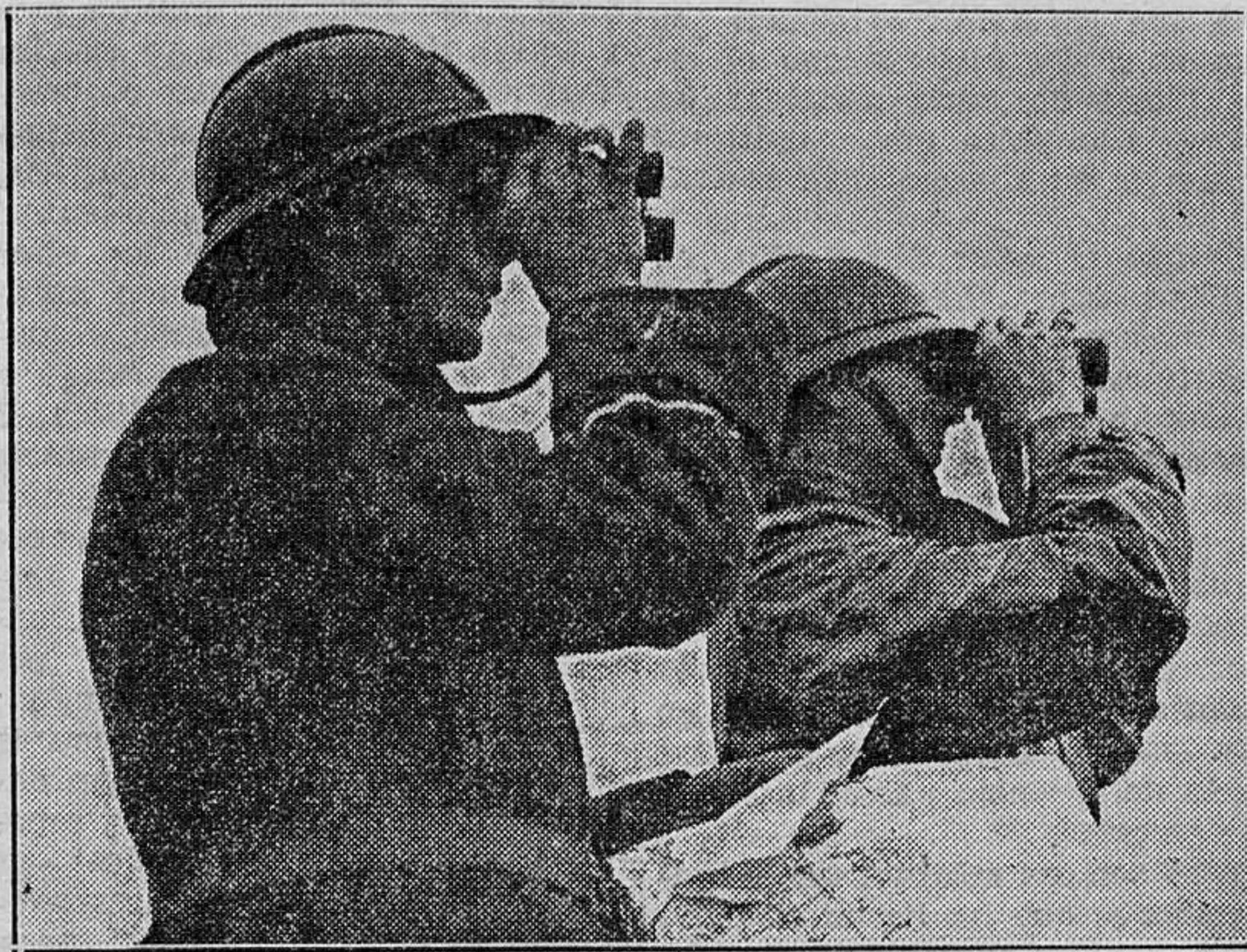
Las maniobras en el campo de Beverloo (Bélgica). Observadores siguiendo la evolución de las tropas.