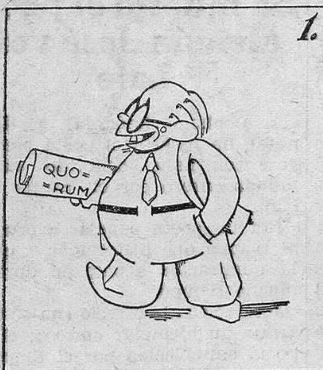
El Gobierno se ha alegrado, porque "quorum" ha logrado.