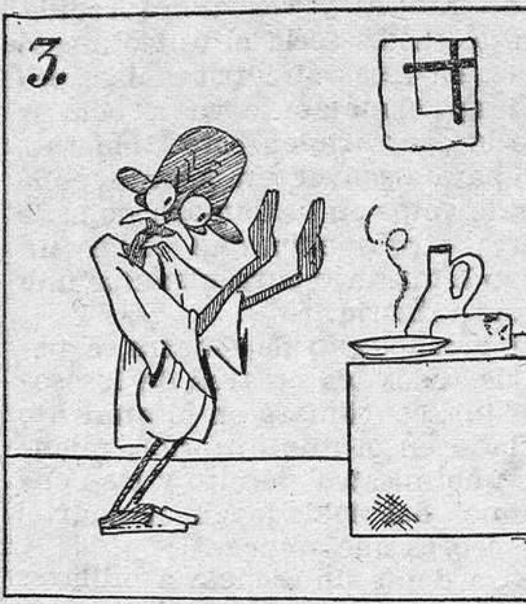
Ghandi hace huelga del hambre; no come ni de fiambre.