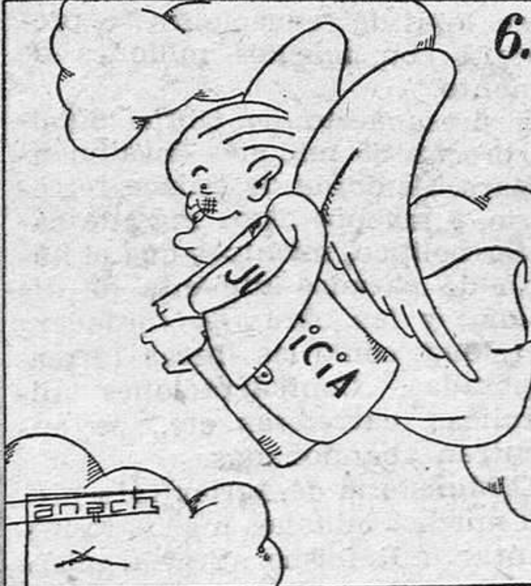
Parece que el regalito es pa Galarza. (¡Angelito!) (Texto y monos de Panach.)