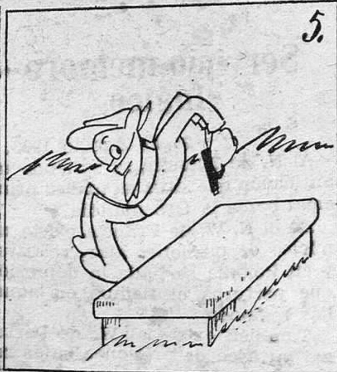
Han dejado los estancos, y ahora se "asaltan" los Bancos.