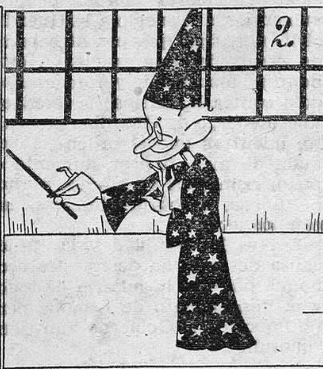
Pero Lerroux dijo: "¡Bah! El Gobierno caerá."