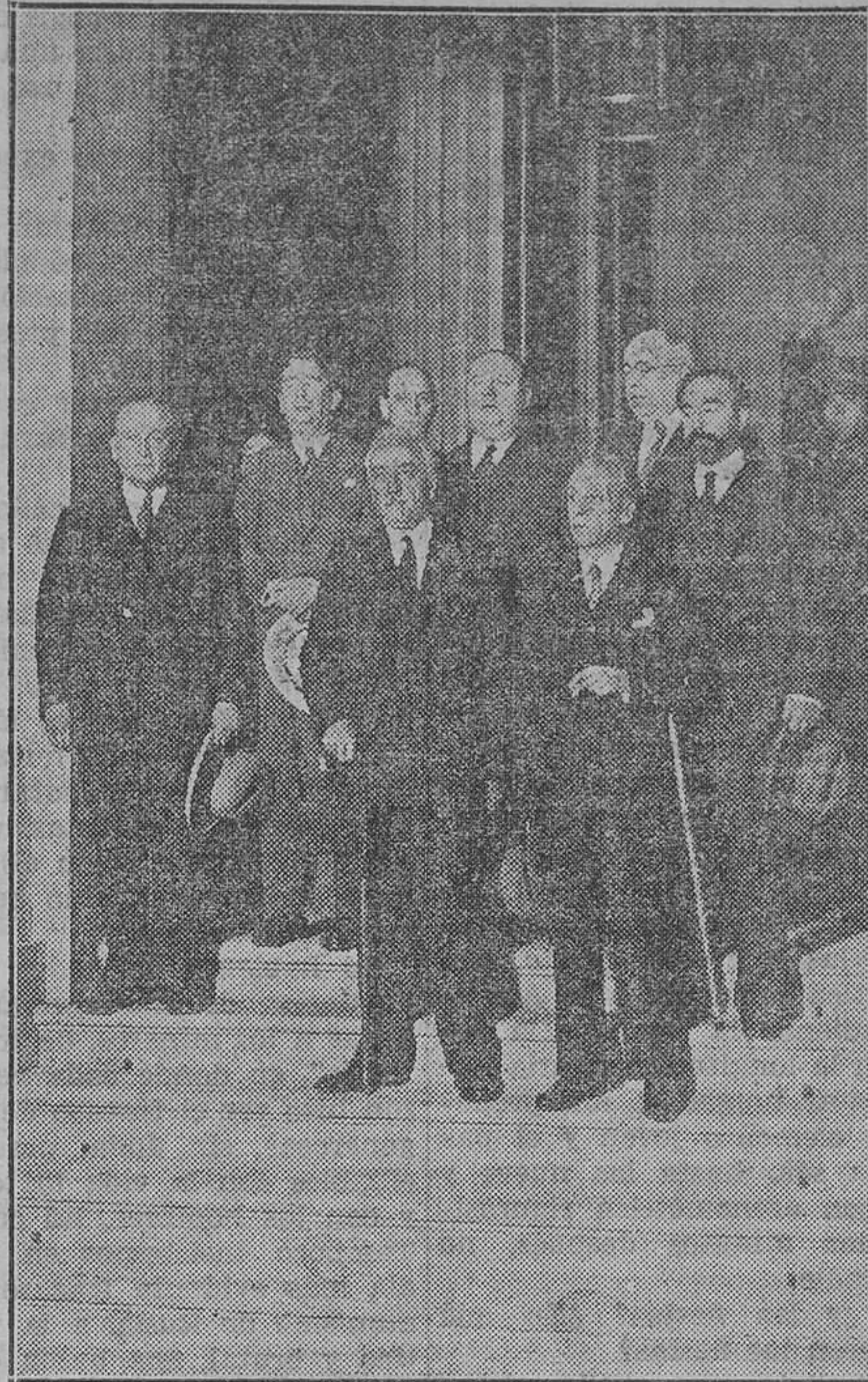
El Gobierno visitando el Palacio Real