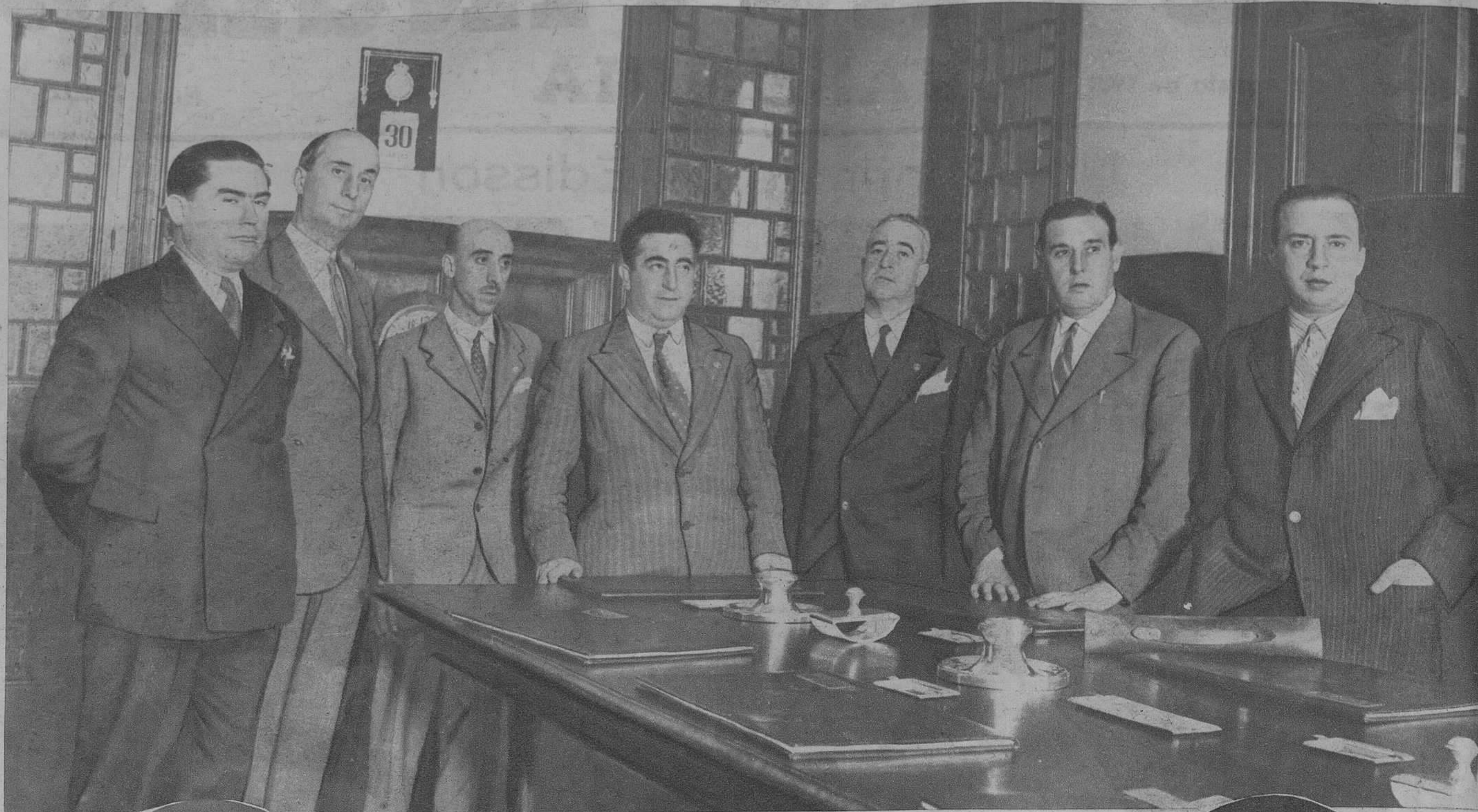
Reunión del comité de la Mancomunidad de Diputaciones, bajo la presidencia del Sr. Salazar Alonso, de Madrid.