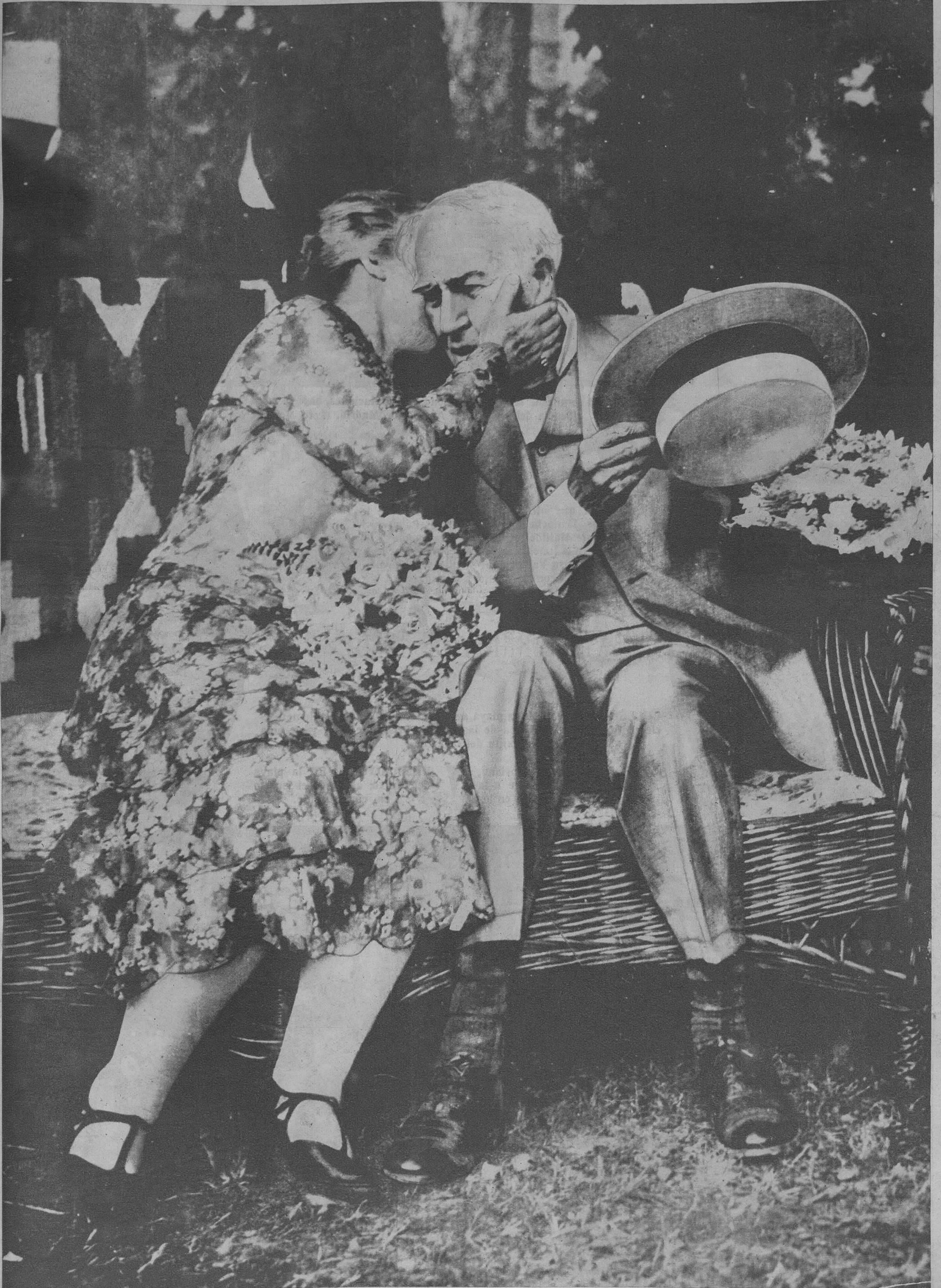
La esposa del sabio inventor hablándole en los jardines del club «Ave y árbol», después de las fiestas que se celebraron en su honor.