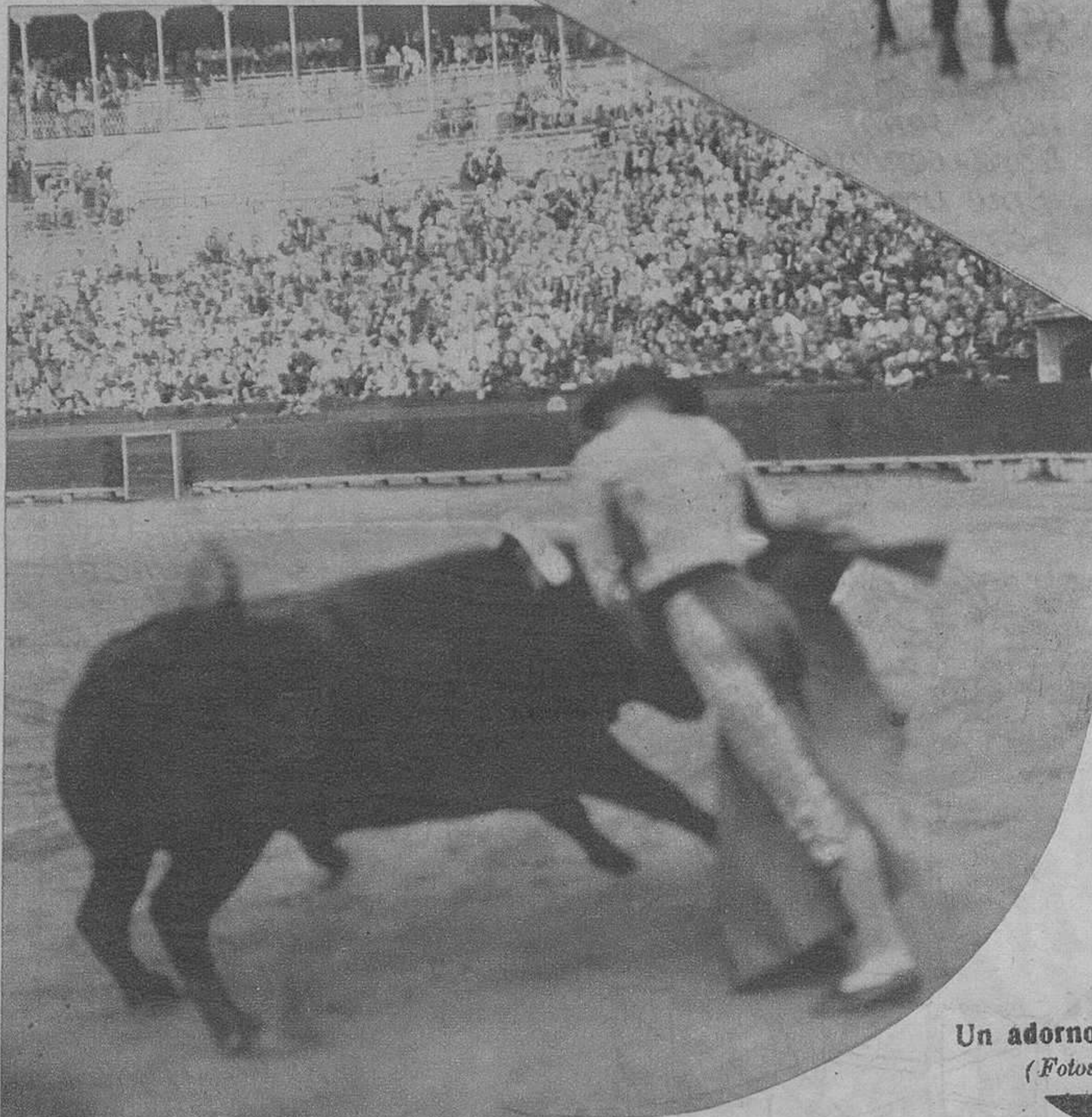
Un adorno de Chicuelo.