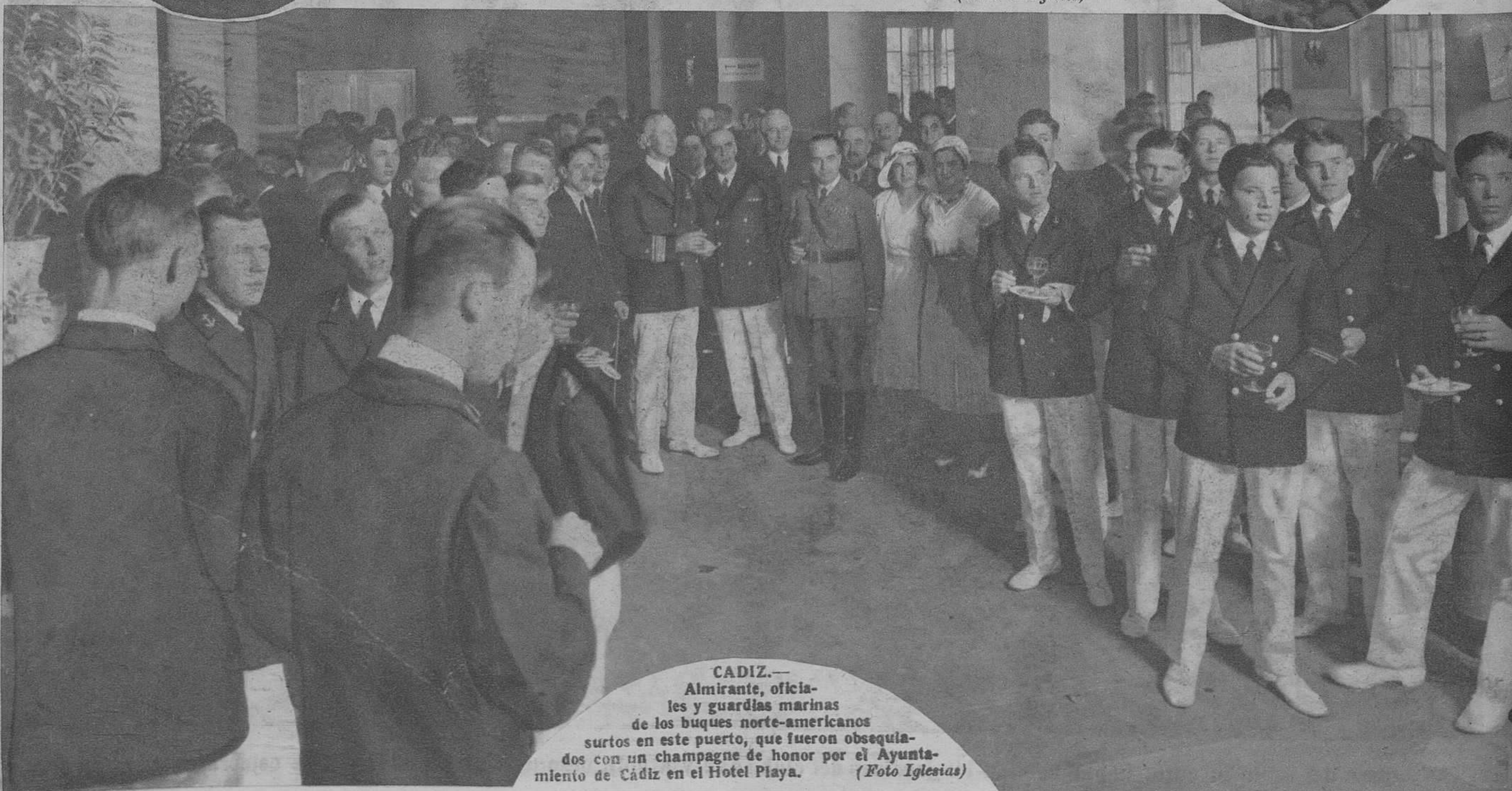
CADIZ.—Almirante, oficiales y guardias marinos de los buques norte-americanos surtos en este puerto, que fueron obsequiados con un champagne de honor por el Ayuntamiento de Cádiz en el Hotel Playa.