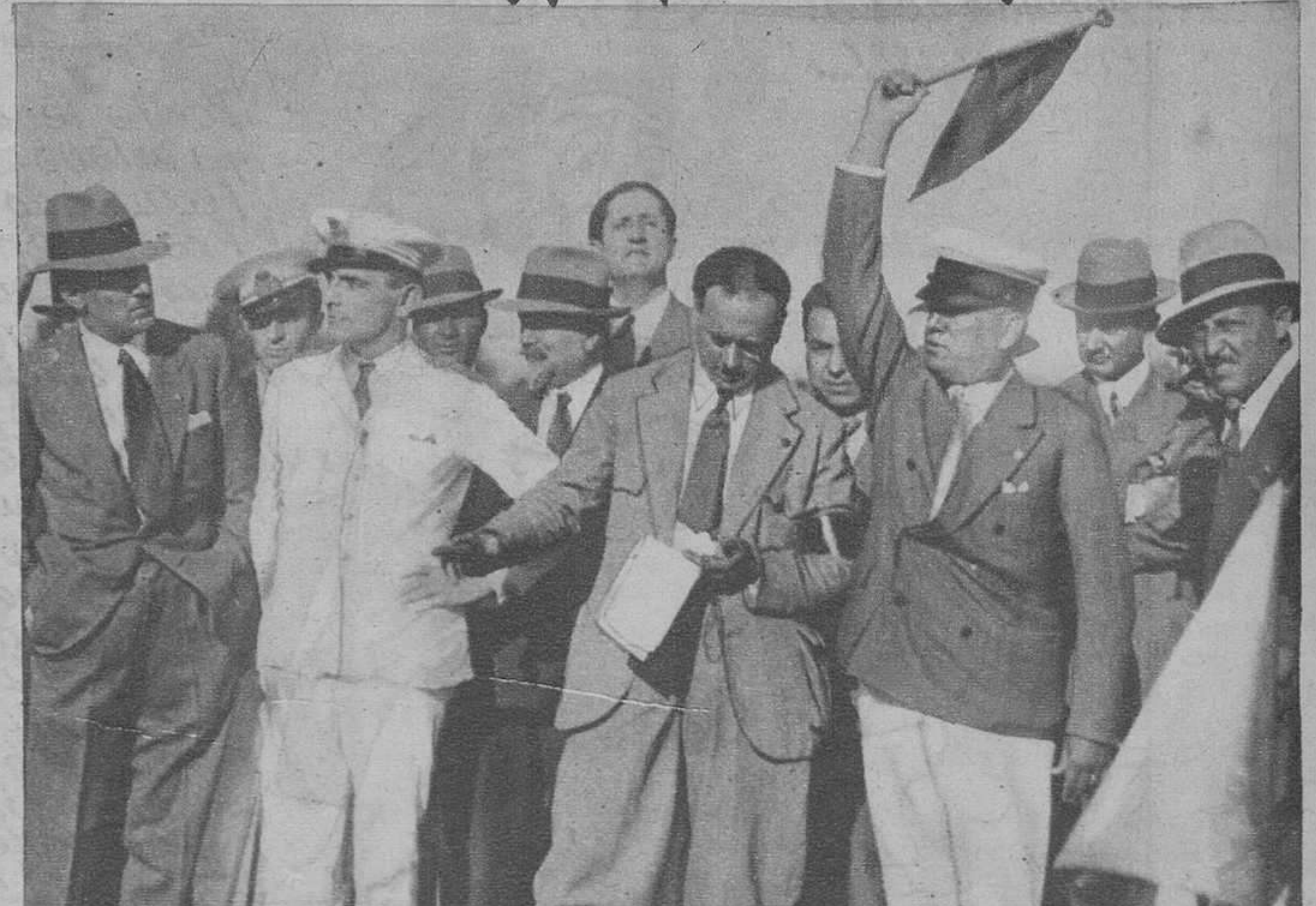
El circuito aéreo de Italia.—Mussolini dando personalmente la salida.