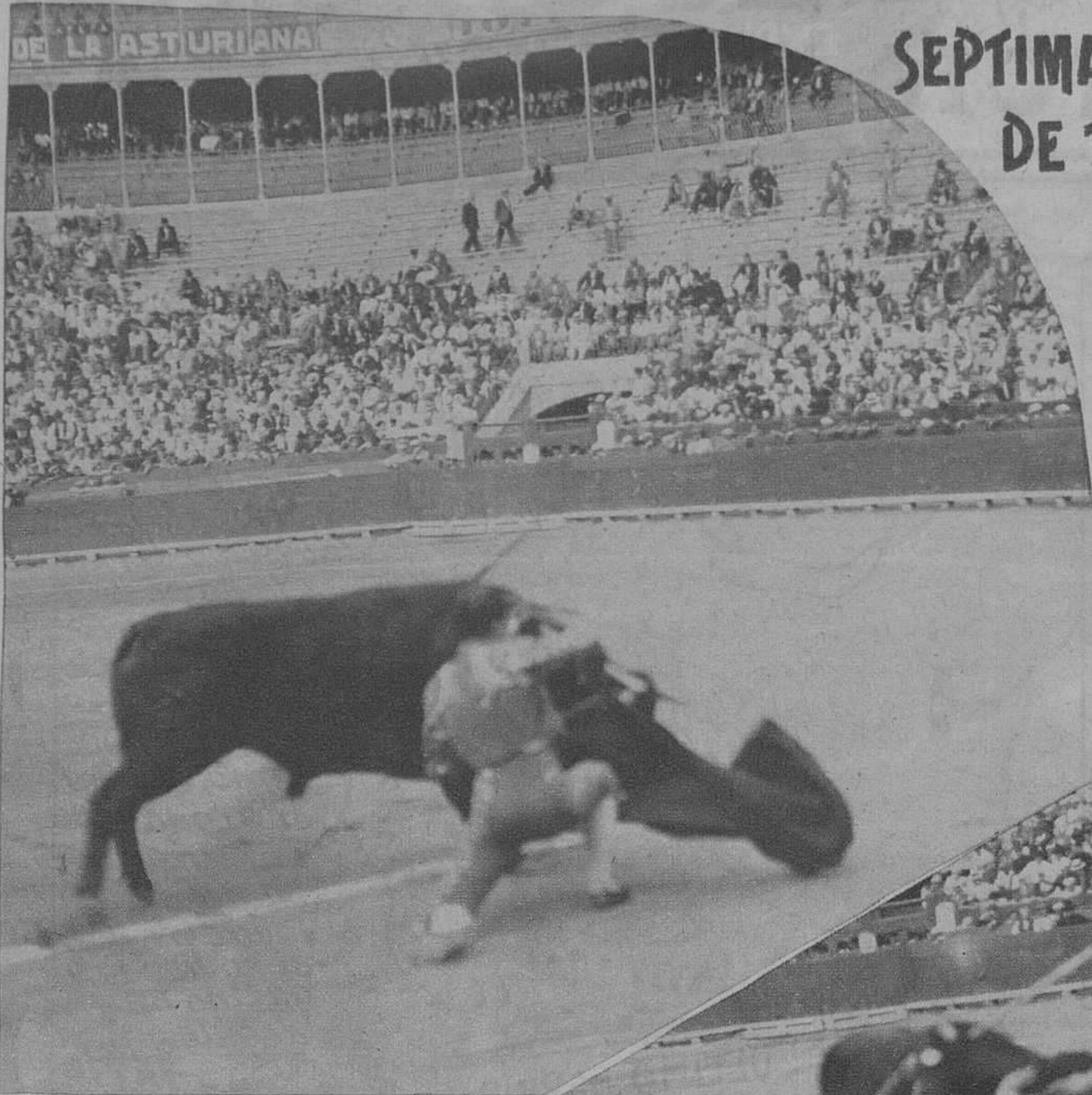
Un rodillazo de Chicuelo a su primero.