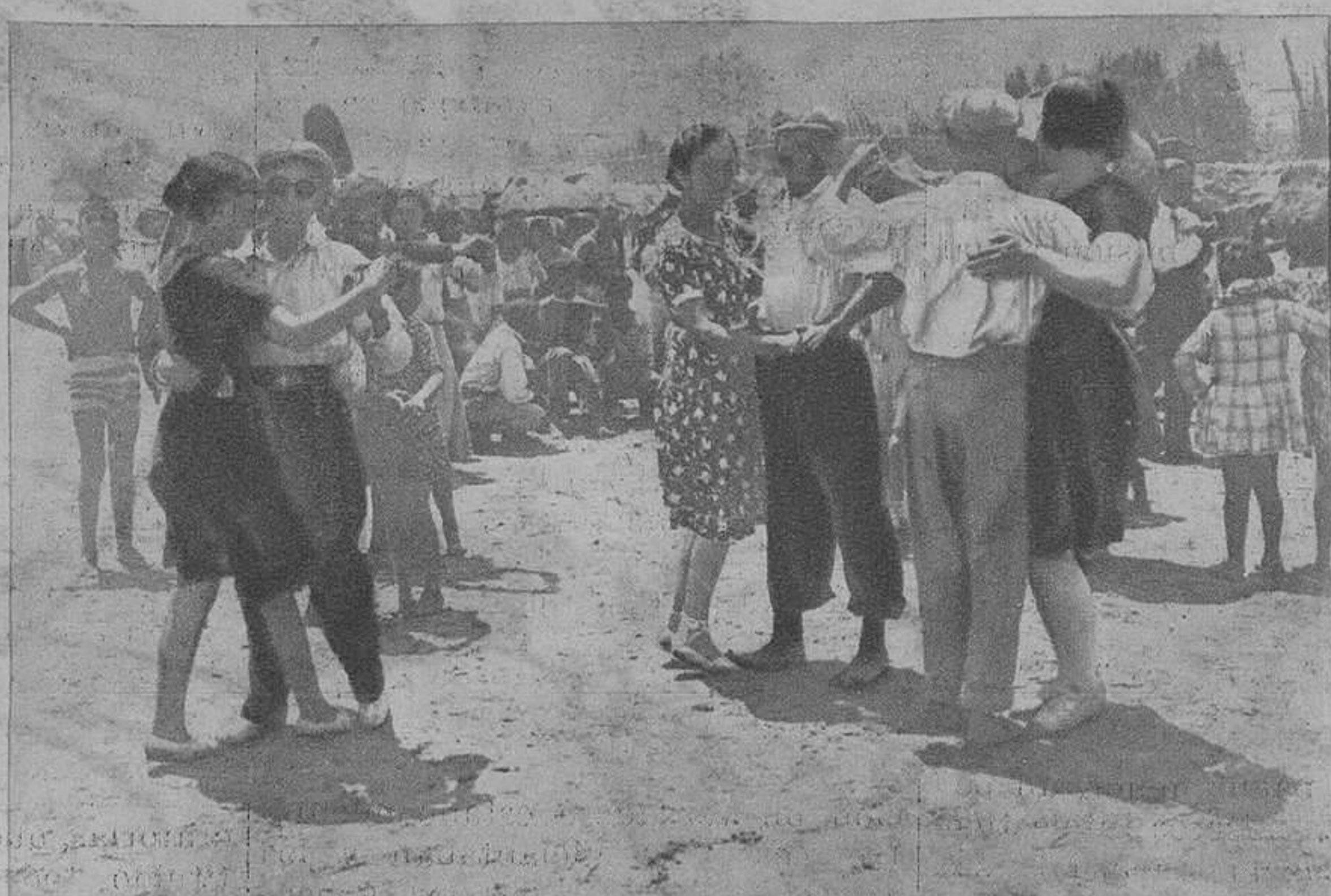
CULLERA.—Aspecto de la playa en estos días en que se aglomera el elemento popular en busca de las frescas brisas de mar, y de una mijajita del «agarrao».