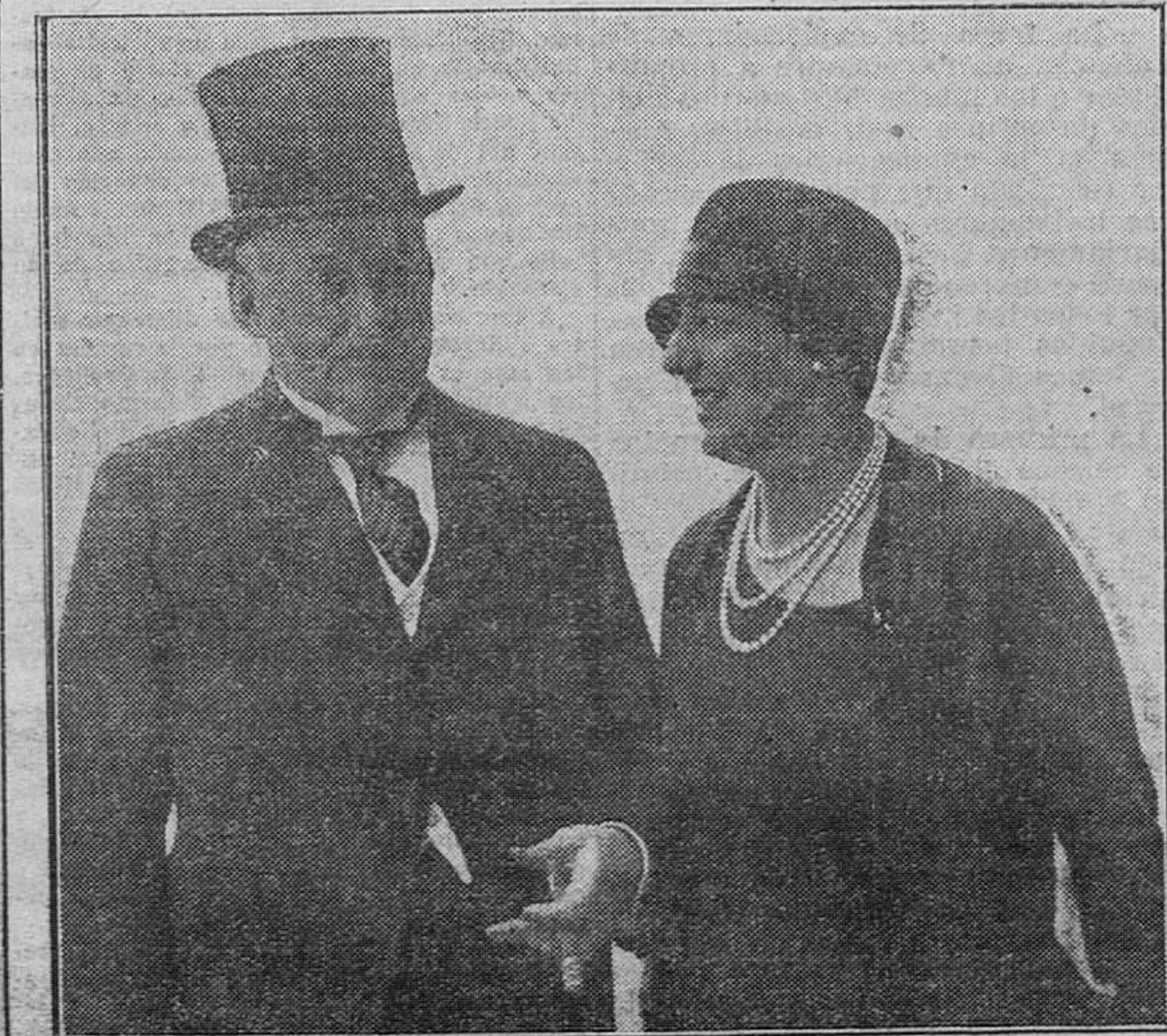
El general Primo de Rivera y su futura esposa, la señorita de Castellanos, al salir del banquete con que recientemente han sido obsequiados