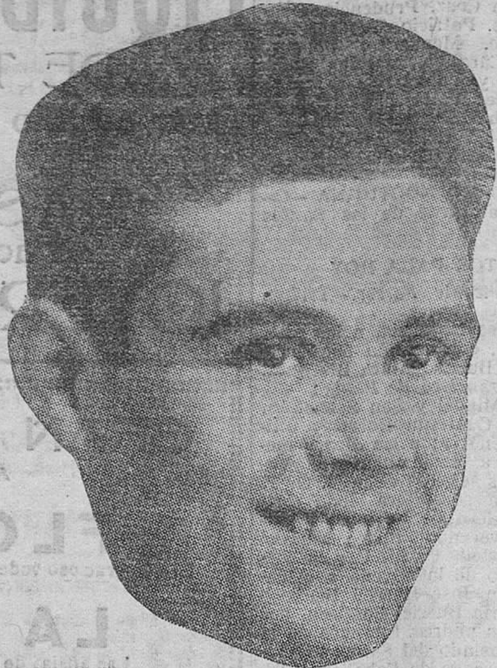
Esta tarde, a las siete y media, llegará a Valencia el pugil valenciano, de regreso de Norteamérica, donde ha cosechado grandes laureos, demostrando ser uno de los mejores boxeadores del mundo en su categoría. LAS PROVINCIAS se complace en darle la bienvenida.