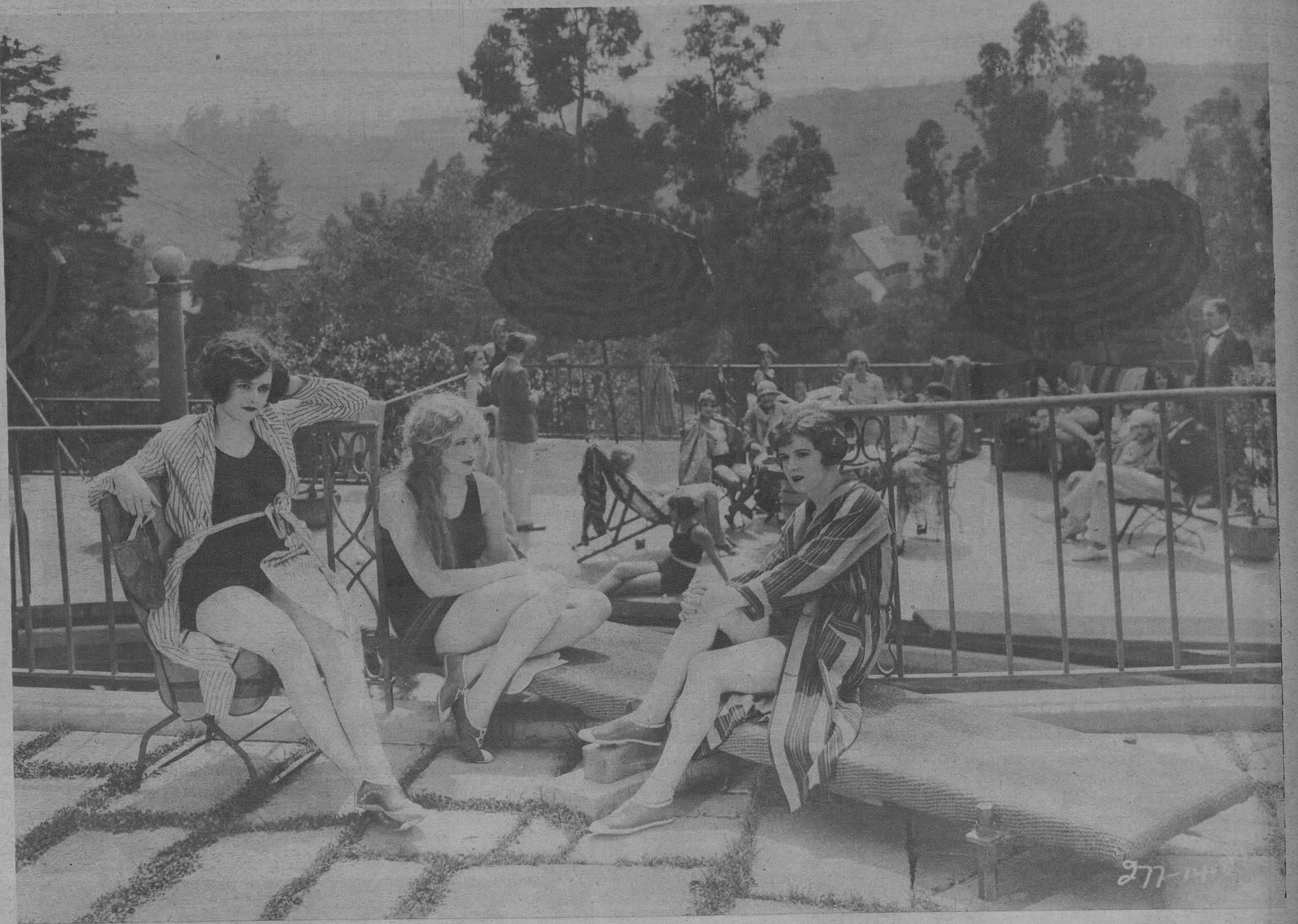
Las artistas de la Metro Goldwyn Mayer, en las horas de descanso en las mañanas estivales.