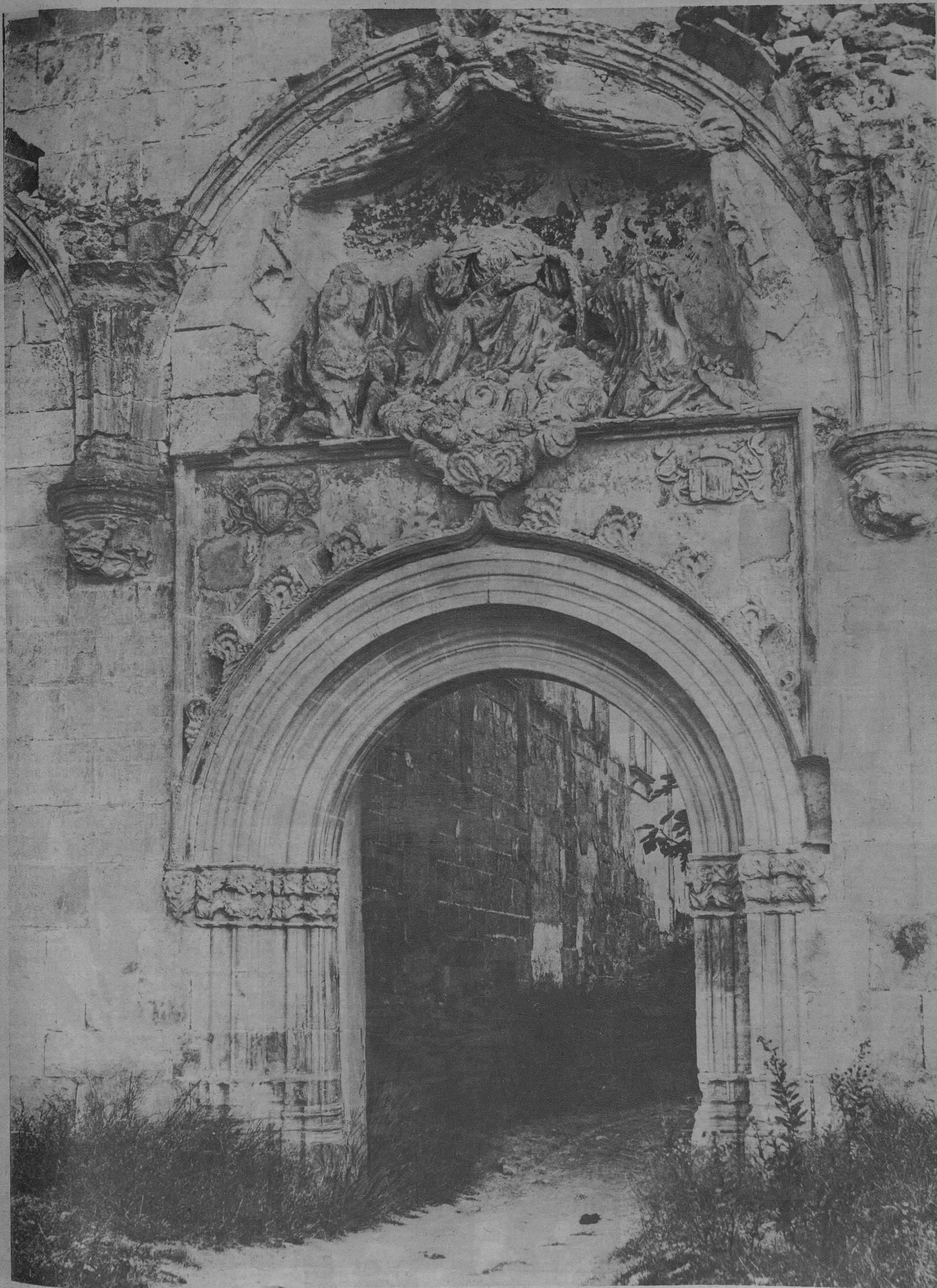
ALTURA.—Imafronte del templo cartusiano en las ruinas de Vall de Cristo.