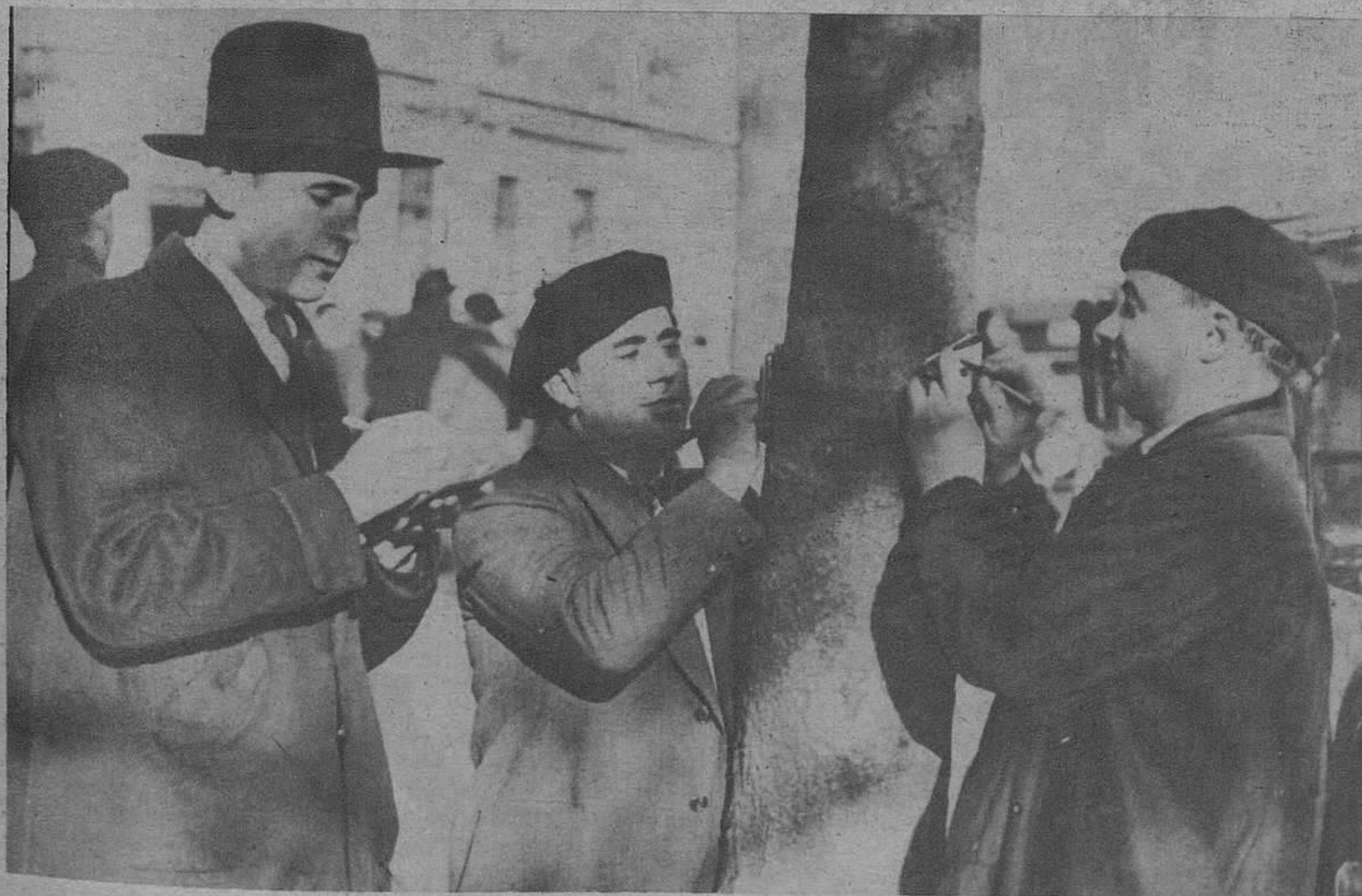
Ante los domicilios de las familias de los militares fusilados por los sucesos de Jaca. El público, a falta de pliegos para firmar, utiliza papeles, apoyándose en los árboles.