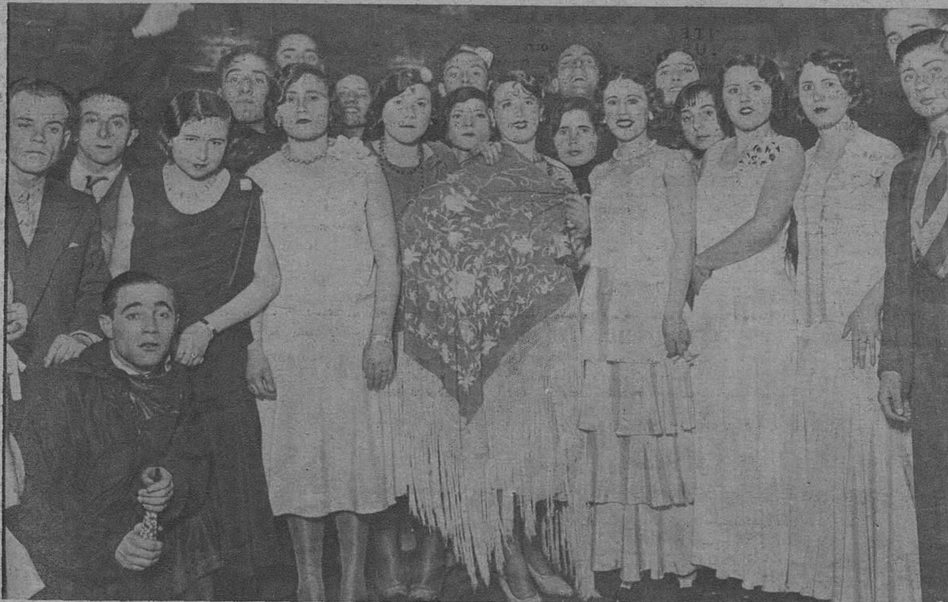
LA CORUÑA.—Baile celebrado en el Teatro Rosalía de Castro, organizado por el Casino de Clases.