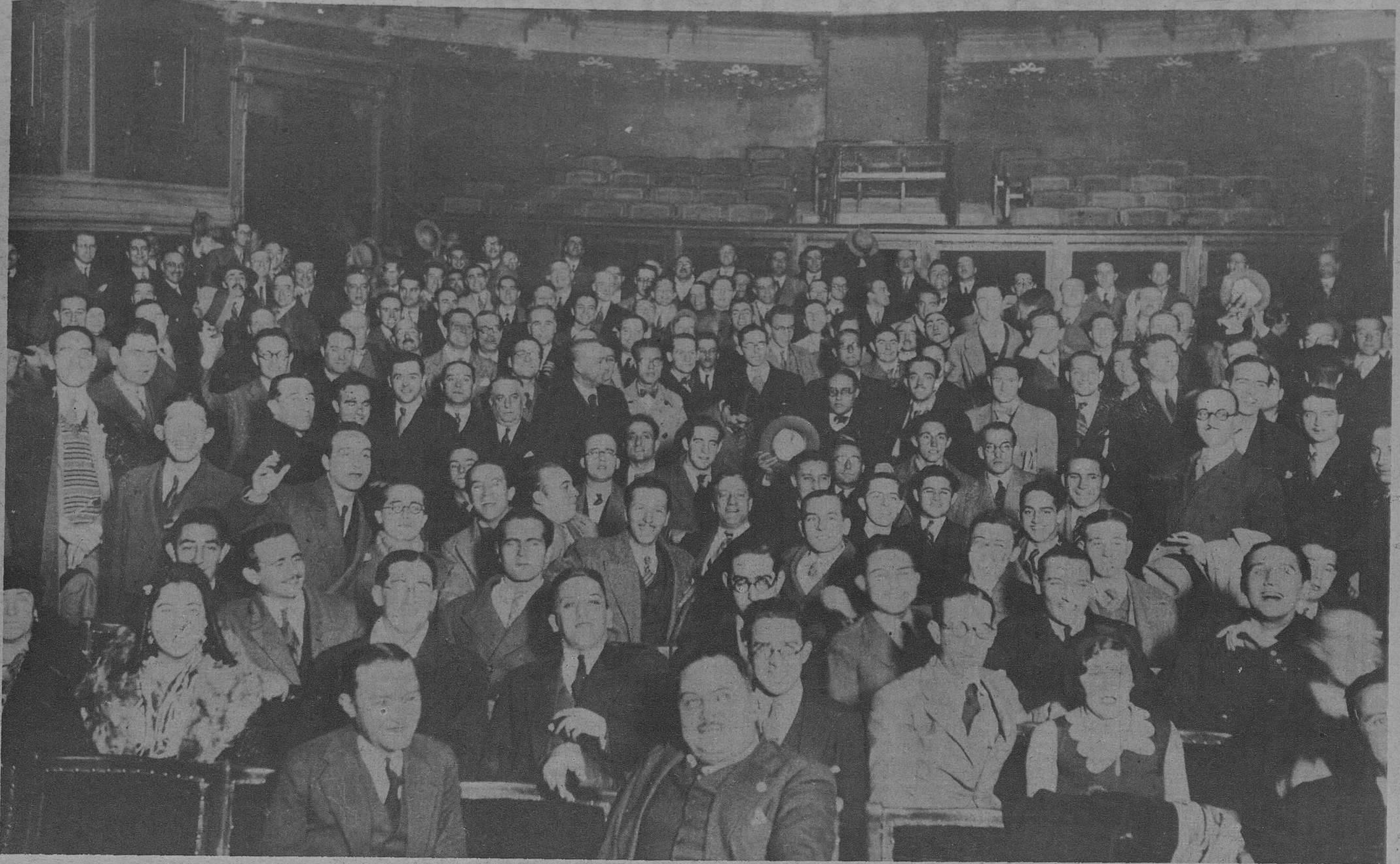
El Ateneo de Madrid, que se hallaba clausurado, es asaltado por sus socios, momentos antes de que se presentara la policía, y ésta lo hizo desalojar a viva fuerza.