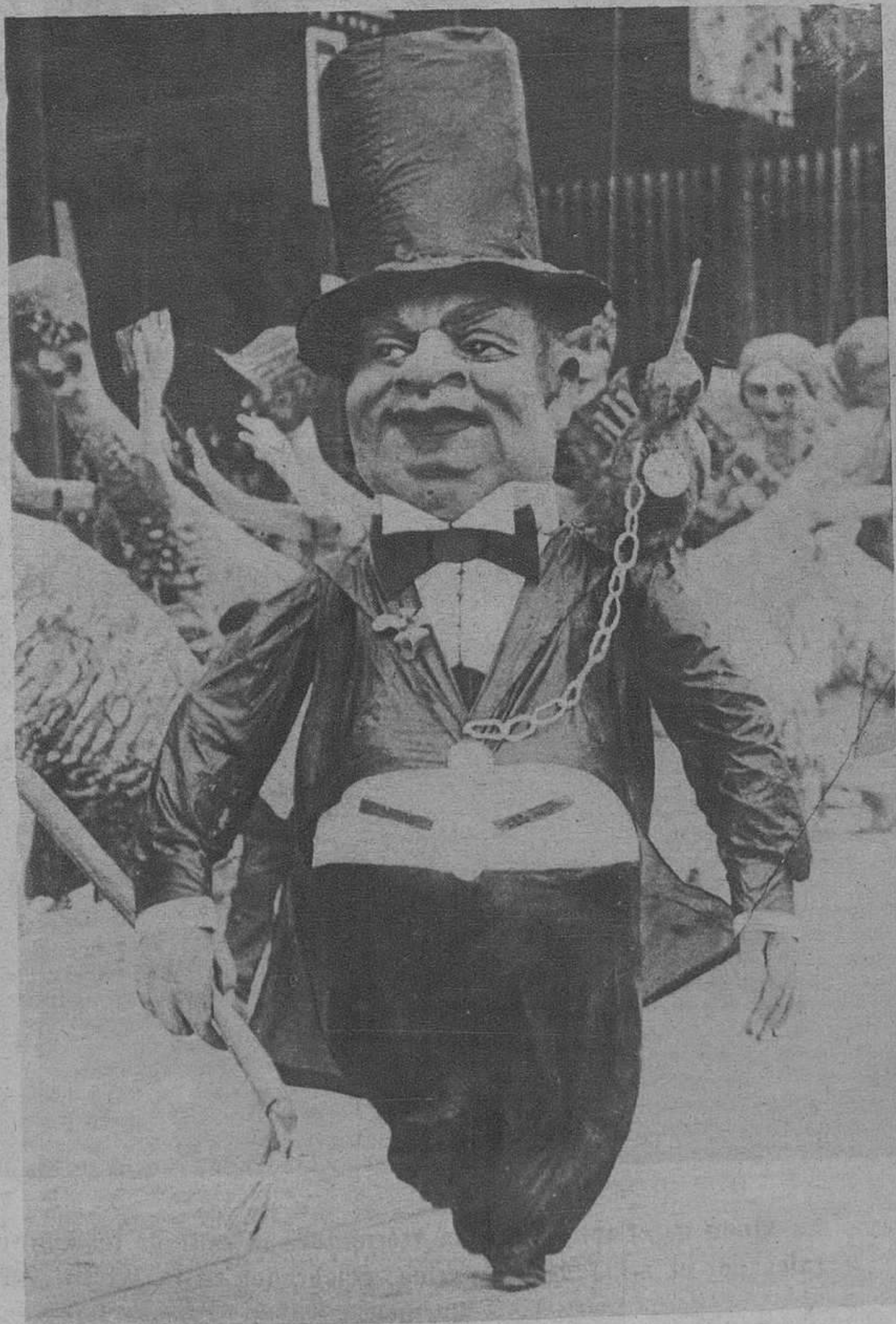
Varias escenas del Carnaval en Niza.