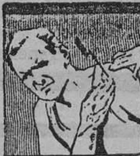
mata el dolor más agudo

La Exposición del Jardín estará abierta desde el 4 de Abril hasta el 30 de Junio.