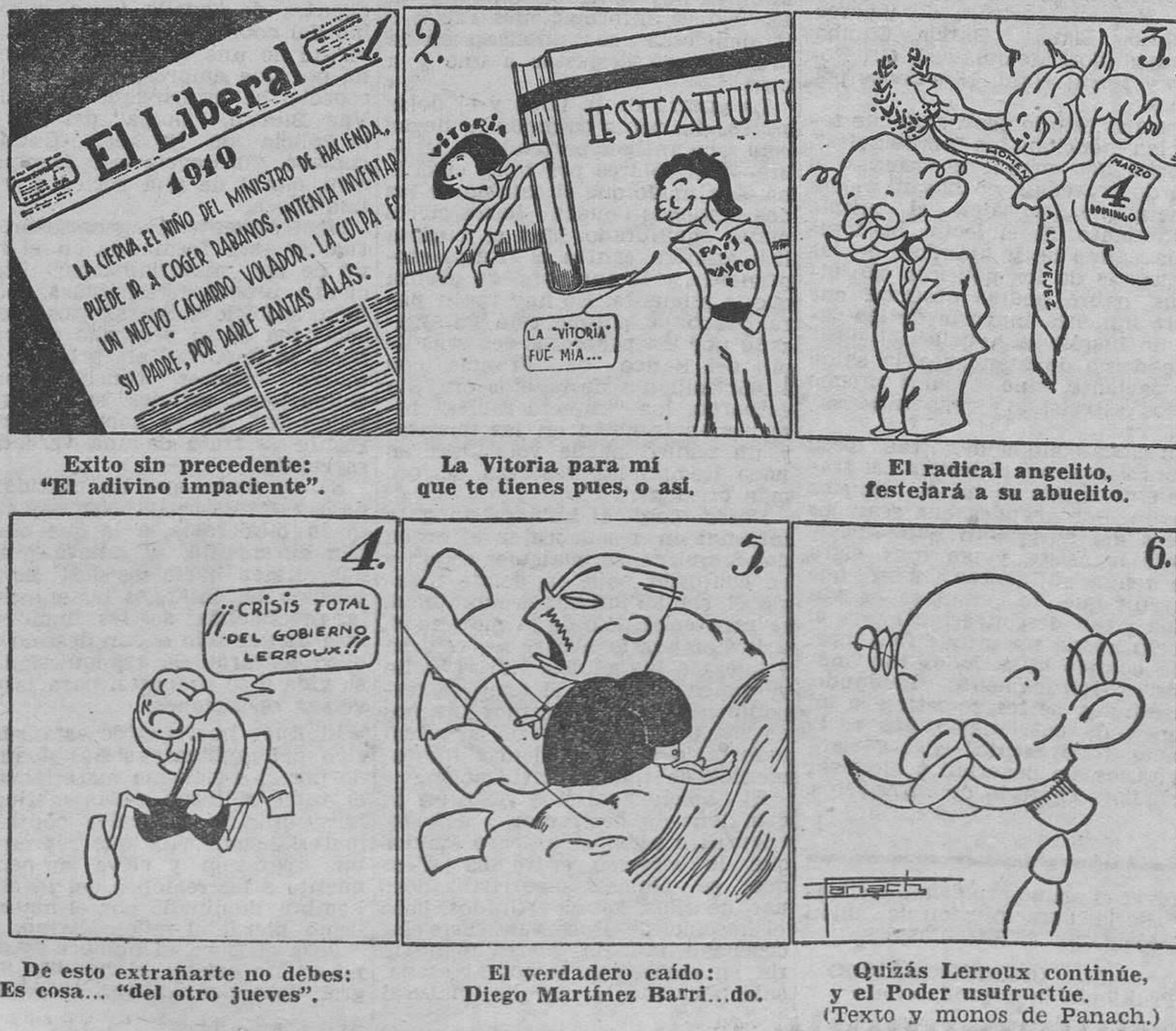
Exito sin precedente: "El adivino impaciente".