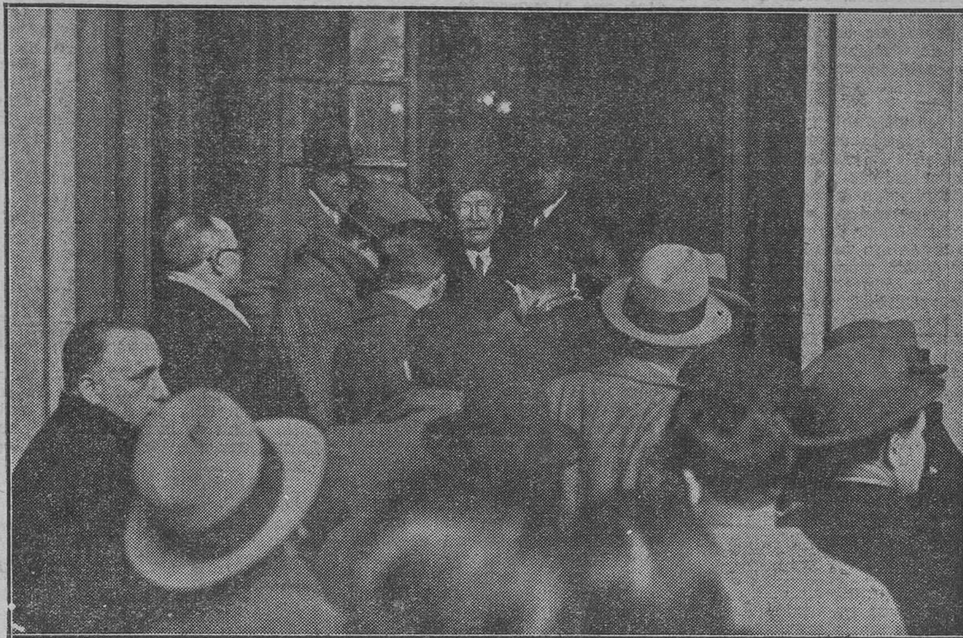
El señor Lerroux comunica a los periodistas que ha presentado la dimisión del Gabinete al presidente de La República.