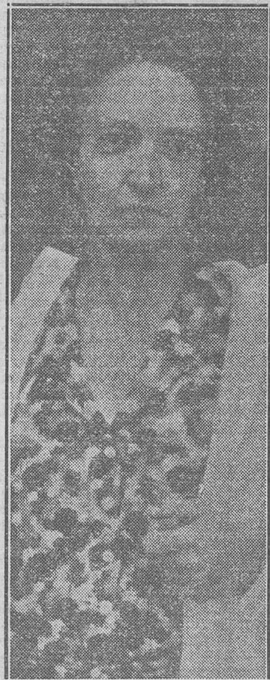
MME. JOLLIOT-CURIE, DESCUBRIDORA DE UN NUEVO PRODUCTO SUSTITUTIVO DEL RADIO.—Hija de los famosos descubridores del radio, madame Joliot-Curie trabaja actualmente en la resolución de los problemas científicos que tenía en estudio su madre, madame Curie, durante los últimos meses de su vida. Entre ellas se encontraba este de la sustitución del radio por otro producto en caso de necesidad, que ahora acaba de dar por resuelto

vado para comprobar en cualquier momento la efectividad de dicha garantía.