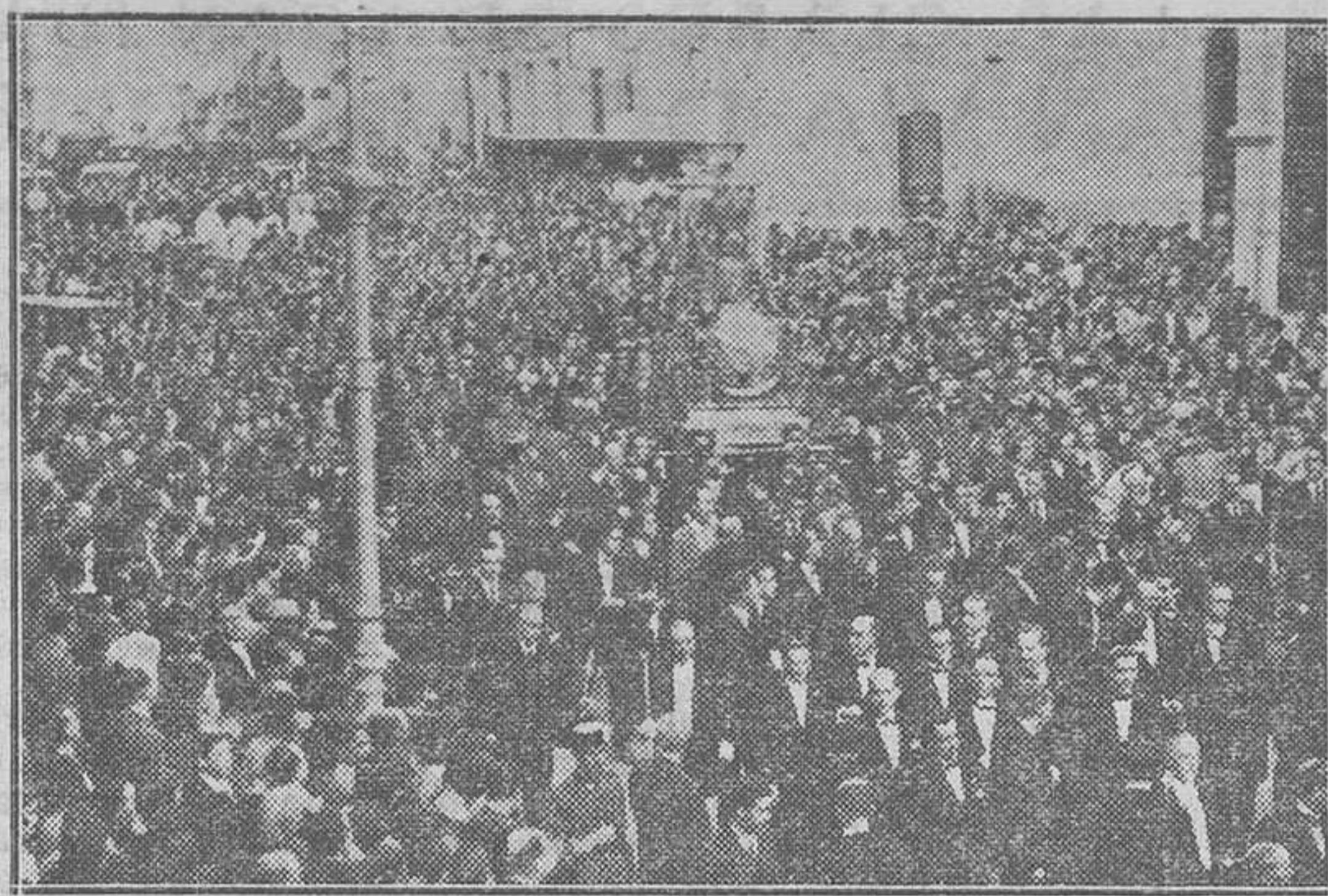
Las fiestas de otoño en Granada en honor de su Patrona la Virgen de las Angustias han terminado con la solemne procesión, celebrada con inusitado esplendor, en que la Virgen ha recorrido la capital entre fervoroso entusiasmo, después de tres años en que no se efectuaba la procesión.

Todo esto pasará, porque el mundo ha empezado a liquidar el ideal revolucionario. Todo esto pasará, pero entre tanto hay que armarse de paciencia y de tenaci-