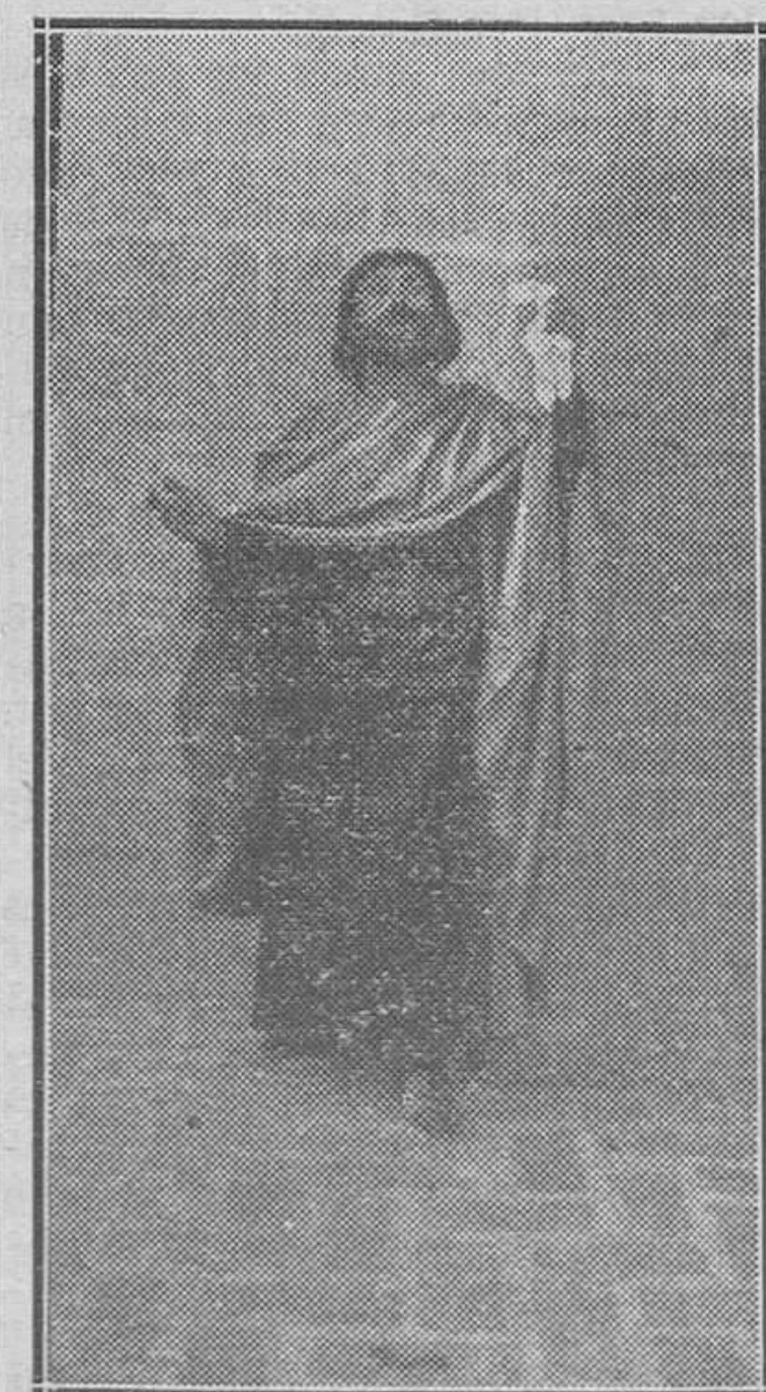
Santé Tomás... que llega tarde... porque las Indias le han retenido...

Esta última copla, según Soler Chacón, fué enmendada por el valencianismo polifonista del siglo