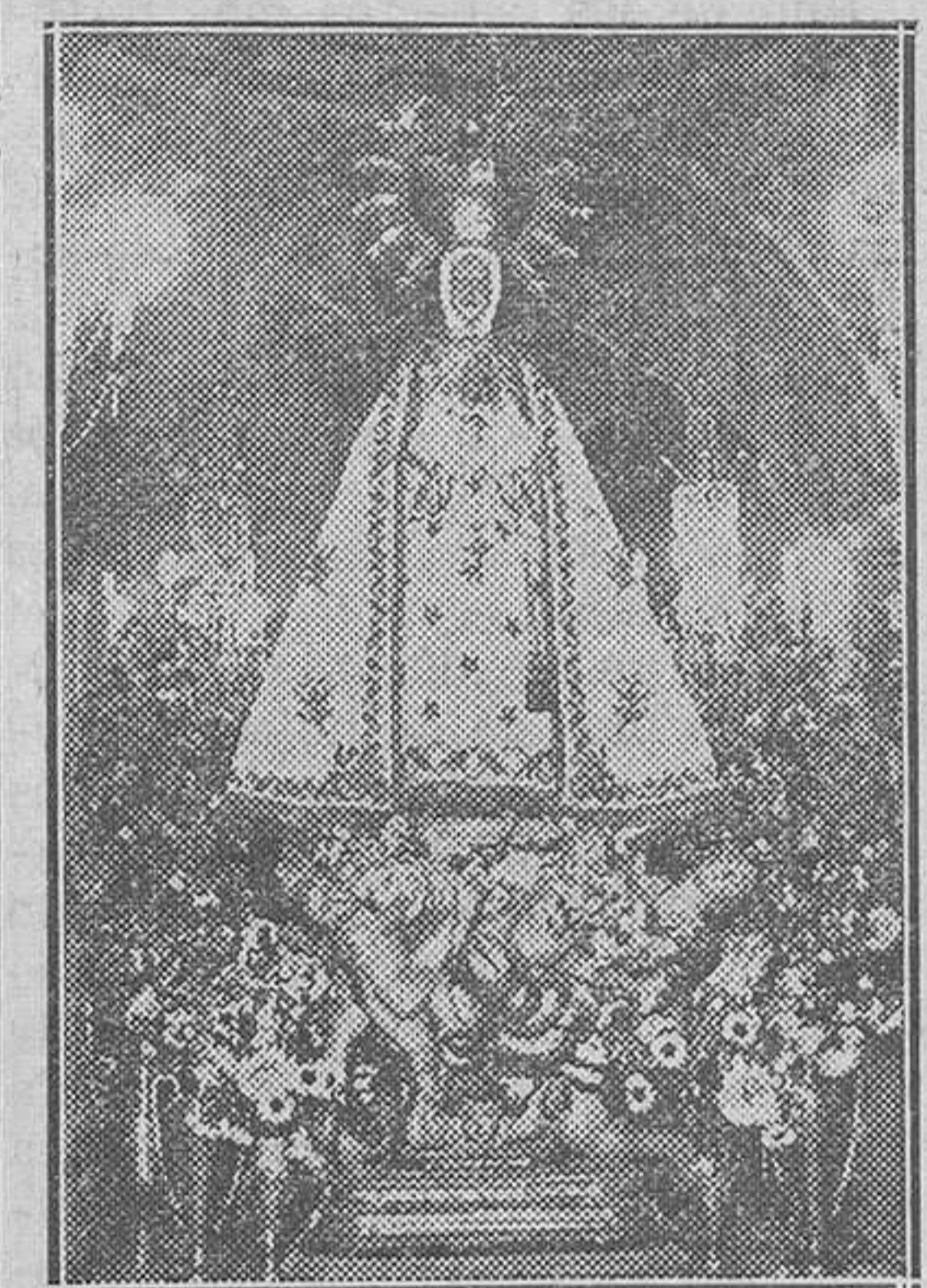
Imagen de Nuestra Señora de la Asunción, llegada a Elche en circunstancias milagrosas, según tradición, y que es coronada en "La Festa" (en su camarín).

do Jesus—y pelea con los judíos. Pedro viste capa pluvial en esta segunda parte. Mientras, los judíos—"Jueus", según el transcriptor Soler Chacón—cantan que antes de mostrar ninguna piedad con aquel cadáver, lo dejen. Siguen los judíos