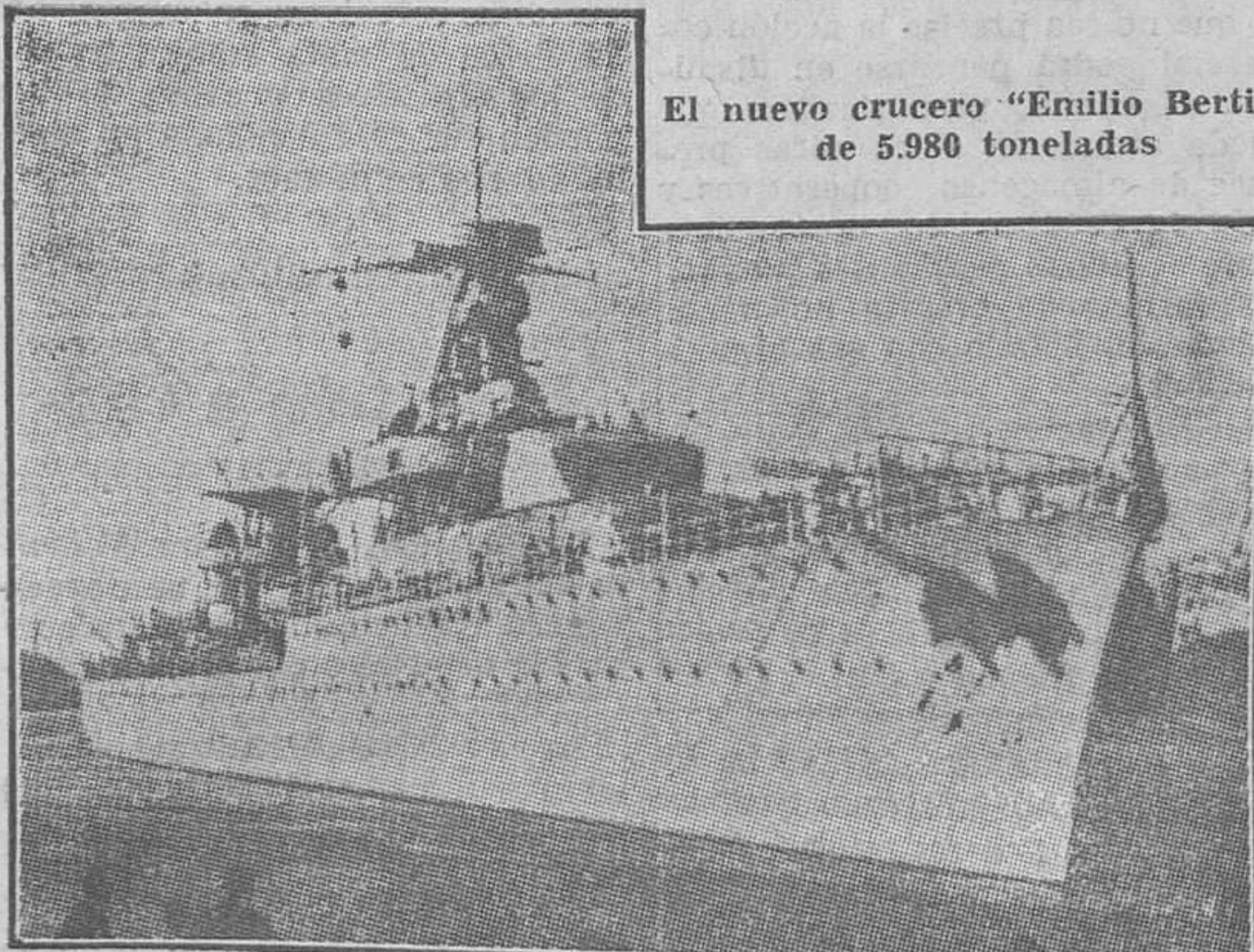
El nuevo crucero "Emilio Bertin" de 5.980 toneladas