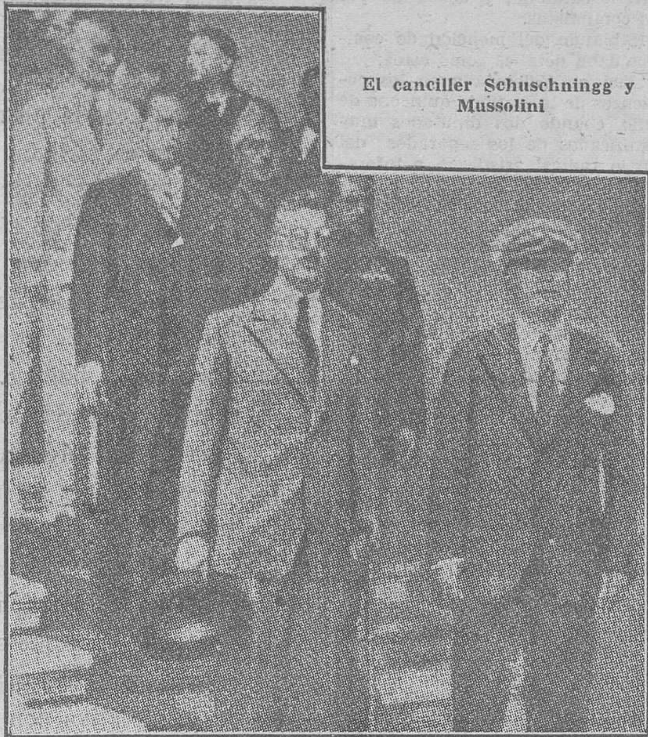
El canciller Schuschnigg y Mussolini

pronto tendrán que capitular. ¿Valía la pena hacer la guerra por estos resultados?