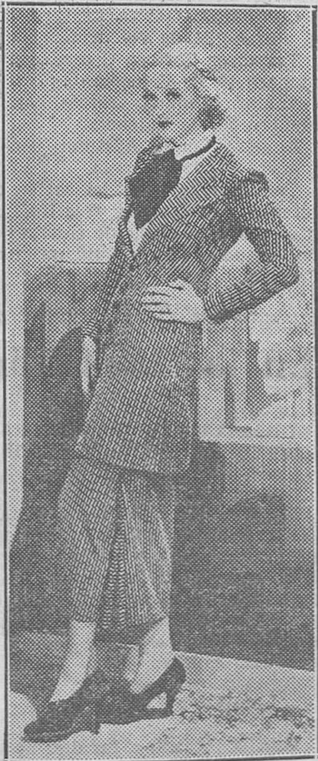
Bette Davis, la rubia más interesante de la Warner Bros First National, en un interesante papel de la película "El altar de la moda"

Los señores favorecidos en el Concurso que nos ocupa, pueden recoger los premios, desde hoy, en la Administración de LAS PROVINCIAS, Mar, 29, a las horas de despacho.