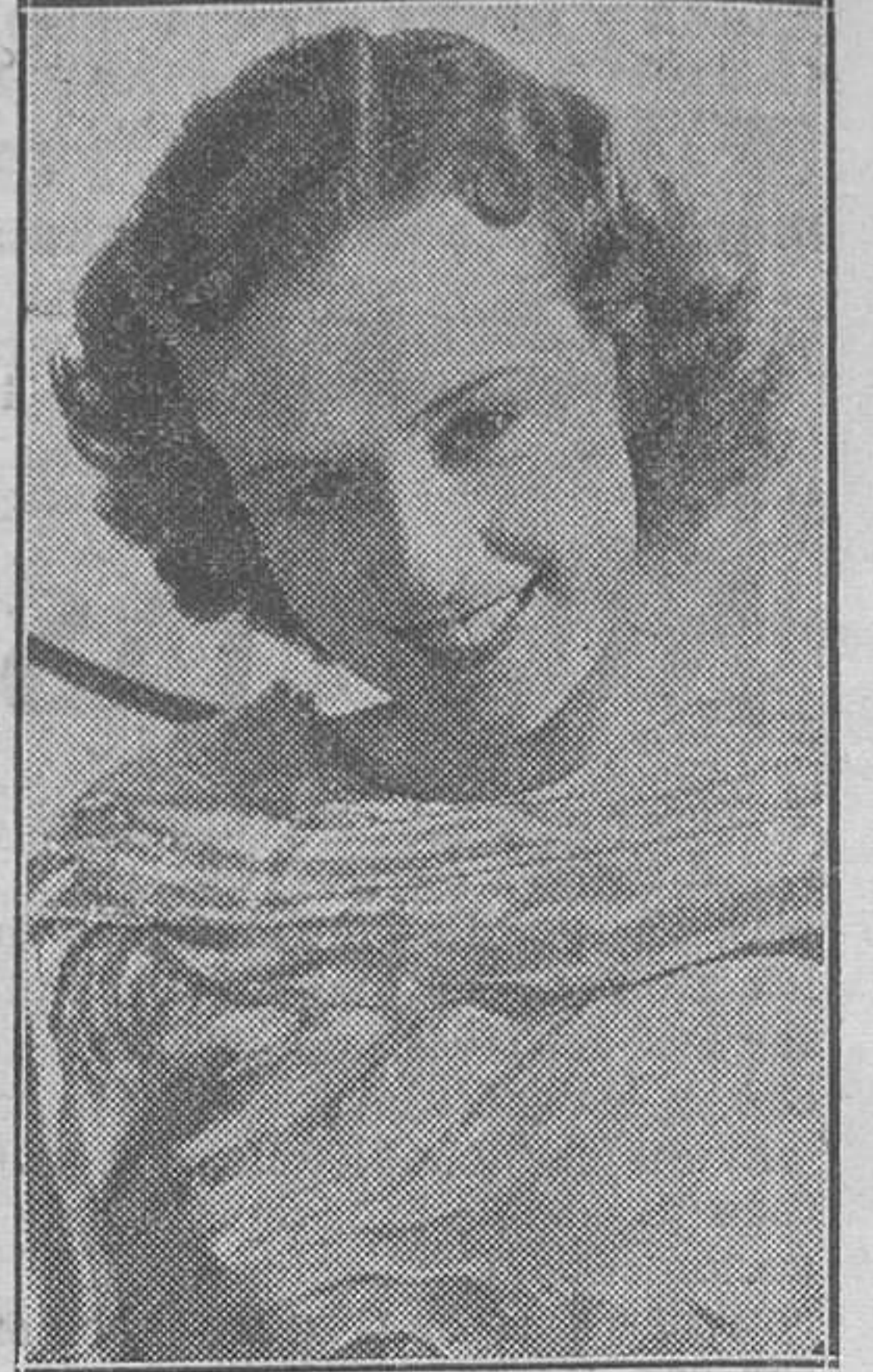
Margaret Lindsay, que se ha destacado pronto como una buena actriz, tiene un difícil papel en "Capturados", película de la Warner Bros First National

en la vanguardia de las distribuidoras nacionales, ofrece a las empresas de España, entre más de cincuenta seleccionadas películas de los estudios COLUMBIA PICTURES, PARIS FRANCE, BRITISH INTERNATIONAL PICTURES, C. E. A. y E. C. E. S. A., las siguientes GRANDES SUPERPRODUCCIONES.