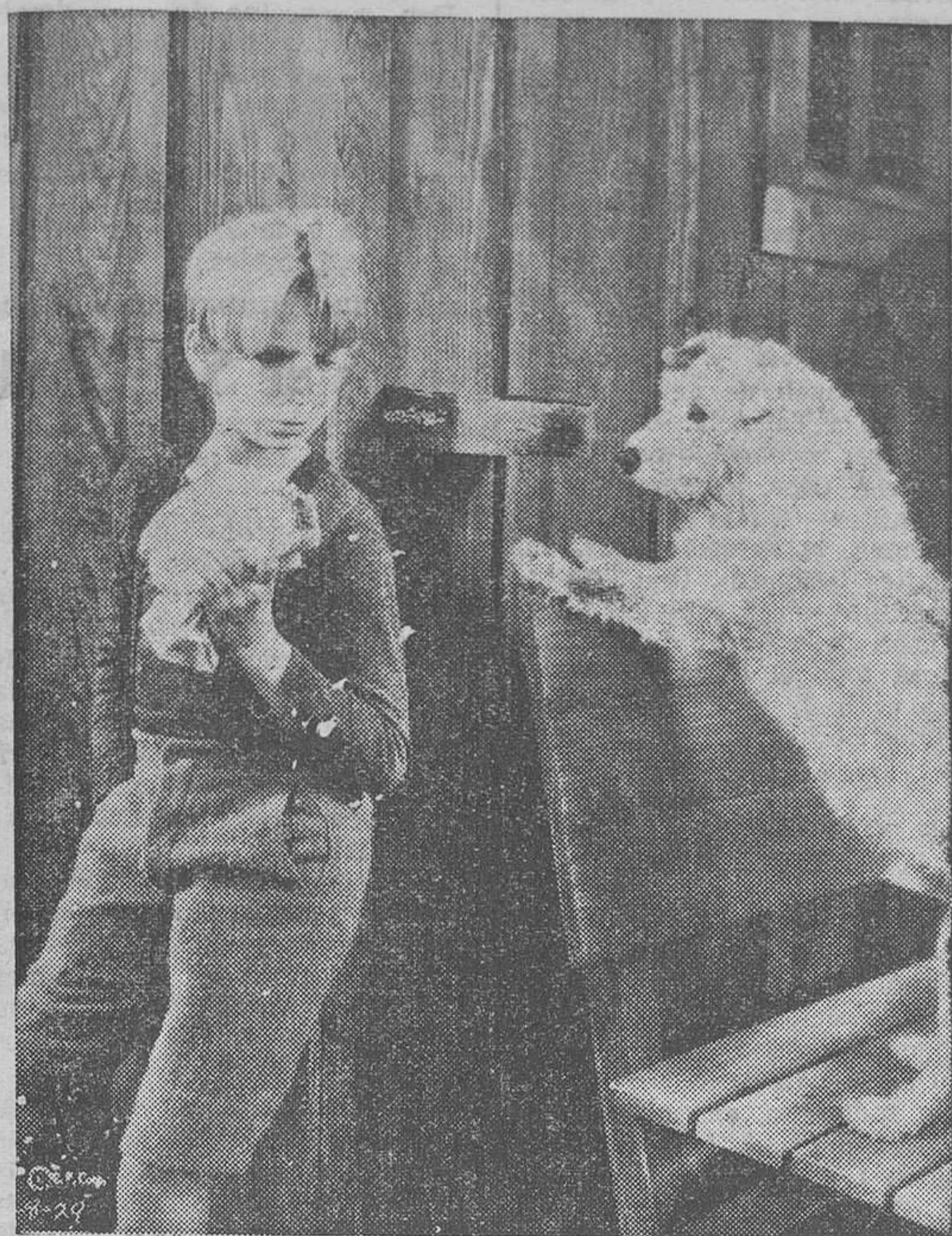
"Hombres de mañana", dirigida por Frank Borzage, gran producción Columbia que presentará Cifesa la temporada próxima. Esta es una de las escenas en que brilla más emocionadamente la gran maestría del pequeño artista George Breatsson