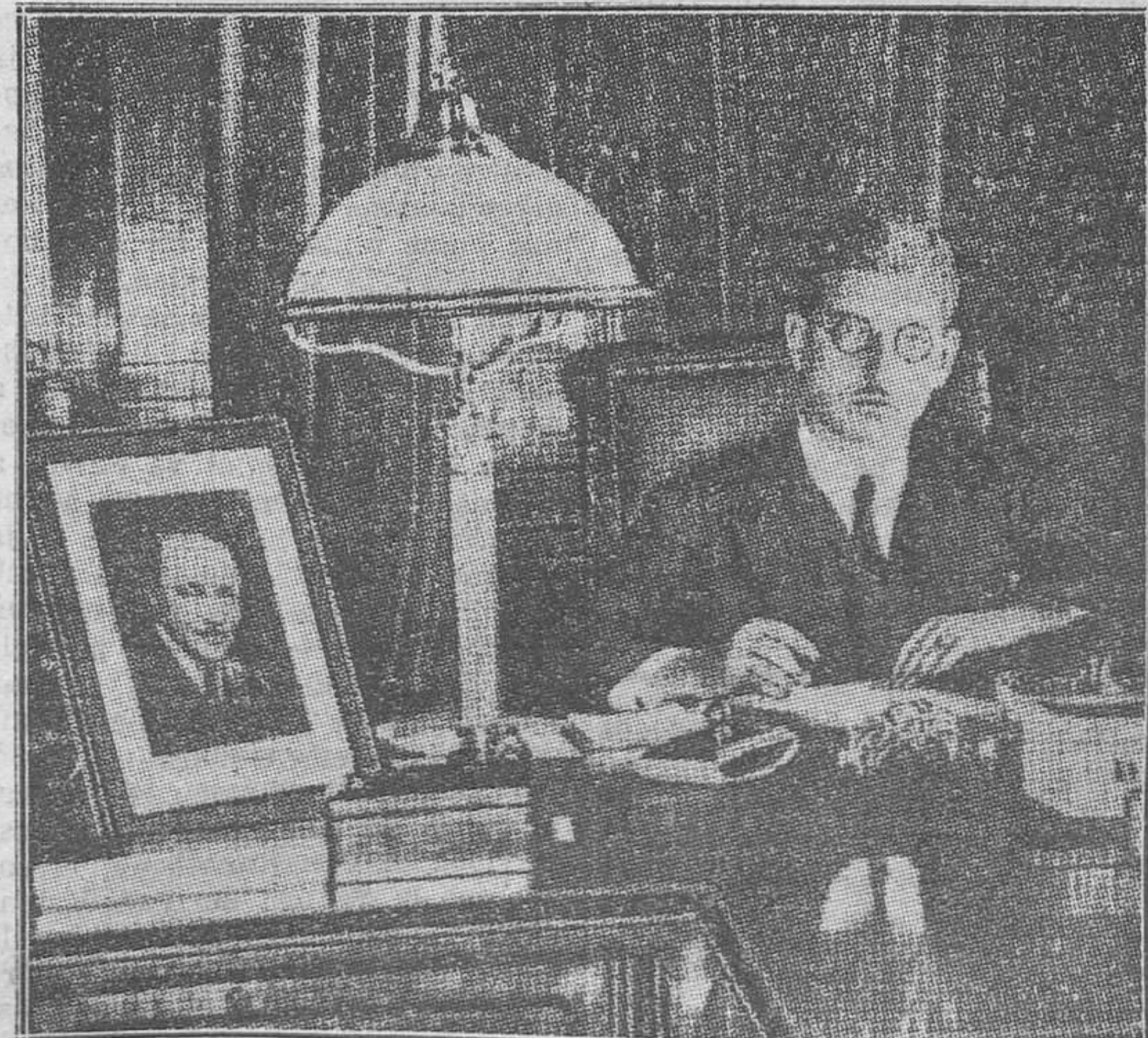
El canciller Shuschnigo, en su despacho; sobre su mesa vese el retrato de Dollfuss

Si con el perfeccionamiento de la sindicación está la salvación de