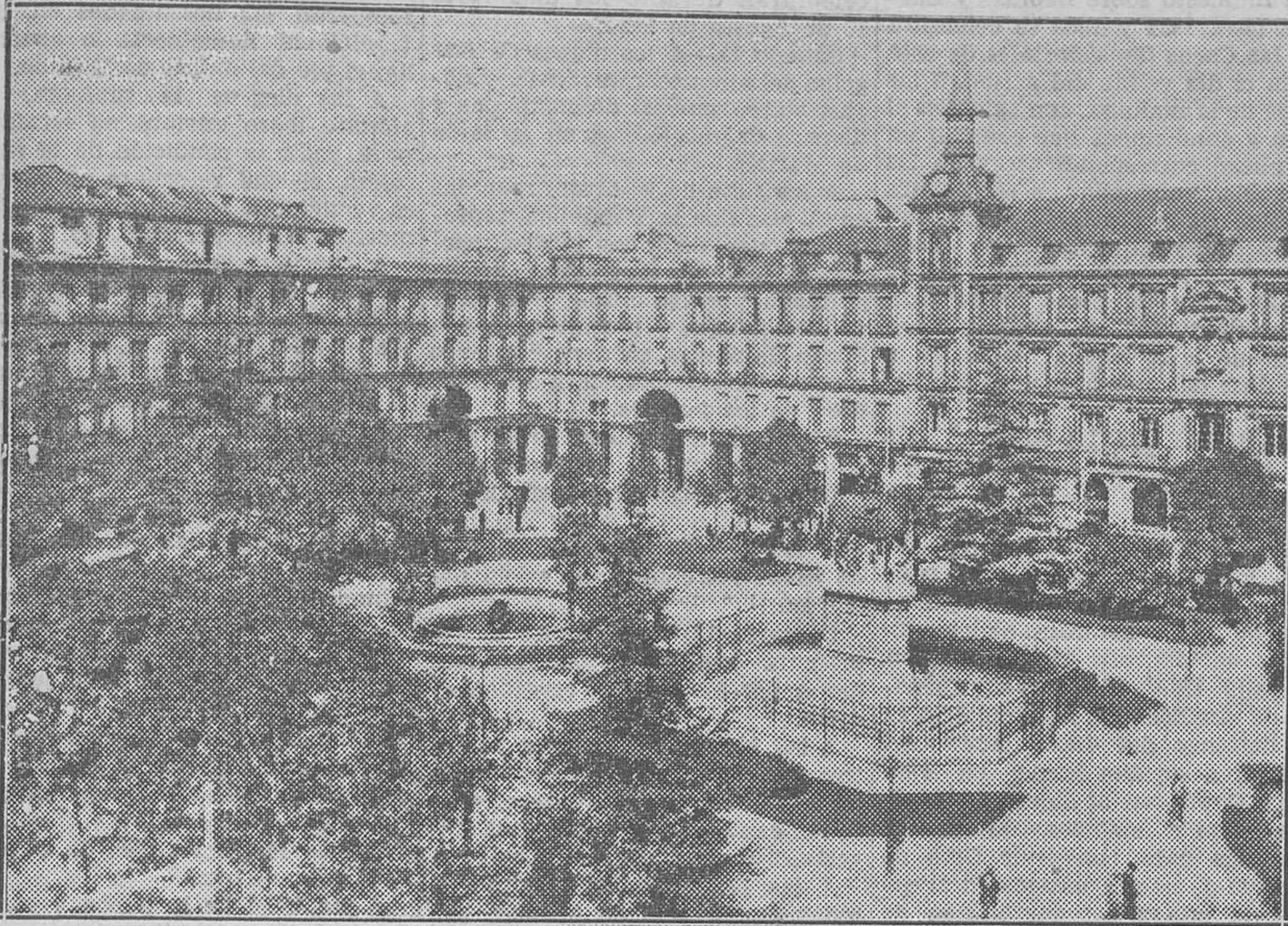
Madrid, plaza Mayor; en el centro se alza el monumento erigido a Felipe III

El pueblo madrileño, en su entusiasmo republicano, del mismo modo que a la pequeña estatua de Isabel II, le infirió, el día 14 de Abril de 1931, bárbaros ultrajes.