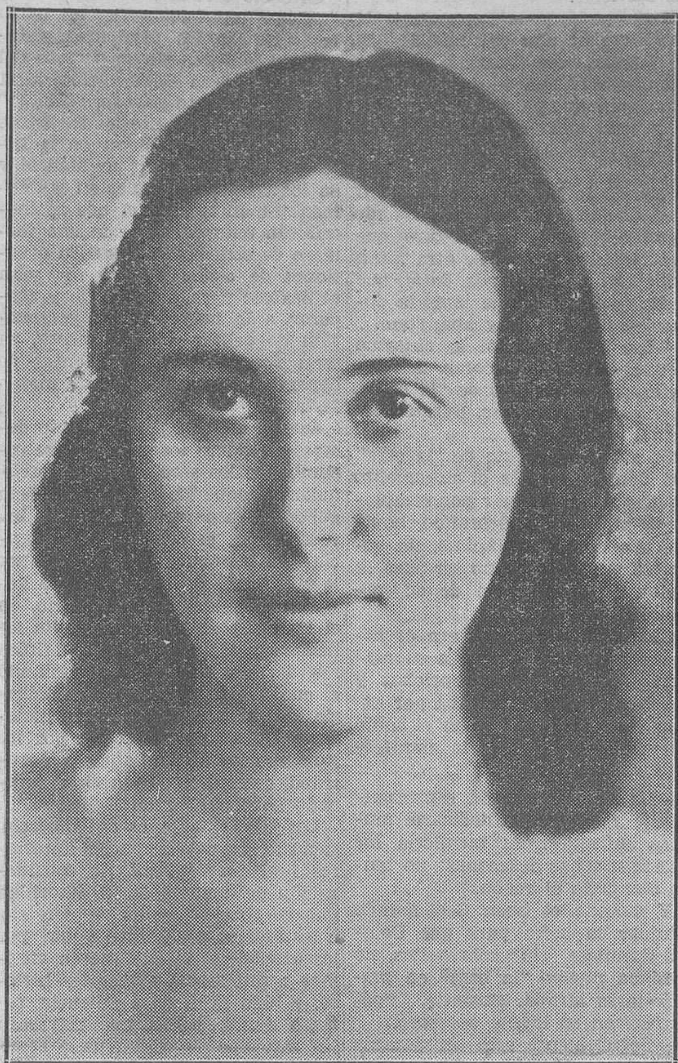
"Miss Hungría", una de las bellezas que se disputan el puesto de "Mis Europa"

Que Worpsswede fué algo más que una moda, nos lo dice y demuestra el hecho de que no haya pasado desapercibido el primer cincuentenario de su descubrimiento artístico. Algunos de los artistas que en el comienzo de su carrera fundaron la nueva escuela pictórica, siguen siendo fieles no sólo a sus cánones estéticos, sino también a la tierra misma donde encontraron y encuentran sus motivos inspiradores. Los profetas se convirtieron con el tiempo en maestros, y tan ligados íntimamente a su medio se sienten los artistas de Worpsswede, tan unidos y sujetos al ambiente que es como la savia de su creación artística, que muchos de ellos han echado en la tierra raíces, como los árboles y como los campesinos que les sirven de modelo. Nada más lejos de la fotografía que el arte—todo interpretación y estilización—de los pintores de Worpsswede, y, sin embargo, o quizá por ello, tienen la virtud de encender en el corazón de quien los contempla la llama inextinguible de la nostalgia. La fibra de atracción de Worpsswede ha sido extraordinaria, y poco a poco la aldea solitaria, sin dejar de serlo, ni siquiera con la llegada