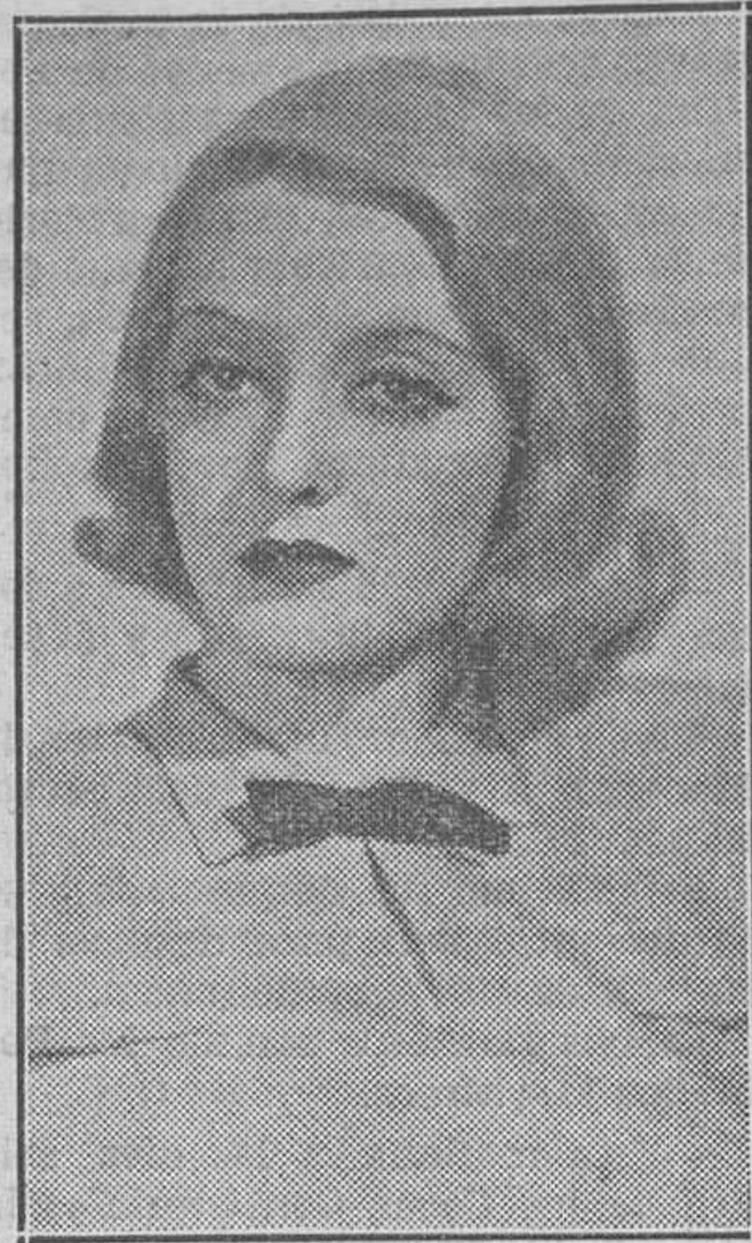
Bette Davis, artista de la Warner Bros First National, tan intrigante como siempre en "Los desaparecidos", película de esta importante editora