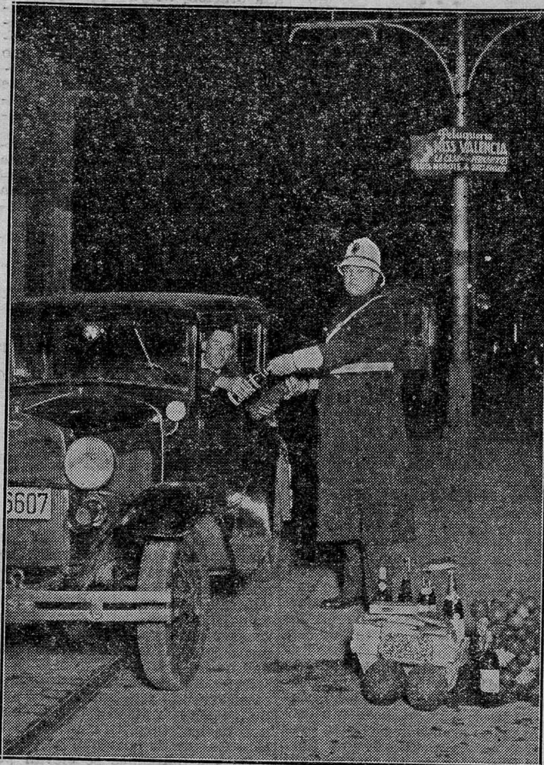
Los guardias urbanos de la circulación, obsequiados la Nochebuena por los automovilistas.