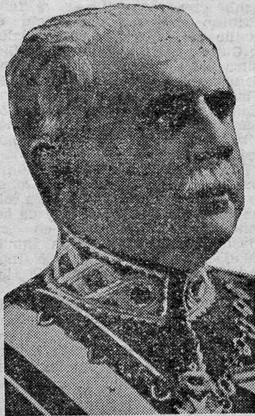
Don Florestán Aguilar, vizconde de Casa Aguilar, cuyo fallecimiento ha constituido una pérdida nacional